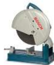
Sierra sin fin