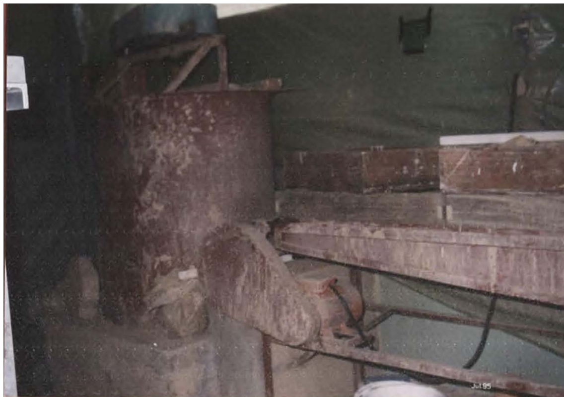
MEZCLADORA Y ZARANDA