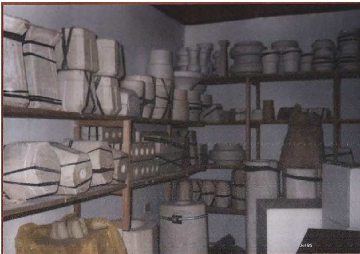
ESTANTERIAS CON MOLDES