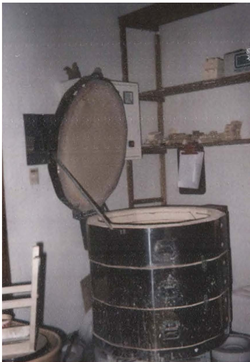
HORNO ELECTRICO DE 18 PIES CUBICOS