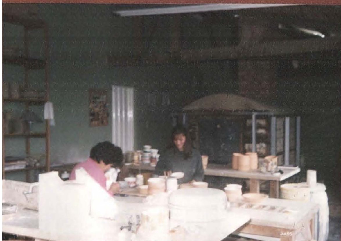
TRABAJADORES EN PINTURA