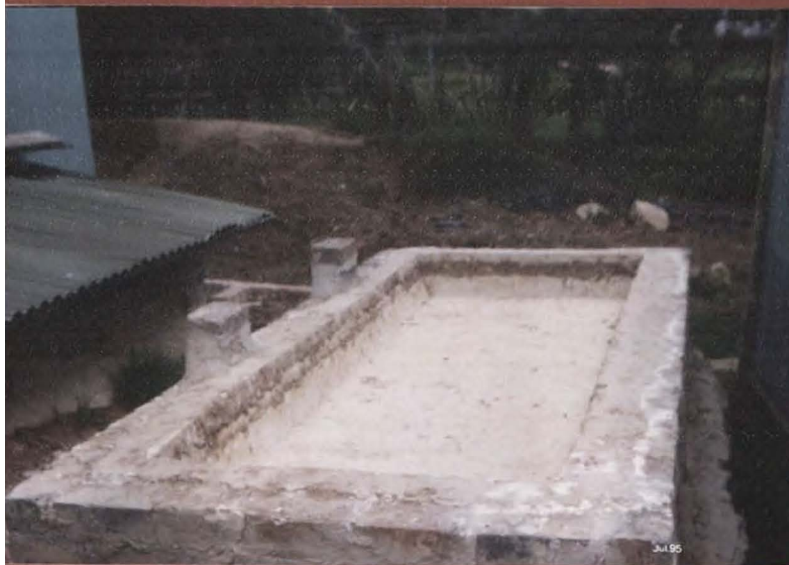
SECADOR EN YESO DE ARCILLA