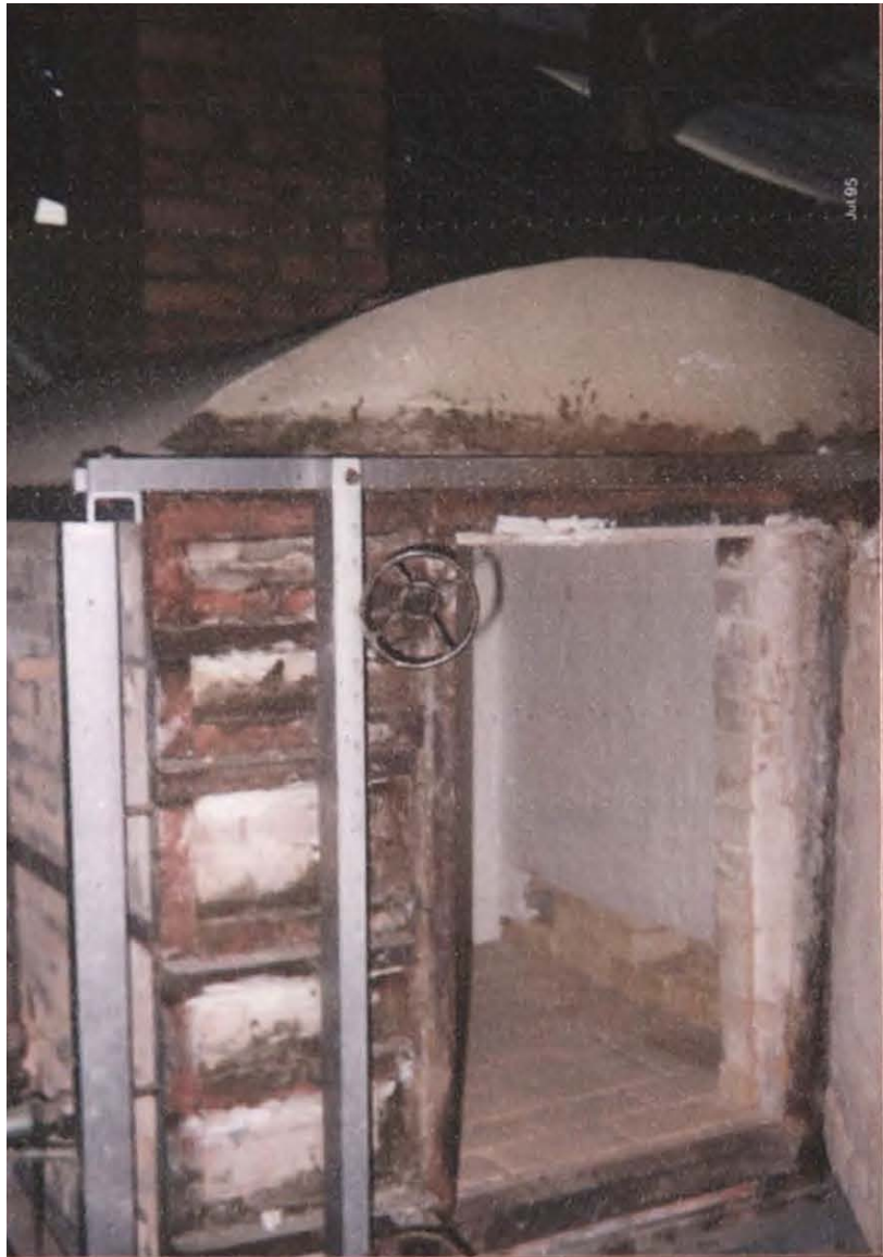
HORNO A GAS