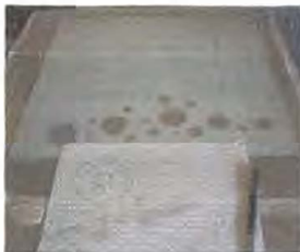
Plantillas para producción

Papel Maché. los artesanos en total cuatro personas, dedicados a este oficio elaboran productos decorativos como: muñecos en general, equipos de football, portarretratos alcancías y cometas.