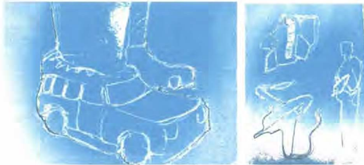
Bocetos de línea maleta y habuchas

maleta para niños, usando diferentes estilos de vehículos de transporte terrestre, aéreo y marítimo, generando líneas y colecciones.