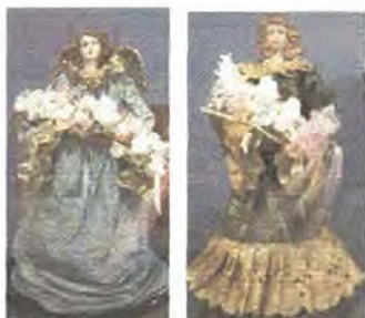
Referente de producto

Arte Quiteño. Una persona trabajando en este oficio, consiste en almidonar telas y aplicarles una pintura acrílica, proporcionándole a los personajes en este caso muñecas un aspecto envejecido que evoca épocas de remembranza.