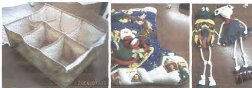
Foto Referente de productos

Patchwork. Los artesanos que trabajan en esta técnica corresponden a una familia en donde tres personas están dedicadas al oficio. Los productos principales que elaboran son edredones- colchas, cojines y objetos para navidad.