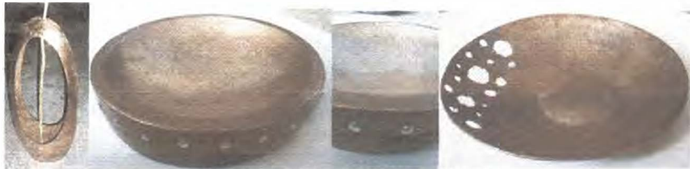
Foto floreros solitarios, fruteros y centros de mesa

producción. Cuentan con gran experiencia y tradición en el oficio y el manejo de la técnica. Los gitanos compran el material en Bucaramanga más o menos a dos horas de camino de ida y otras dos de regreso, el metal es escaso y costoso y debido a sus costumbres no compran sino con el dinero que disponen y lo necesario, cuando terminan el trabajo sobra material pero este es vendido por chatarra. La asesoría se enfocó en exaltar la técnica a través de diseños que fortalecieran el uso del martillo, con manejo de diferentes texturas y objetos cóncavos o convexos principalmente, que es lo que siempre han venido trabajando sin romper sus esquemas; esto es importante para futuras intervenciones sin imponerse sobre ellos ya que para ellos la vida es un fluir y es artesanía tradicional, desarrollando dos fruteros, un centro de mesa y dos floreros dejándoles plantillas para producción, finalmente para aprovechar el desperdicio se plantearon en boceto ideas para la elaboración de joyería, y se apoyó el proceso con la entrega de herramientas básicas como un dado, unos embudidores, un juego de limas, unos guantes y unos discos de lona para brillar y pulir las piezas.