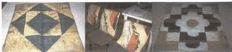
Línea de cojines

Manualidades. Las personas que trabajan en manualidad, se dividen en tres grupos de acuerdo a la actividad principalmente descritas a continuación: