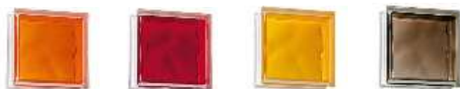
Posibles tonos de color en vidrio