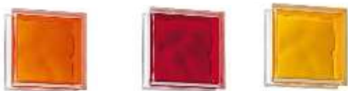
Posibles tonos de color en vidrio