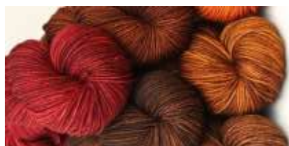
Posibles tonos de lana para acentos.