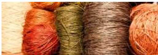
Posibles tonos de fique