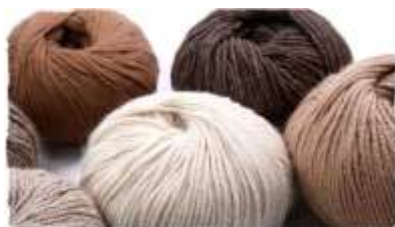
Posibles tonos de color en lanas