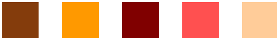
Posibles tonos de color en pintura