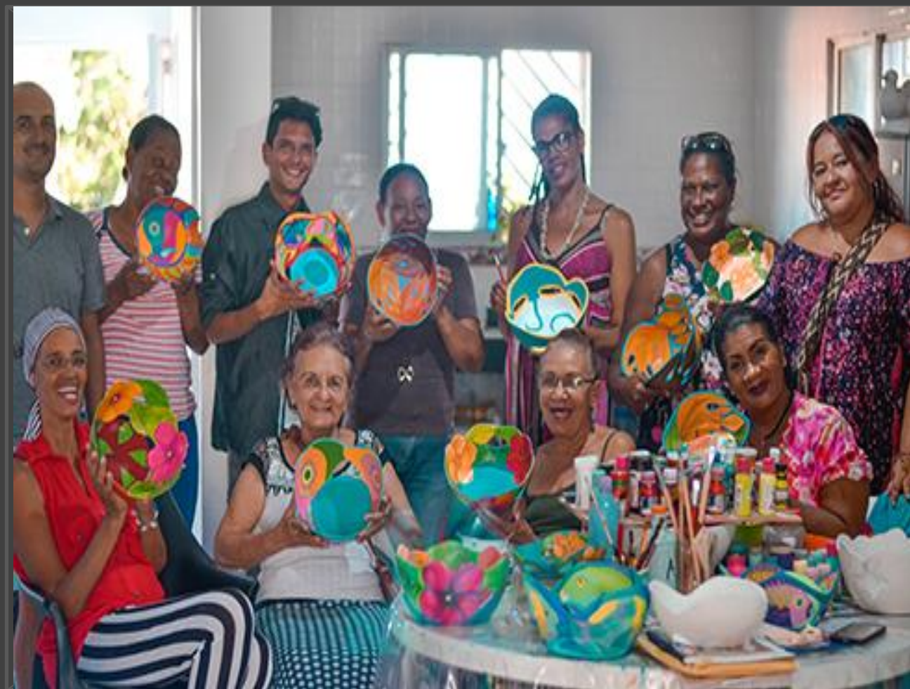
Foto tomada por: Recuperada de http://www.xn--elisleo-9za.com/index.php?option=com_content&view=article&id=16770:da-fiwi-mache-la-magia-del-color&catid=39:cultura&Itemid=82