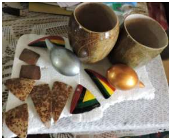
Fotografía 2. Elaboración de maracas

pulen y cortan. Hace falta mucho trabajo para pulir las piezas pues no han tenido gran asesoría y no tienen buenas combinaciones del color. Hace falta mucho trabajo de diseño. Otro artesano del grupo recolecta iraca y teje esteras, abanicos, escobas, etc. Además se tejen mochilas en fibra de majagua.