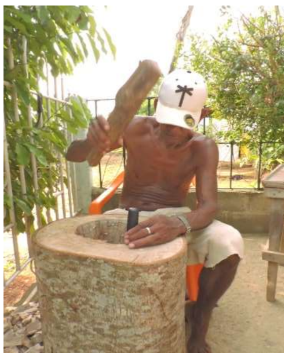
Fotografía 1. Fabricación de tambores