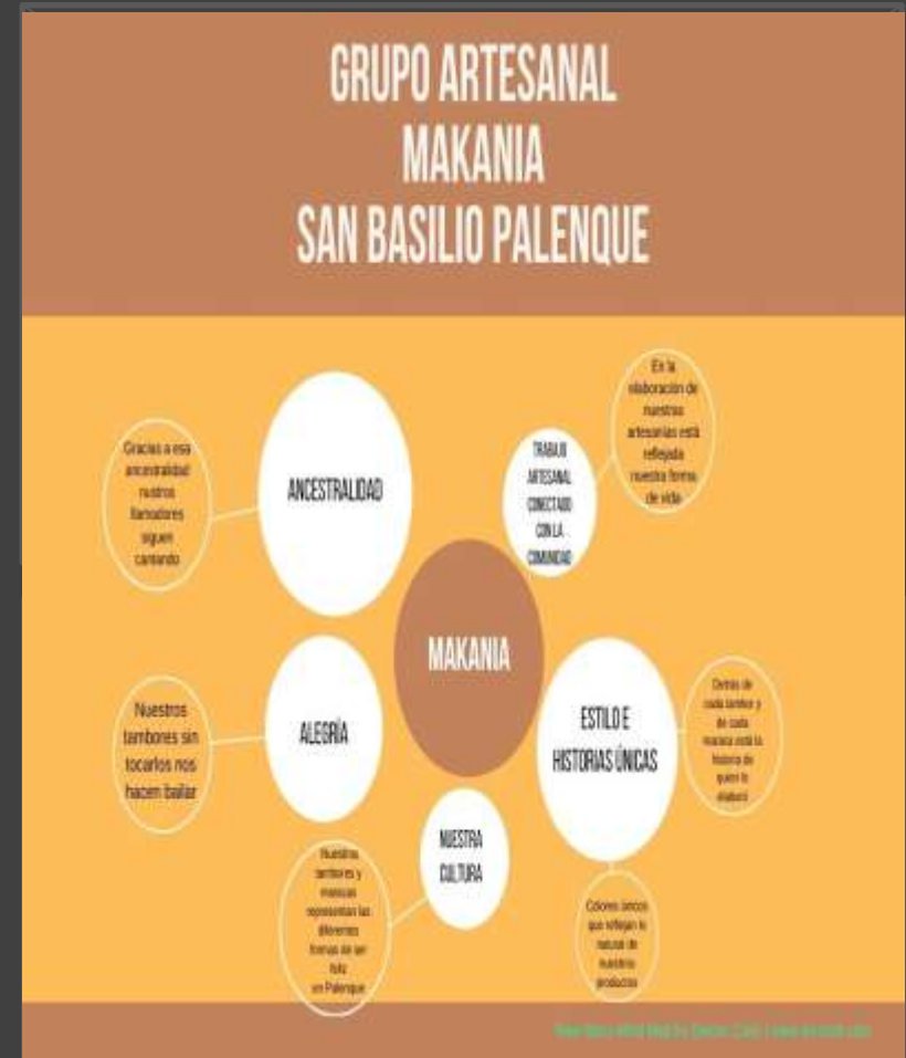
Pantallazo de la llamada de whatsapp y diagrama de apoyo para la grabación del video.