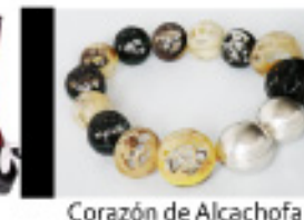
Corazón de Alcachofa