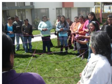
Primera dinámica de reconocimiento- Ipiales-“Tejiendo nombres”

Es así como con este primer espacio de Diálogo-Taller, se inicia el desarrollo del Taller de Resolución de Conflictos, dando paso a un segundo espacio llamado “Cambio estilo de vida”, el cual se desarrollará en la próxima sesión: Primera semana de Agosto. Entrelazando el tema anterior, con el fin de que las artesanas vayan articulando los temas, durante todo este proceso de sensibilización, como parte de ese primer componente fundamental como lo es el de Organización y Humano.