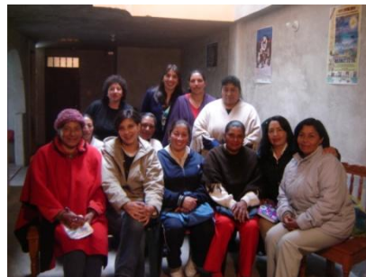
Grupo-Pupiales-Diálogo-Taller: “Cambio Estilo de vida”