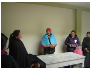
Guachucal-Identificación de conflictos

IDENTIFICACION DE CONFLICTOS: Envidias, Rivalidades, celos, falta de comunicación, intolerancia, incomprensión, falta de mayor compañerismo, mentira, falta de unión del grupo.