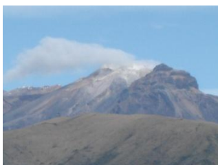
Vista del volcán Cumbal, desde la casa del cabildo donde se desarrollan los diálogos-taller

IDENTIFICACION DE CONFLICTOS: La desconfianza, inasistencia, falta de saber escuchar y entender, intolerancia, baja autoestima. Falta de comunicación, pérdida de valores, irresponsabilidad, falta de apoyo de entidades, egoísmo, individualismo, la mentira, impuntualidad, incomprensión, crítica destructiva.