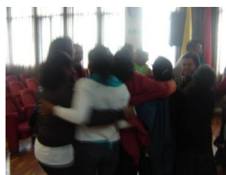
Dinámicas de Interrelación-Ipiales