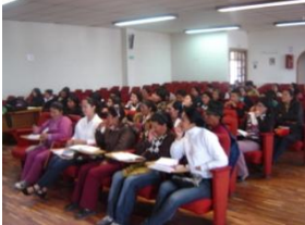
Ipiales-Cámara de comercio

IDENTIFICACION DE CONFLICTOS: Inconvenientes en la comunicación, el egoísmo de algunas personas, la falta de disponibilidad de tiempo, impuntualidad, desacuerdos por falta de conocimiento, falta de confianza, la diferencia de opiniones sin llegar a acuerdos, el malgenio de algunas personas, la irresponsabilidad de algunas compañeras, el no compartir, la incomprensión, intolerancia, dificultad para expresar sentimientos y pensamientos, falta de recursos, Negligencia de algunos líderes, Falta de reconocimiento a la labor artesanal, falta de liderazgo, falta de equidad de género.