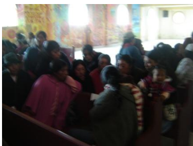
Trabajo en grupo-Cumbal “El Otro y Yo”