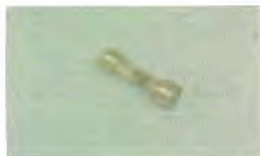
Broche Fibras, “Muelle”

Miércoles: Fibras, “Muelle” y Mariposa, “Espartillo”.