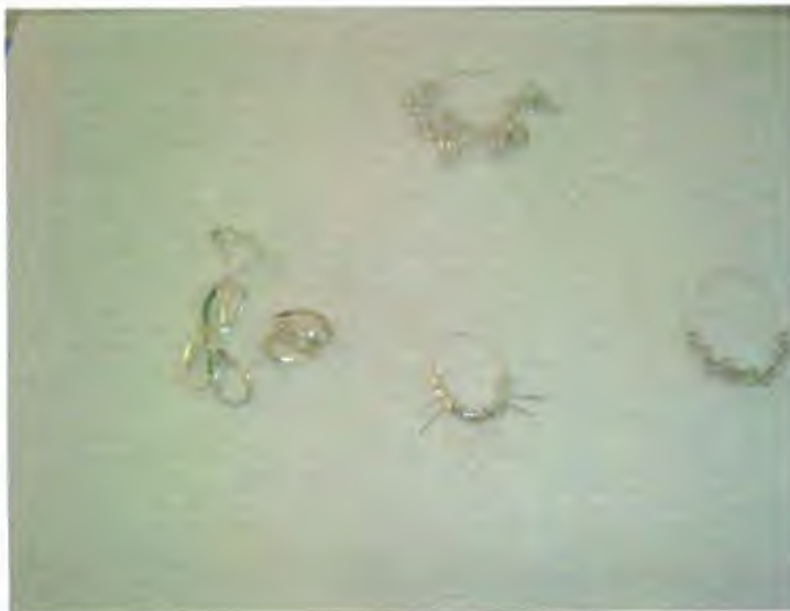
Mariposas, cadena y aro,