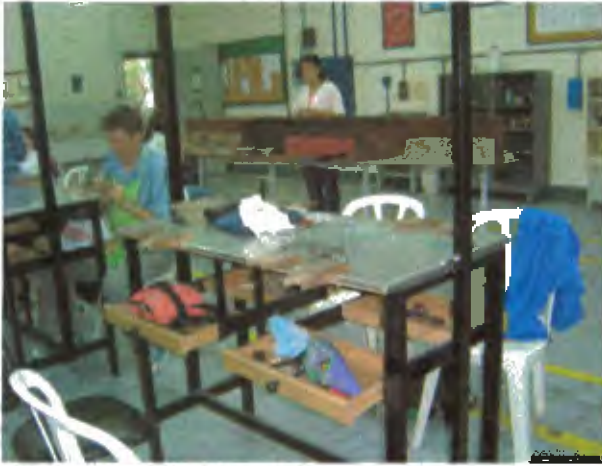
Taller de Joyería del SENA, Medellín

Se visitó el taller del SENA, y se divulgó el proyecto.