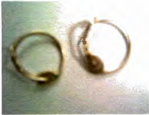
Aretes Largos, "Loft"

Viernes: Prendedor, "Garza" y filigrana, "Corazón"