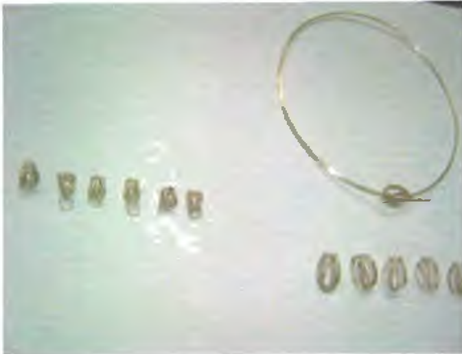
Broches para aro y cadena