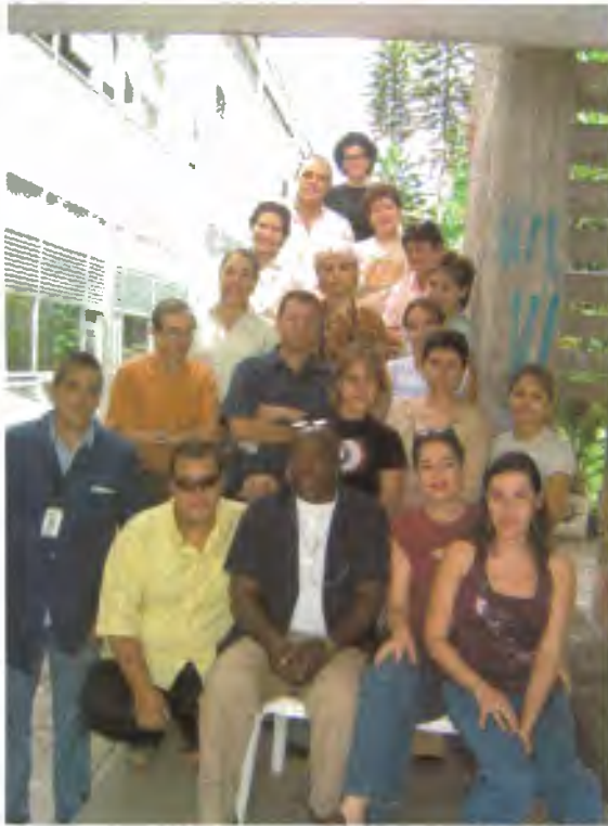
Foto del grupo 01.07.06

El sábado se hicieron las conclusiones y el cierre.