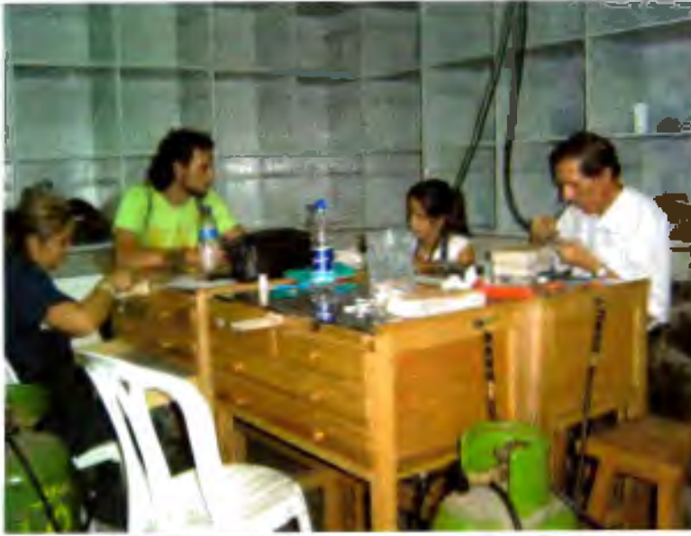
UPB Cierres y broches