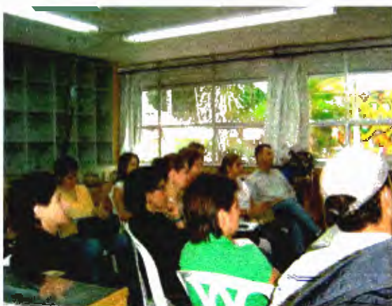
Curso de cierres broches asistentes 27.06.06