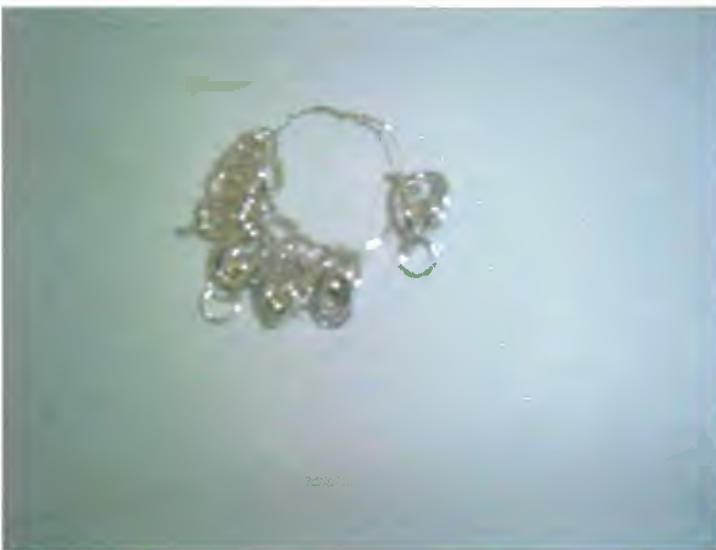
Broches para cadena "Espartillo"

Martes: 2 Broches para aro (de sección redonda y cuadrada), "Espartillo" y broche de cadena "Espartillo".