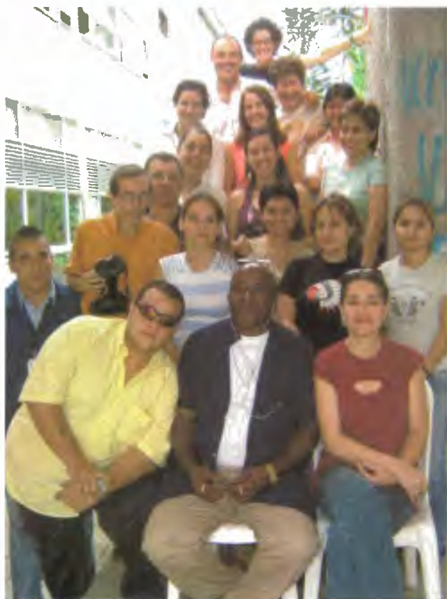
Foto del grupo 01.07.06