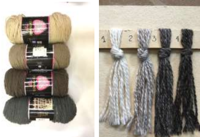
Lanas acrílicas y mezclas con lana natural. Tenjo Cundinamarca, Septiembre de 2019, Constanza Téllez. Artesanías de Colombia S.A.