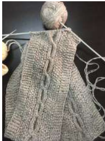
Herramientas taller de tejeduría. Tenjo Cundinamarca, Septiembre de 2019, Constanza Téllez. Artesanías de Colombia S.A.