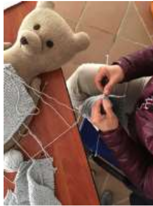
Herramientas y proceso.

Municipio de Tenjo Cundinamarca, Septiembre de 2019, Foto Constanza Téllez. Artesanías de Colombia S.A.