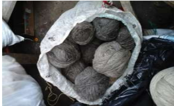
Materia prima Lana 100 % natural. Tenjo Cundinamarca, Septiembre de 2019, Constanza Téllez. Artesanías de Colombia S.A.