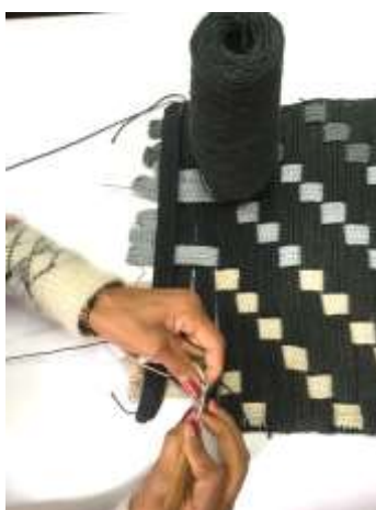
Herramientas taller de tejeduría. Tenjo Cundinamarca, Septiembre de 2019, Foto Constanza Téllez. Artesanías de Colombia S.A.