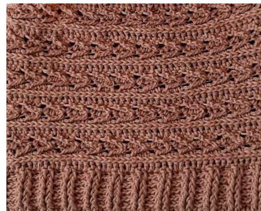
Tejido en crochet