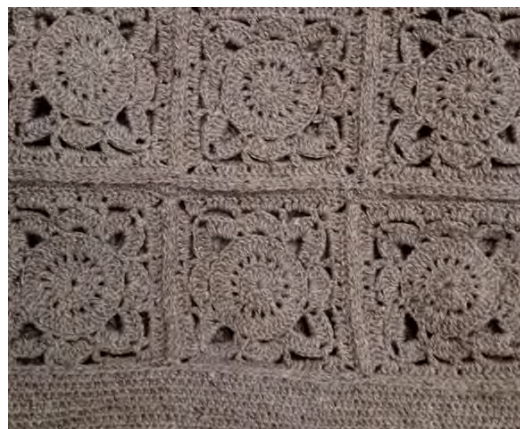
Tejido en crochet