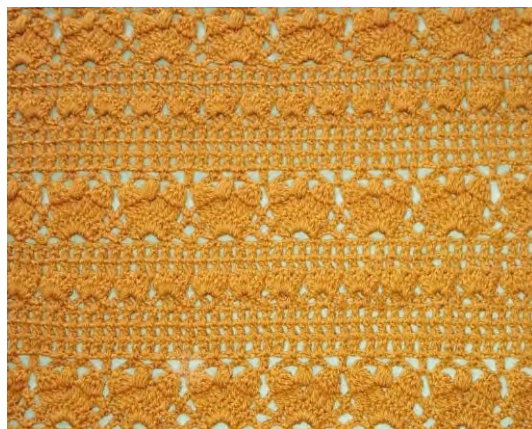
Tejido en crochet