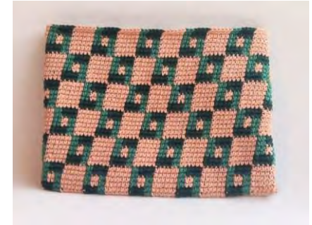
Prueba producto cartucheras