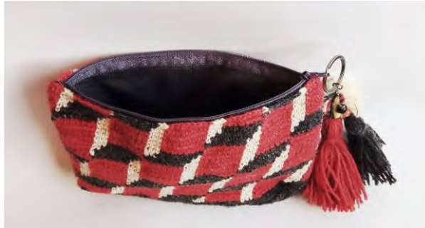
Tapicería en crochet a 3 colores