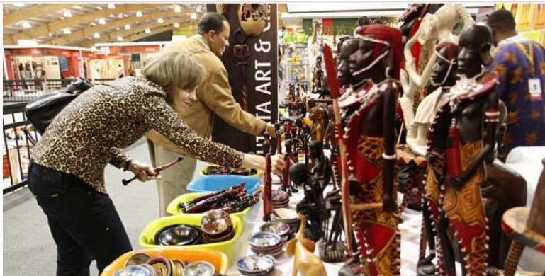
Un espacio abierto al público para disfrutar de lo mejor de las artesanías colombianas.

RELACIONADOS: INDÍGENAS | ARTESANÍAS | COFERIAS