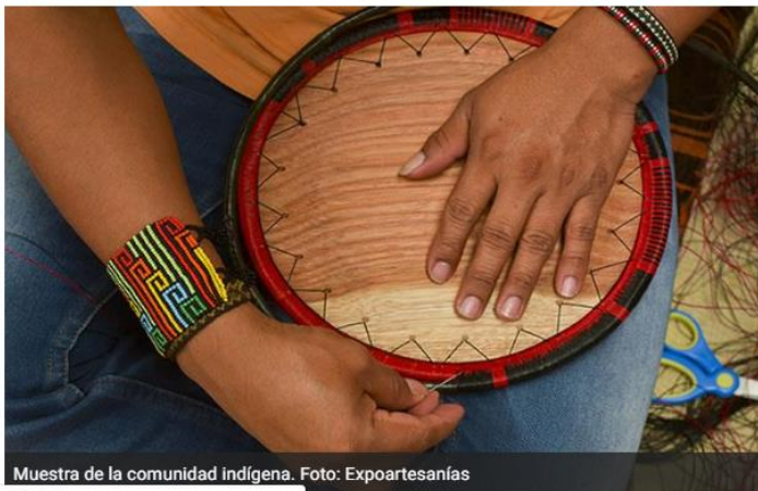
Muestra de la comunidad indígena.