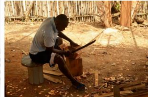
La 'Herencia' se vistió de color con el Encuentro Empresarial de Herencias Negras, Afrodescendientes, Raizales y Palenqueras, NARP.