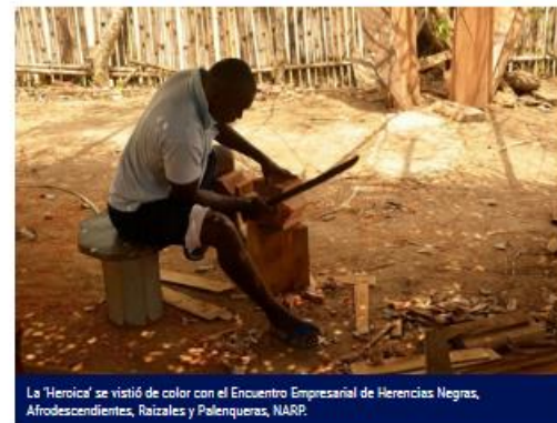
La 'Herencia' se vistió de color con el Encuentro Empresarial de Herencias Negras, Afrodescendientes, Raizales y Palenqueras, NARP.