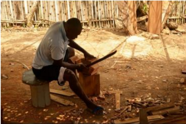
La "Heroica" se vistió de color con el Encuentro Empresarial de Herencias Negras, Afrodescendientes, Raizales y Palenqueras, NARP.