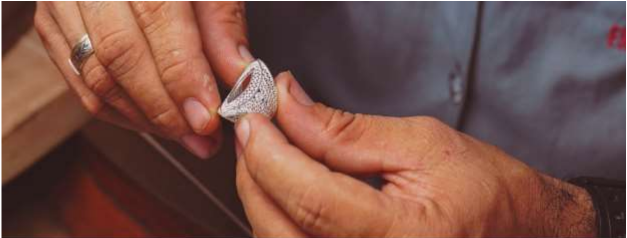
Ilustración 5 Quiñonez, Natalia. Banner Feria Moviendo Tradiciones