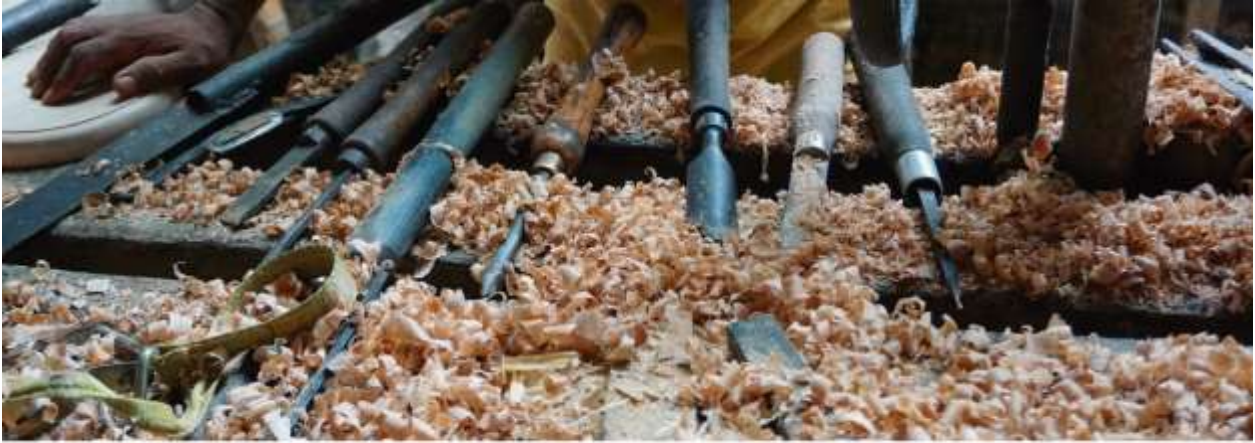
Ilustración 4 Quiñodez, Natalia. Banner Feria Moviendo Tradiciones