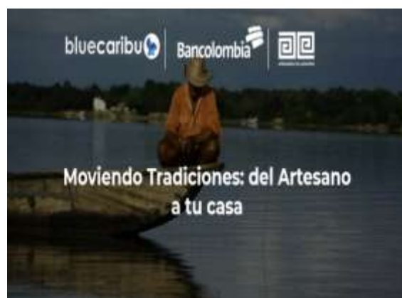
Ilustración 7 Banner de la Feria Moviendo tradiciones: Del Artesano a tu Casa