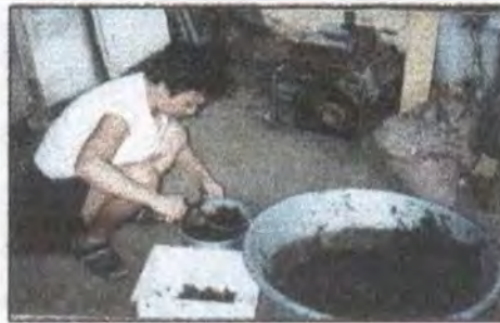
Artesanas tinturando en ollas.

Como se menciona anteriormente existía una caldera de tinturado, diseñada por técnicos del SENA y fabricada hace ya más de 7 años; ésta se encontraba ubicada en las afueras del casco urbano en la sede de Villa Betty. Su funcionamiento consistía en dos marmitas o calderas, reacondicionadas, las cuales eran calentadas por medio de gas (Lp) y contenían la materia prima en madejeros de acero inoxidable. (Varilla de ½”), los cuales eran movidos por un motor poleas y cadenas que hacían difícil la manipulación y funcionamiento, igualmente la ubicación de la caldera y las condiciones de seguridad la convirtieron víctima del abandono y constantes robo de sus piezas (motor y malacate) lo que en poco tiempo la hizo inoperante.