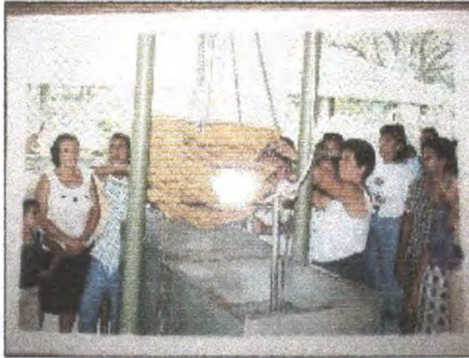
Funcionamiento de la caldera, antes de la adecuación actual.