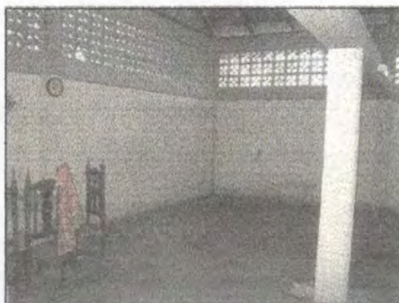
Interiores de la casa, antes de la adecuación.

Se encontró que algunas instalaciones de desagües estaban inhabilitadas por desuso, así como la red hidráulica en tubería de P.V.C, con evidentes fracturas y desgastes, a pesar de todo, la casa y sus instalaciones poseen las características ideales para el desarrollo de procesos en grandes volúmenes, se determinó que la parte trasera de la casa era la que más facilidades presentaba para la instalación de las calderas, por contar con mejores características para el montaje de redes hidráulicas, de desagüe (sanitarias) y gas natural.