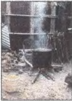
Fogón de leña.

- La infraestructura con que cuentan los artesanos para realizar este proceso de tinturado, no es la más adecuada, pues la mayoría, el 80%, usan como combustible la leña, con fogones y ollas que no son los más apropiados y adecuados para generar un mayor volumen de hilaza tinturada por color.