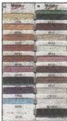
Carta de color ofrecida por el Consortio Abuchaibe.

El abastecimiento de materia prima se obtiene en un 80 % de un solo proveedor (Consortio Abuchaibe) en Barranquilla, las madejas se adquieren en crudo o tinturada, en diferentes colores, éstos presentan deficiencias en calidad, fijación y estandarización, los tonos de colores claros son los que tienen mas marcada la diferencia.