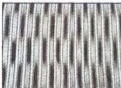
Efectos de lampazo