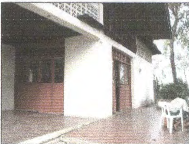
Casa de Artesanías de Colombia, exterior.

Para este punto lo primero que se tomo en cuenta fue el cambio de lugar para la nueva instalación del equipo de tintura, de la sede de "Villa Betty" a la casa sede de Artesanías de Colombia; la casa cuenta con amplias instalaciones y con infraestructura en servicios de agua y luz que favorecen la operatividad, también por estar en el casco urbano es menos susceptible a robos y deterioro.