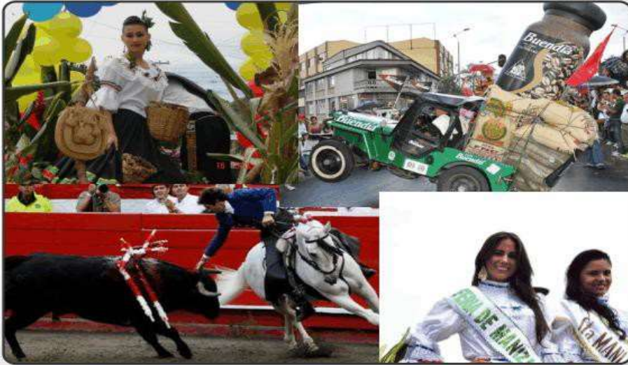
Ferias de Manizales

La Feria de Manizales , es considerada la feria más grande, importante y emblemática de Colombia y el continente americano reconocida como Patrimonio Cultural de la Nación, realizada anualmente en la ciudad colombiana.