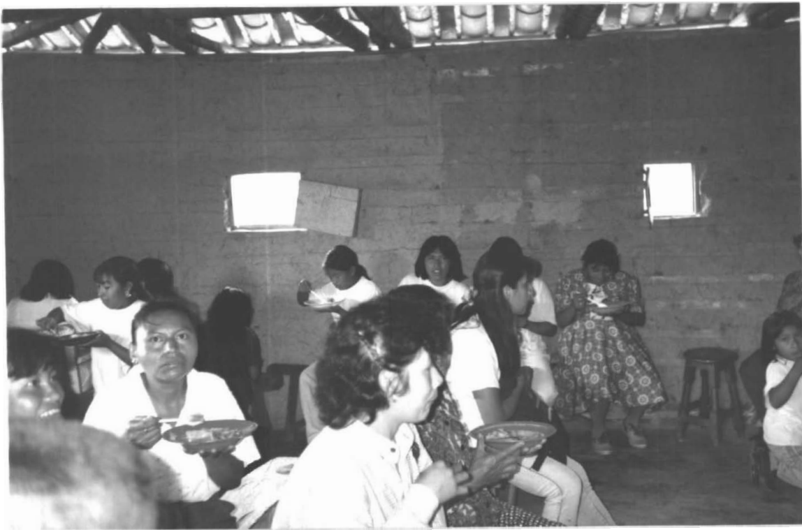
EL ALMUERZO, PUNTO DE ENCUENTRO PARA COMPARTIR CON EL GRUPO, GRACIAS AL ESFUERZO DE LA COMUNIDAD DE SAN MARCOS (RIOSUCIO)