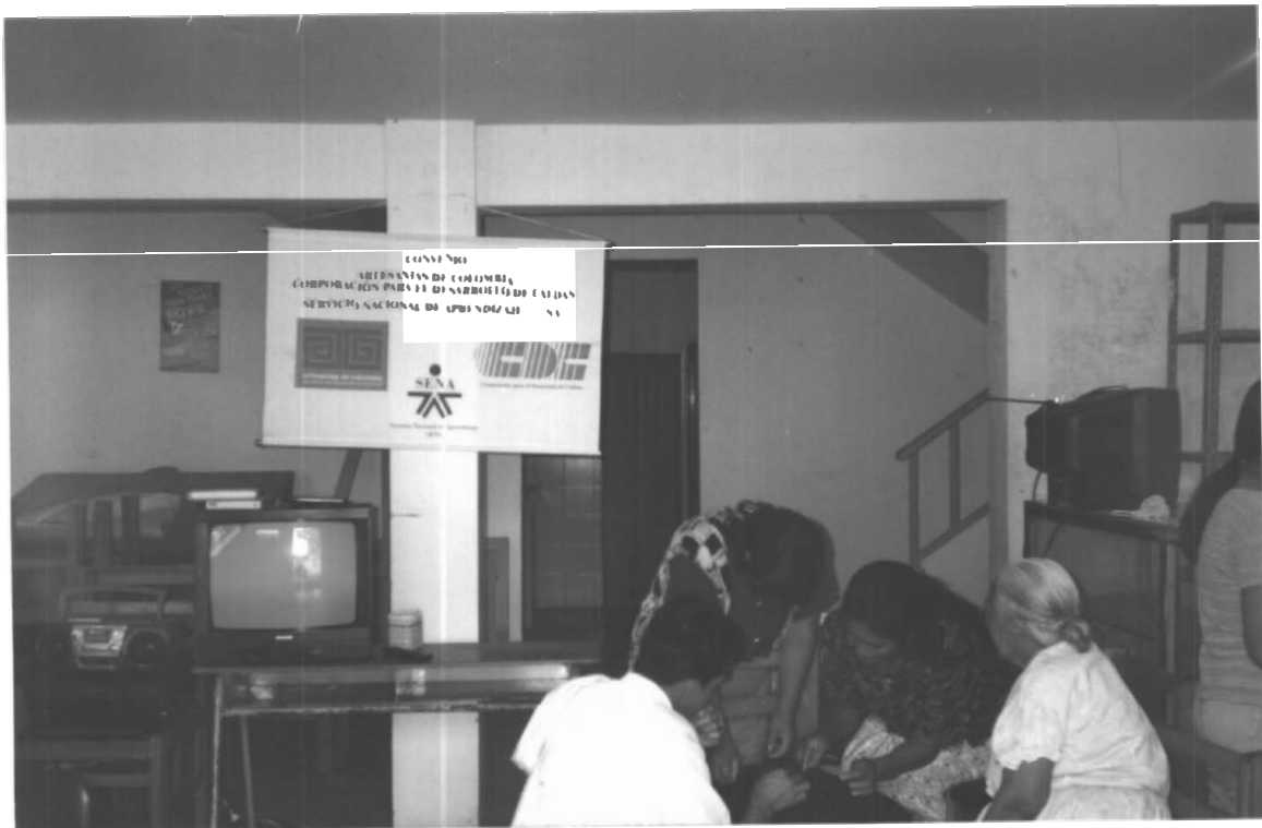
TALLER DE TRABAJO EN GRUPO RESGUARDO LA MONTAÑA (RIOSUCIO)