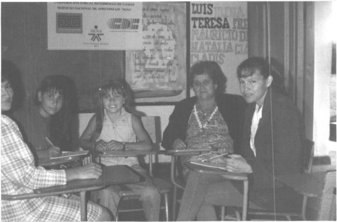
SALON DE CLASES VIBORAL (AGUADAS)