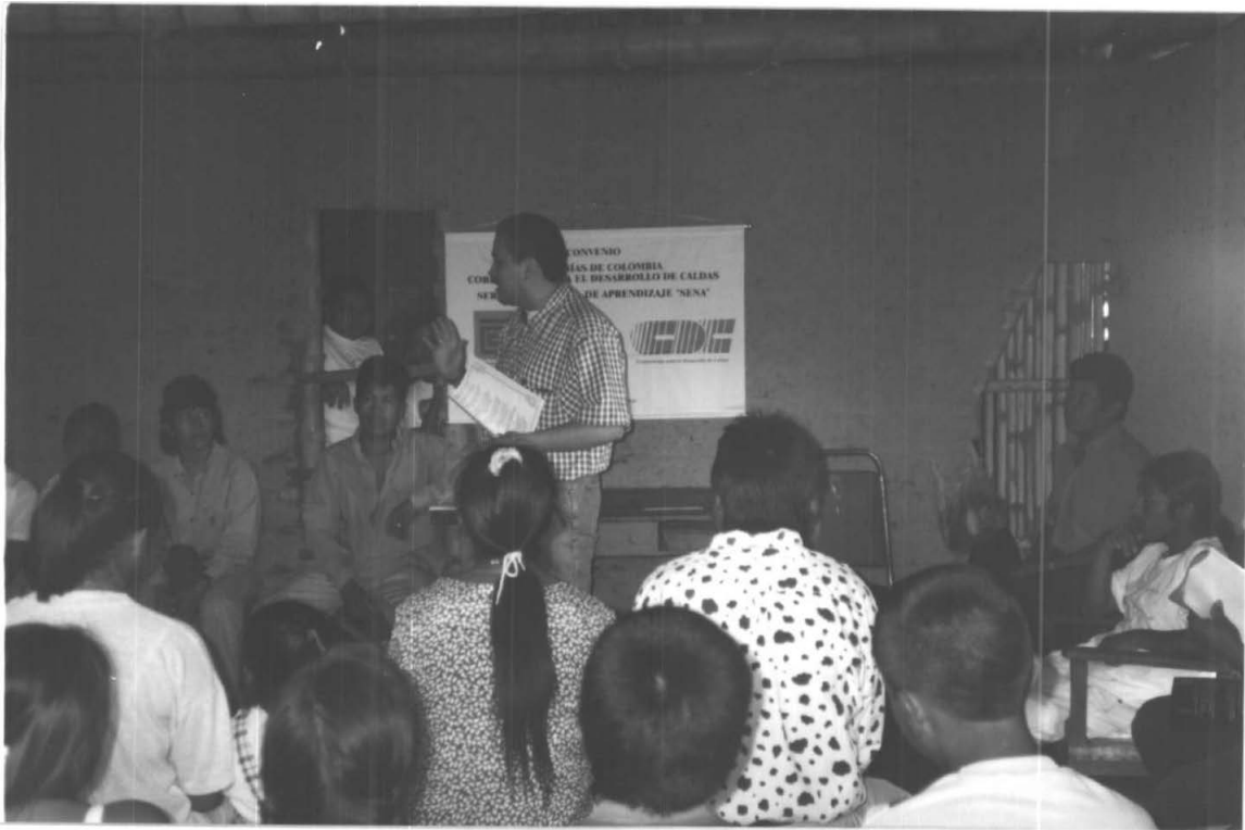
FACILITADOR DE PROYECTO EMPRESA LTDA. ORIENTANDO CAPACITACIÓN (RIOSUCIO)