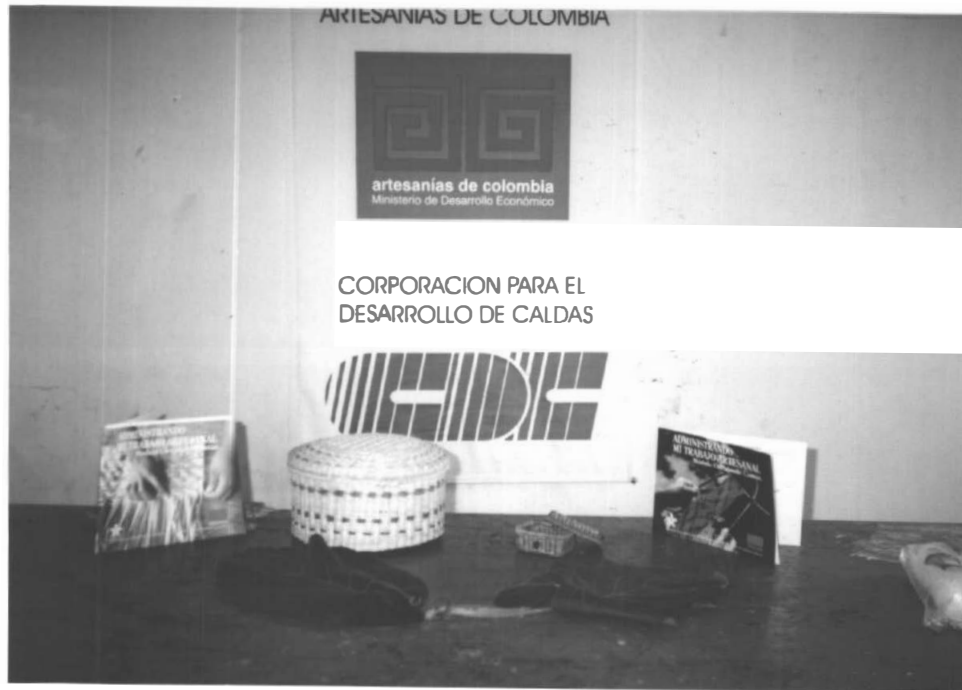
PRODUCTOS ELABORADOS POR ARTESANOS INDIGENAS E INSUMOS PARA LOS TINTES NATURALES