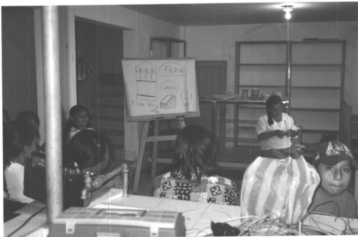
ARTESANA DEL GRUPO ZARZA LA MONTAÑA TEJIENDO EN CAÑA BRAVA