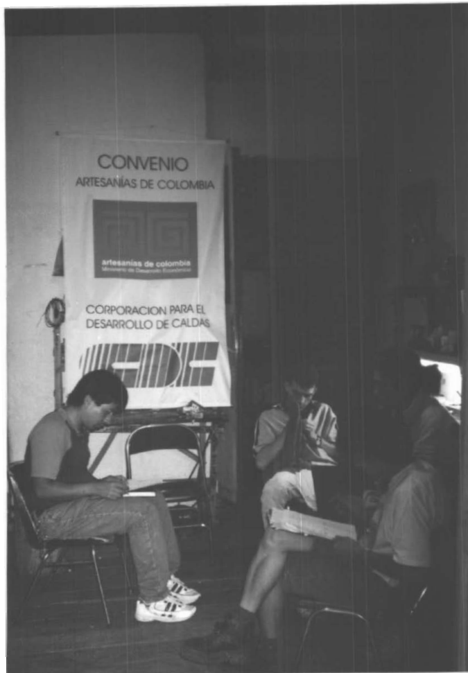
GRUPO DE ARTESANOS DE LA ASOCIACIÓN FUTURO POR CALDAS (MANIZALES) ASISTIENDO A ASESORÍA CONTABLE POR ASESORES DE PROYECTO EMPRESA LTDA