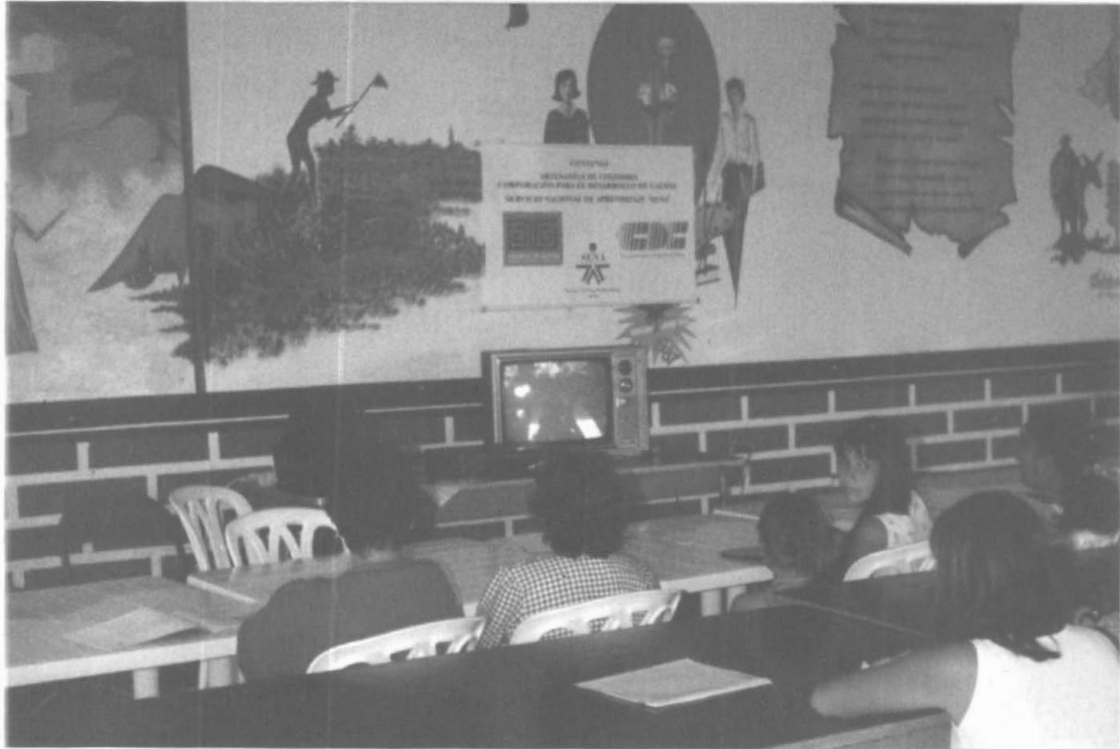
SALA DE VÍDEO CONCENTRACION ESCOLAR VIBORAL