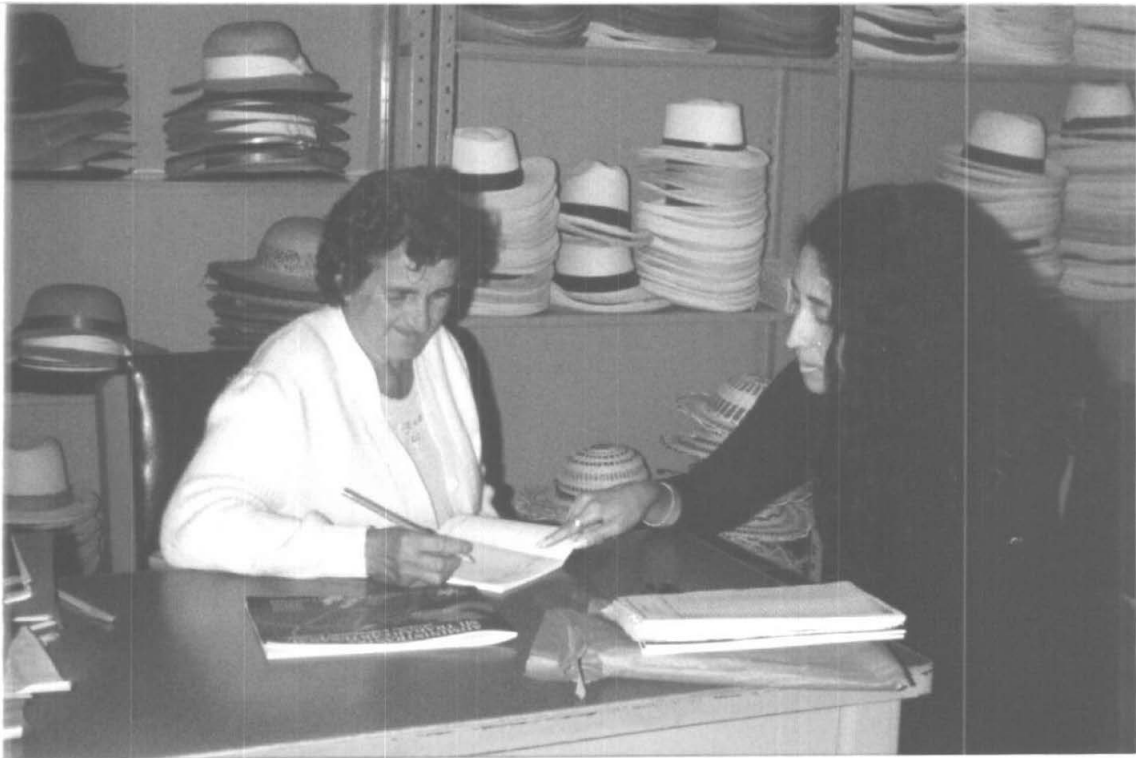
PROCESO DE ASESORIA CONTABLE A ARTESANAS DE AGUADAS