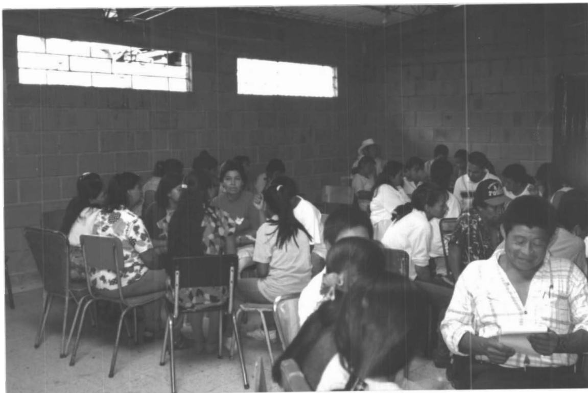
ESTUDIO Y ANALISIS DE ESTATUTOS SEDE SAN LORENZO (RIOSUCIO)