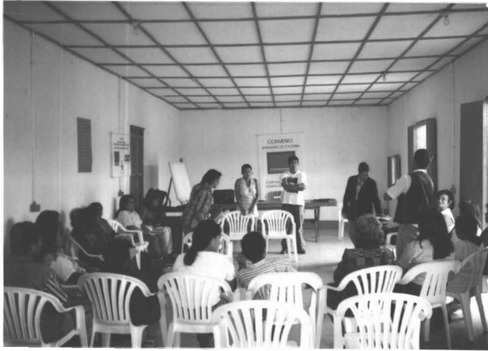
PROCESO DE MOTIVACIÓN Y PRESENTACIÓN DEL PROGRAMA DE FORMACIÓN (RIOSUCIO)