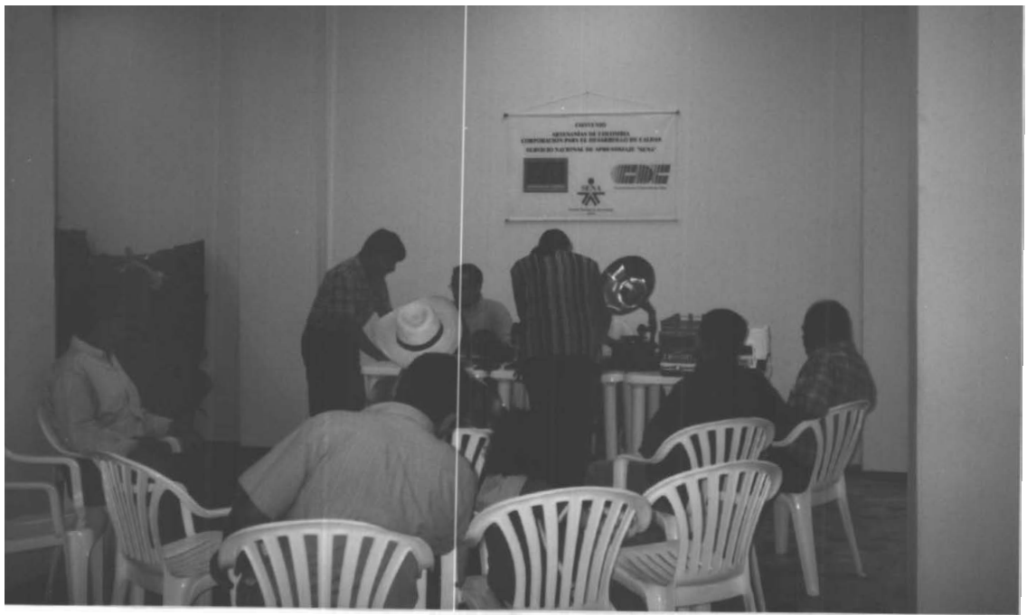
VISITA DE LOS DISEÑADORES DEL LABORATORIO DE DISEÑO DE ARMENIA EN CHINCHINÁ