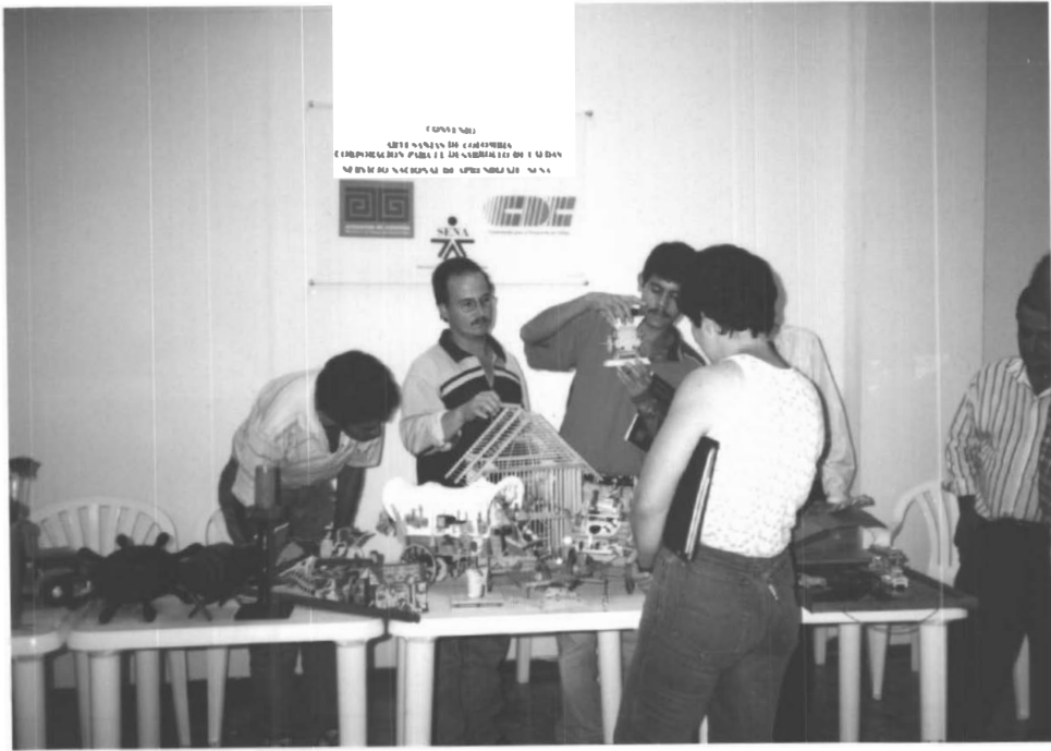
MUESTRA DE PRODUCTOS ARTESANALES PARA EVALUACIÓN DEL LABORATORIO DE DISEÑO DE ARMENIA (CHINCHINÁ)