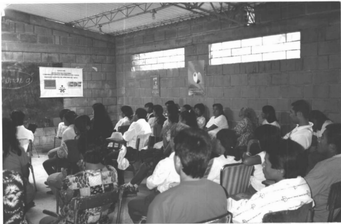
SESIÓN DE CAPACITACIÓN SAN LORENZO (RIOSUCIO)