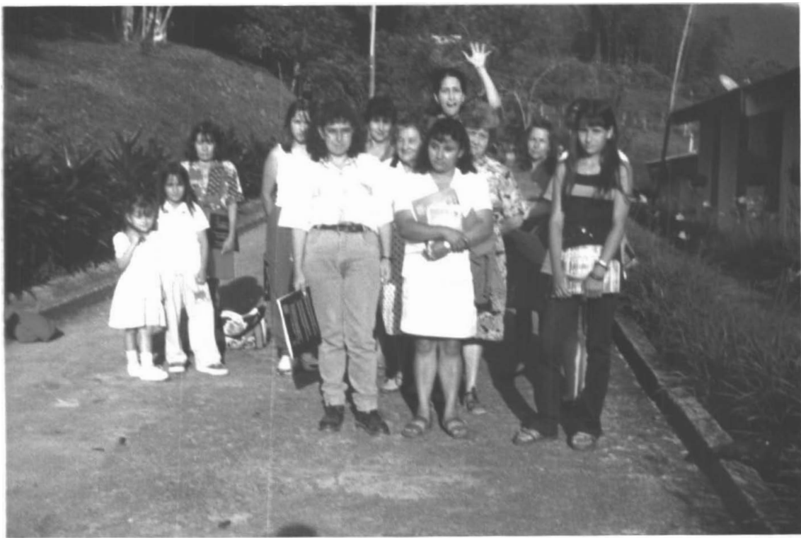
CONCENTRACION ESCOLAR VIBORAL (AGUADAS)