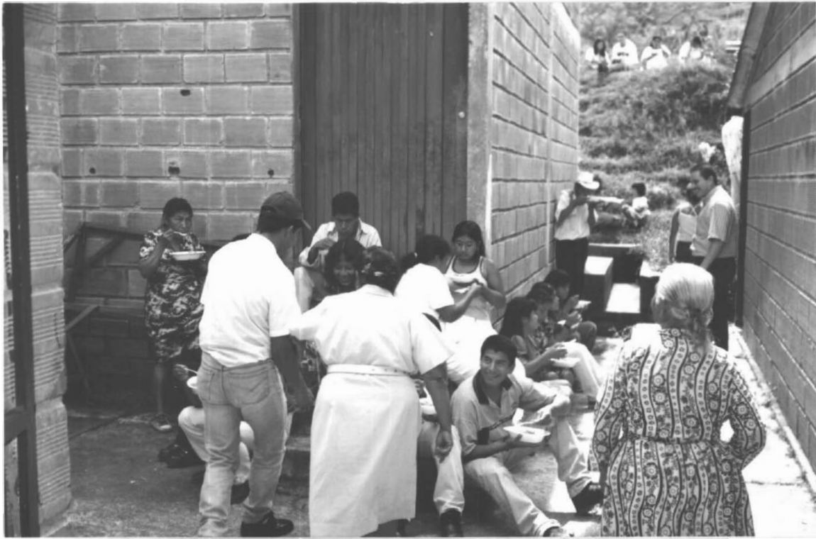
ALMUERZO COMUNITARIO Y DE INTEGRACIÓN GRUPOS ZARZA - SAN LORENZO (RIOSUCIO)