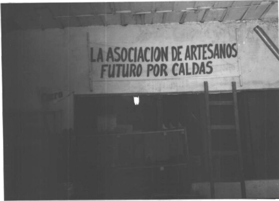
ESTADO INICIAL DEL TALLER DE ARTESANOS DE LA ASOCIACIÓN FUTURO POR CALDAS - MANIZALES