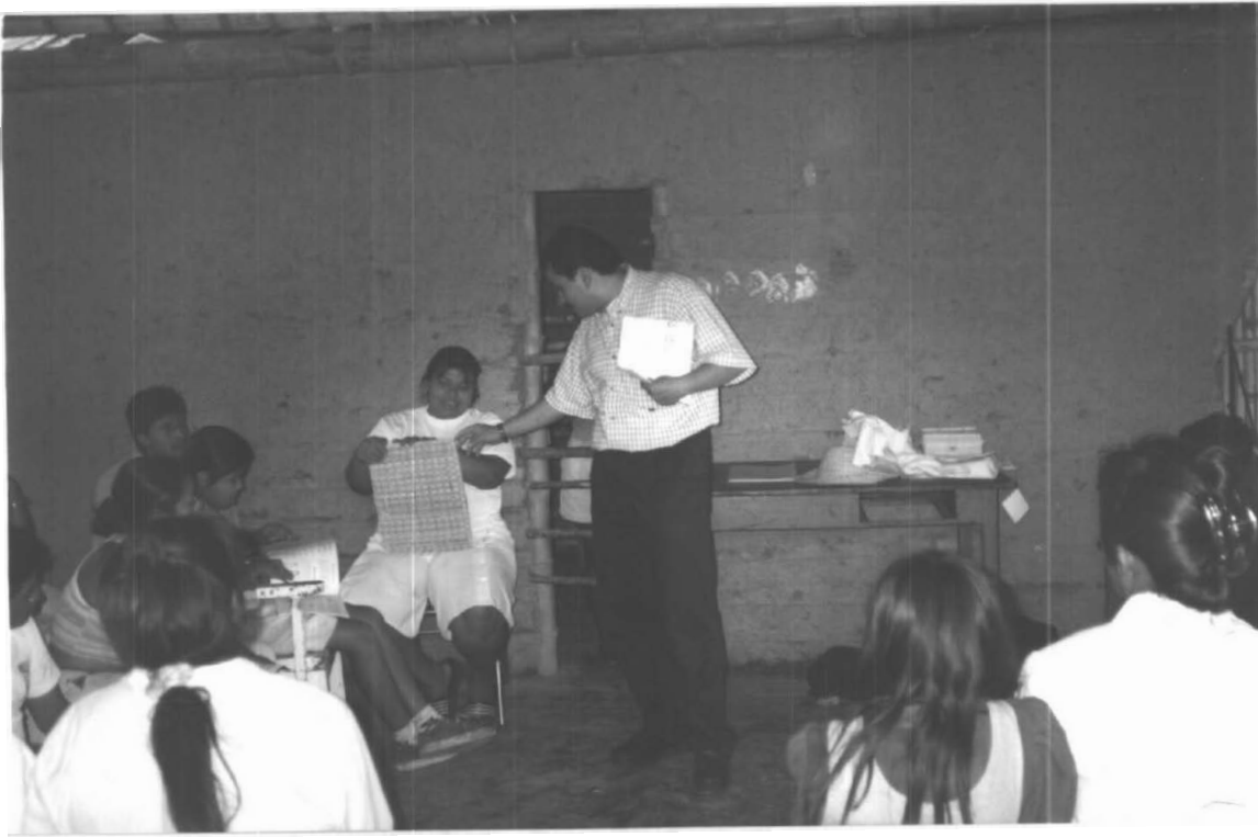
FACILITADOR ORIENTANDO Y ASESORANDO UN GRUPO DE ARTESANOS SAN MARCOS (RIOSUCIO)