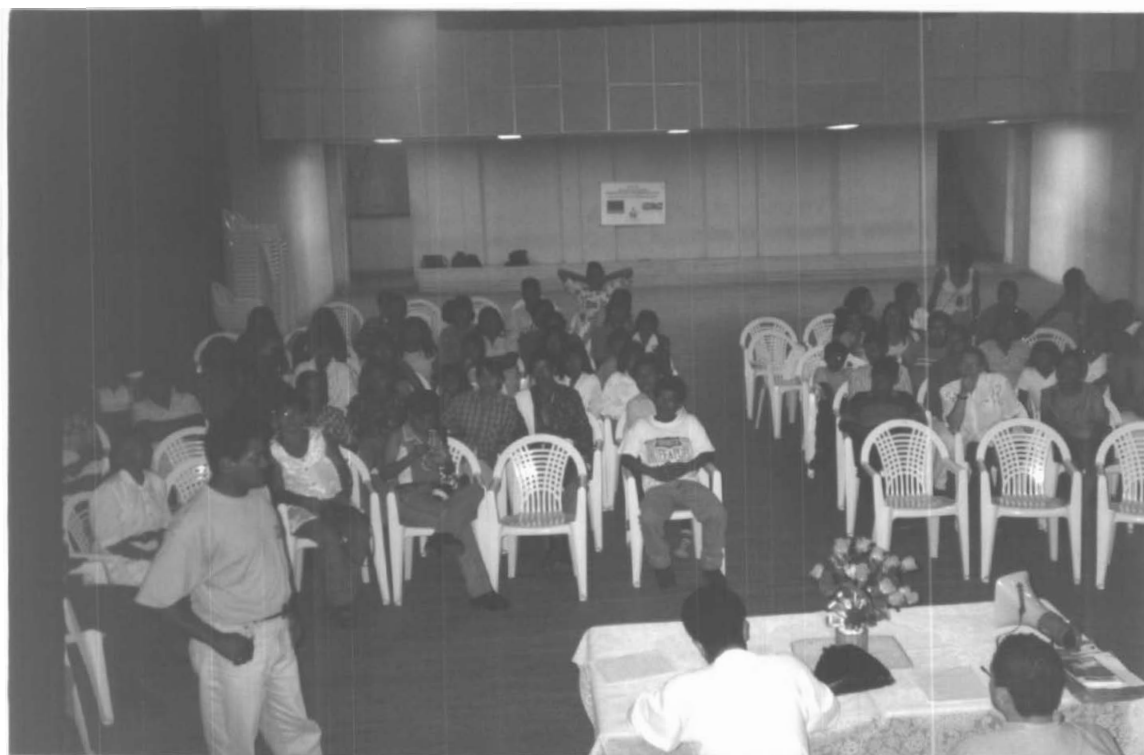
ASAMBLEA GENERAL DE CONSTITUCIÓN ASOCIACIÓN "SINIFANA" (RIOSUCIO)