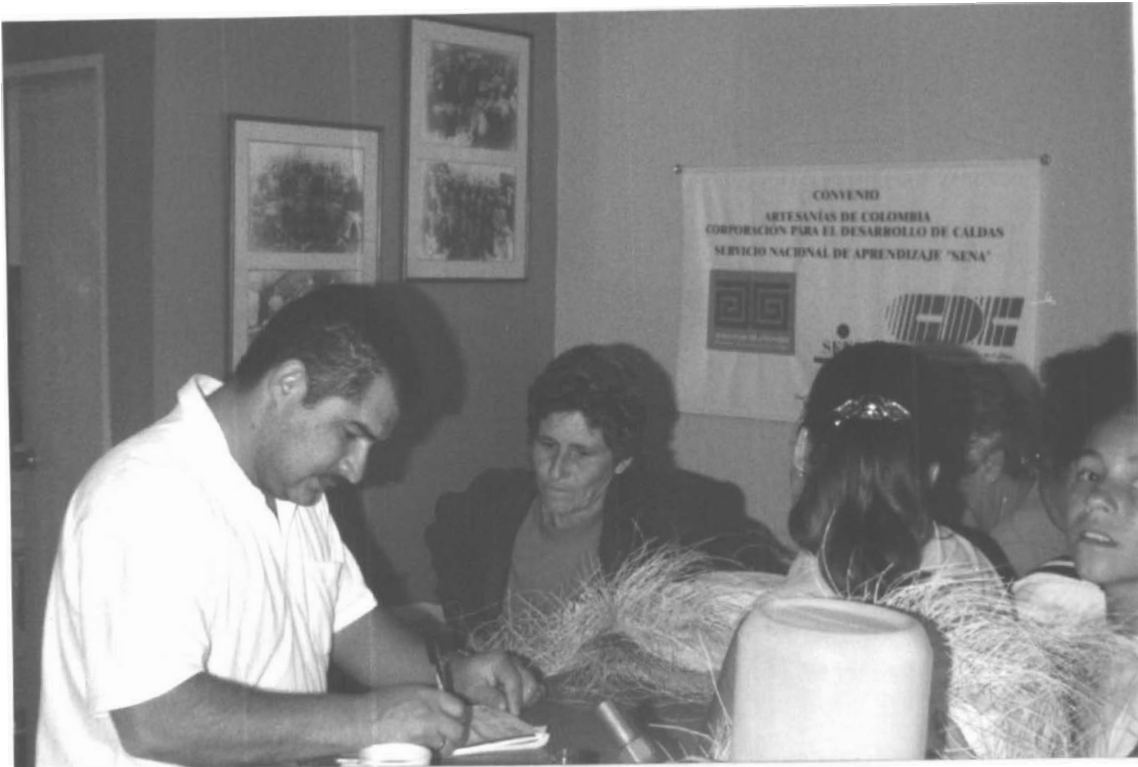
SEDE COOPERATIVA DE ARTESANAS DE AGUADAS COMERCIALIZACIÓN DE LOS SOMBREROS EL DIA SABADO