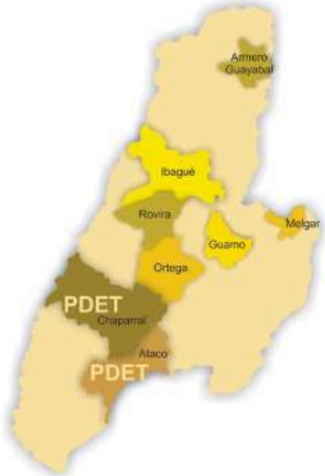
Ilustración 1 Municipios del Tolima priorizados 2021

El departamento del Tolima posee una gran diversidad de suelos y climas, es muy importante su riqueza natural, existen cultivos bastantes tecnificados, algunas industrias y su desarrollo turístico es cada vez, más desarrollado.