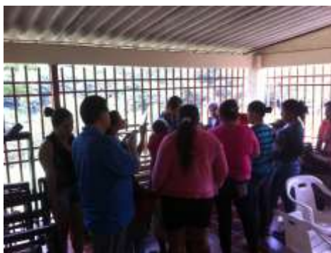
Taller Tendencias Pururuku Riosucio, Caldas Octubre de 2017 Jorge Fuentes Artesanías de Colombia S.A.