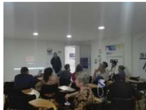
Taller Tendencias Barrio Amigo Manizales, Caldas Noviembre de 2017 Jorge Fuentes Artesanías de Colombia S.A.