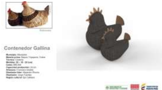
Ilustración 1: Ficha Boceto Manizales

Ficha de Boceto Francisco Giraldo Manizales, Caldas Octubre de 2017 Jorge Fuentes Artesanías de Colombia S.A.