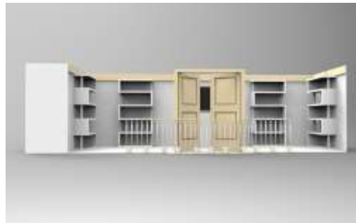
Ilustración 5: Stand Vista Frontal