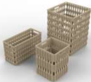
Ilustración 4: Render Riosucio

Render Producto Rescate CISLOA Riosucio, Caldas Octubre de 2017 Jorge Fuentes Lerech Artesanías de Colombia S.A.