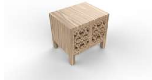
Ilustración 3: Render Salamina

Render Producto Nuevo Edilsón Castrillón Salamina, Caldas Octubre de 2017 Jorge Fuentes Lerech Artesanías de Colombia S.A.