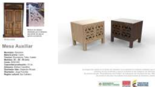
Ilustración 2: Ficha Boceto Salamina

Ficha de Boceto Edilsón Castrillón Salamina, Caldas Octubre de 2017 Jorge Fuentes Artesanías de Colombia S.A.