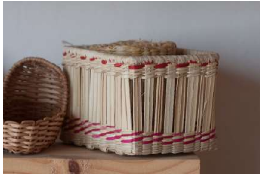
Registro Productos Existentes Riosucio, Caldas Septiembre de 2017 Jorge Fuentes Artesanias de Colombia S.A.

El grupo de trabajo no se pudo contactar en la visita que se realizó al municipio, pero se vieron sus productos en Sinifana; una entidad agrupadora y comercializadora del municipio. Tienen buenos acabados técnicos y buen manejo del color. Se esperan contactar en próximos días, pero se esta pendiente de la recepción que tengan a hacer productos de expoartesanias