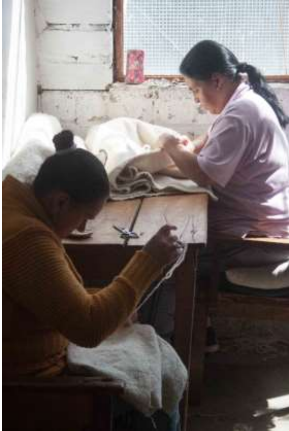
Apoyo en diagnostico inicial Marulanda, Caldas Septiembre de 2017 Jorge Fuentes Artesanias de Colombia S.A.