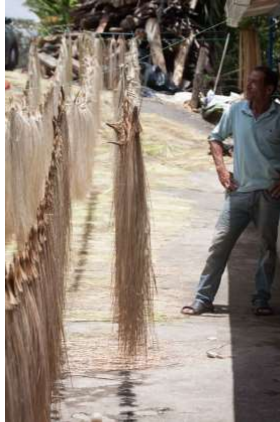
Apoyo en diagnostico inicial Aguadas, Caldas Septiembre de 2017 Jorge Fuentes Artesanias de Colombia S.A.

Comunidad artesanal dedicada a la tejeduría de la Iraca, dentro del grupo se encuentran artesanas de diferentes niveles de destreza técnica y eso se deja ver en los productos mostrados en el reconocimiento. También se tuvo ocasión de visitar la caseta de aprovechamiento de la iraca y la cooperativa artesanal de Aguadas.