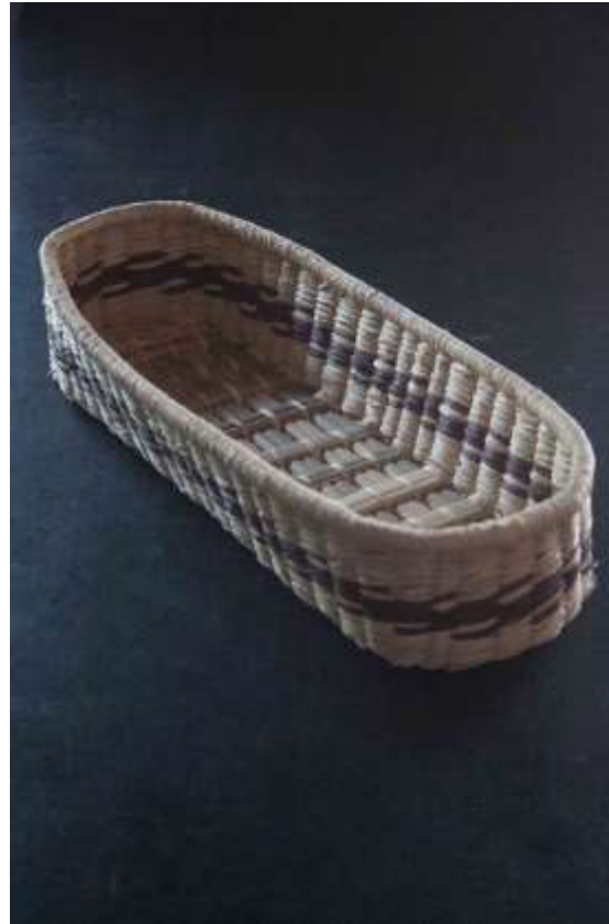
Registro Productos Existentes Riosucio, Caldas Septiembre de 2017 Jorge Fuentes Artesanias de Colombia S.A.

Comunidad artesanal con buena receptividad para realizar producto expoartesanias 2017, sin embargo se debe hacer un seguimiento mas exhaustivo a la calidad final del producto. Se podría resaltar la fabricación de canastos tradicionales de la comunidad.