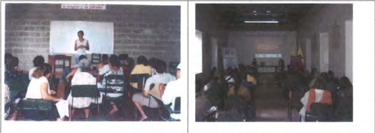
Presentación Proyectos Centro de Diseño Artesanías de Colombia