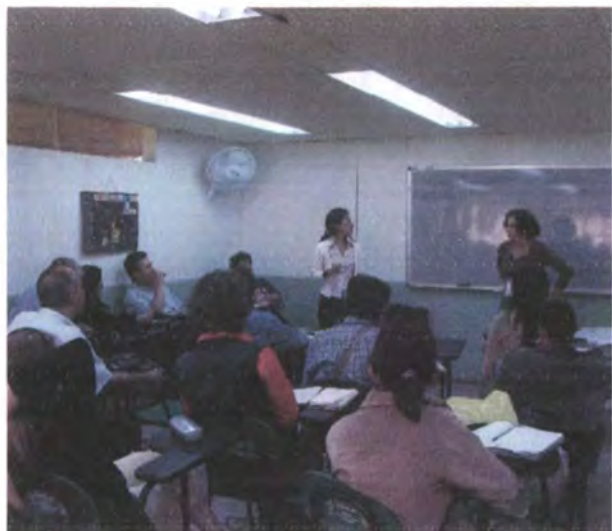
Seminario Taller de diseño aplicado a la artesanía Armenia, Abril 2007