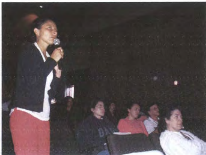
Seminario Taller de diseño aplicado a la artesanía Armenia, Abril 2007