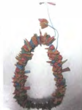
Collar en totumo picado Desarrollo de producto a partir de asesoría puntual. Abril de 2007