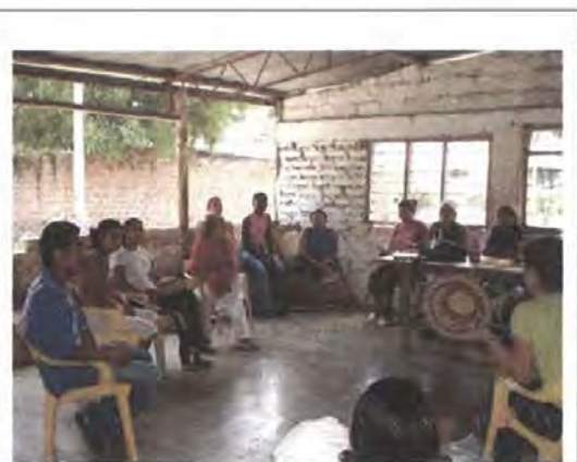
Asesoría para el mejoramiento de productos, vereda Los Cocos. Fotografía: Adriana Oliveros, Febrero 2006