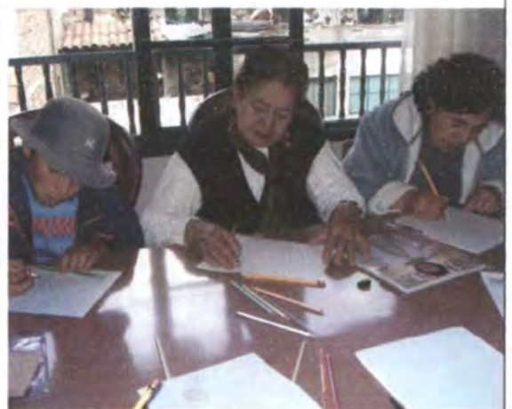
Asesoría en Diseño para el desarrollo de líneas de productos a partir del rediseño Monguí y Mongua