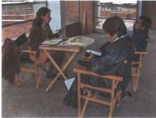
Programa de Asesorías puntuales Plaza de los Artesanos