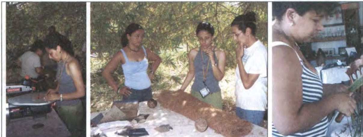
Implementación de herramientas para trabajos en concha de coco Fotografía: Jaime Londoño Febrero de 2007