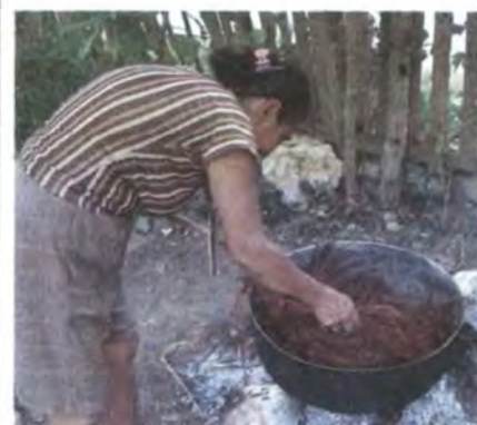
Proceso de Tintura con colorantes industriales Sincelejo, Sucre Abril 2007