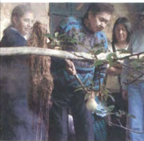
Asesoría en Diseño para el desarrollo de líneas de productos a partir del rediseño Monguí, Boyacá Abril 2006