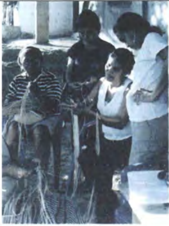
Asesoría en Diseño para el desarrollo de líneas de productos a partir de la creación Sincelejo Abril 2006