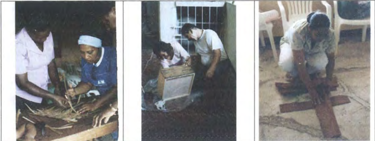
Asesoría en Diseño para el desarrollo de líneas de productos a partir de la creación Archipiélago de San Andrés

Mayo 2006