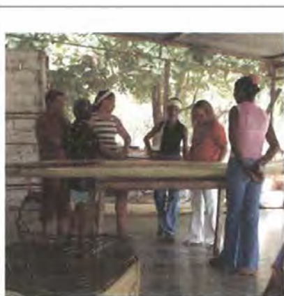
Seguimiento del proceso productivo, vereda Los Cocos. Fotografía: Adriana Oliveros, Febrero 2006