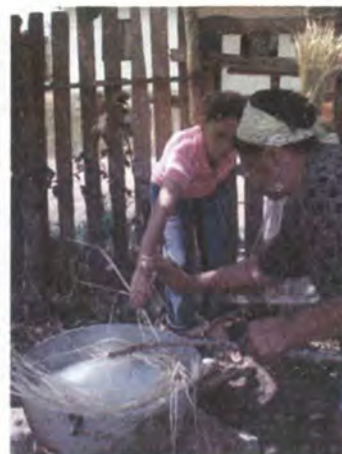
Proceso de preparación y lavado de la fibra de iraca Sincelejo, Sucre Abril de 2007