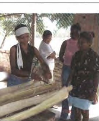
Seguimiento del proceso productivo, vereda Los Cocos. Fotografía: Adriana Oliveros, Febrero 2006