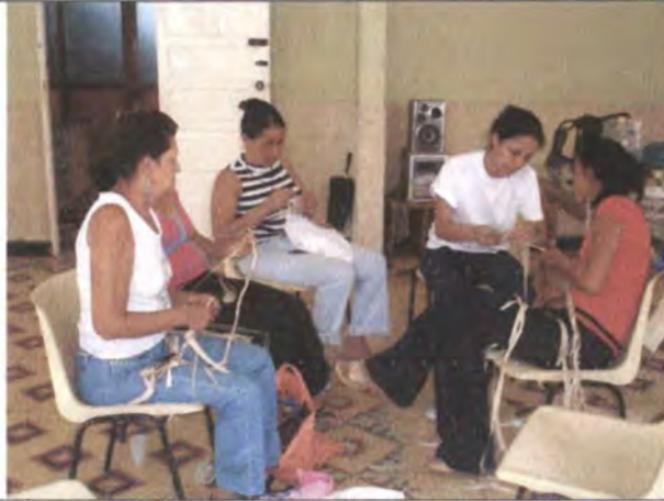
Asesoría en Diseño para el desarrollo de líneas de productos a partir de la creación Sincelejo Abril 2006