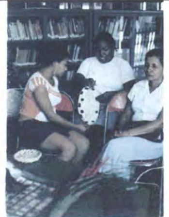
Asesoría en Diseño para el desarrollo de líneas de productos a partir del rediseño Colosó Abril 2006