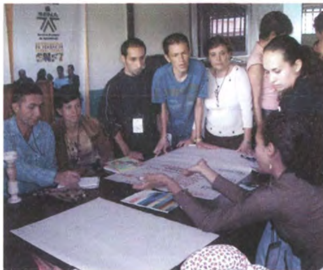
Seminario Taller de diseño aplicado a la artesanía Armenia, Abril 2007