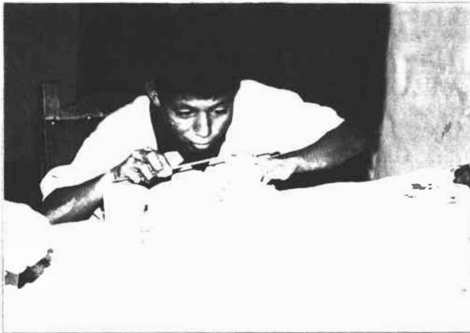
Niño de la Institución "Amigos 90", uno de los programas más bonitos y bien logrados encontrado en la regional de Bucaramanga.