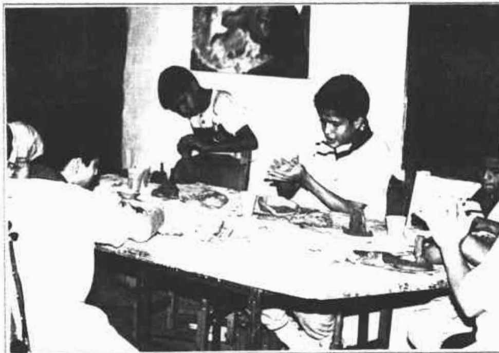
Los niños de la Institución "Amigos 90", quienes hoy se encuentran en ella como en un verdadero hogar, a pesar de haber pasado de institución en institución, se muestran muy alegres y entusiastas con el trabajo.