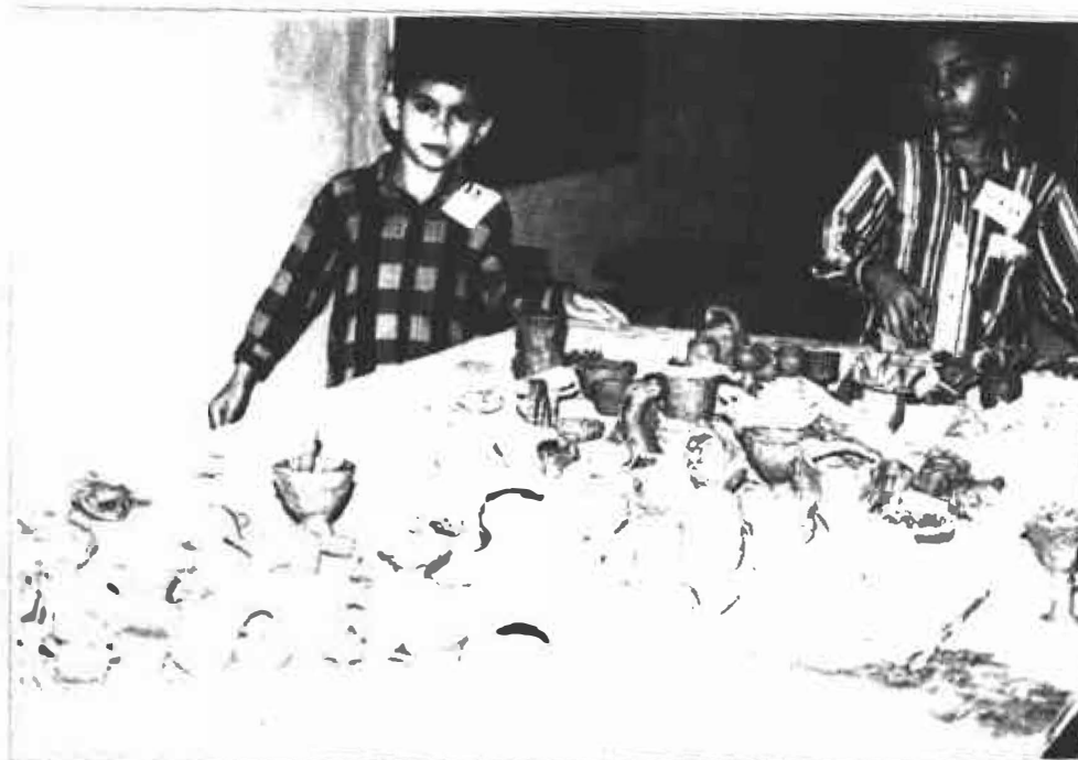
Infinidad de piezas fueron hechas por los niños de esta regional, demostrando la abundante creatividad de la población colombiana