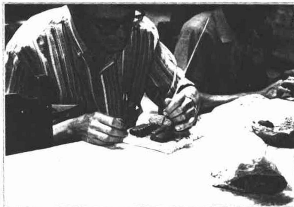
Profesor de la institución de Protección "Ciudadela del Niño" trabajando dedicadamente para luego realizar la replica de los talleres creativos de valores