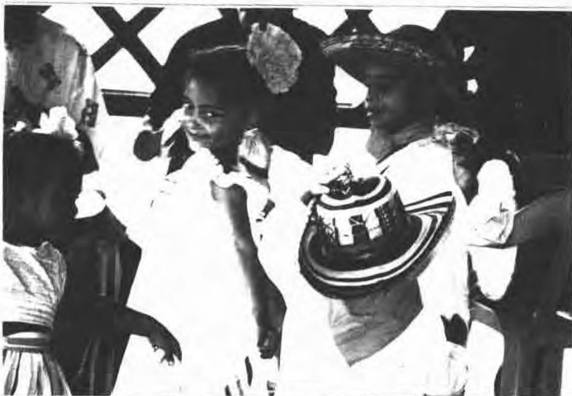
El taller en la regional de San Jacinto fue también un espacio para la expresión de valores culturales como la música y la danza