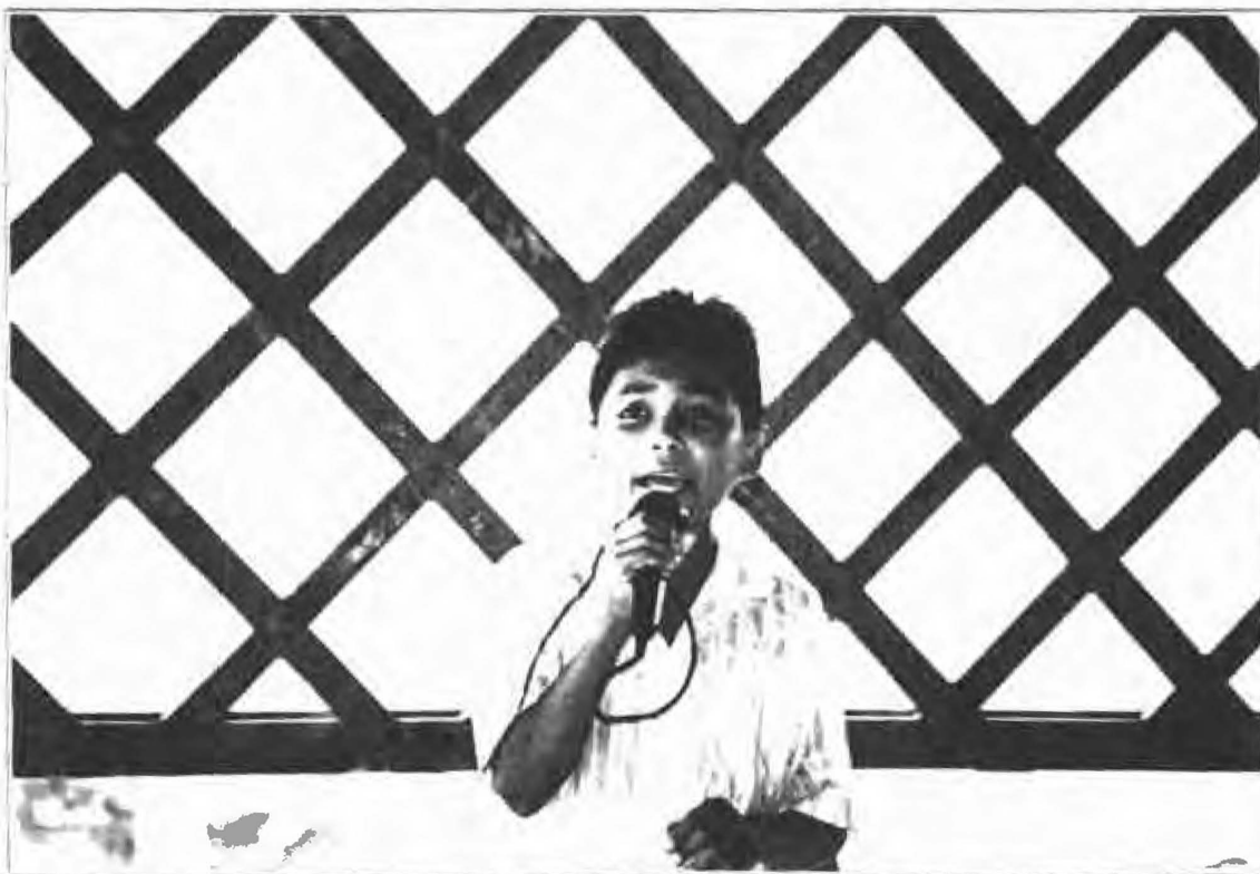
Los niños fueron los protagonistas de la clausura más animada de todas las regionales