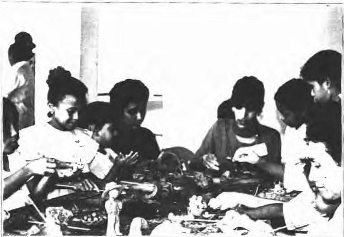
Niños y adultos modelando con el barro, regresando al contacto con la tierra, descubriendo las raíces humanas.