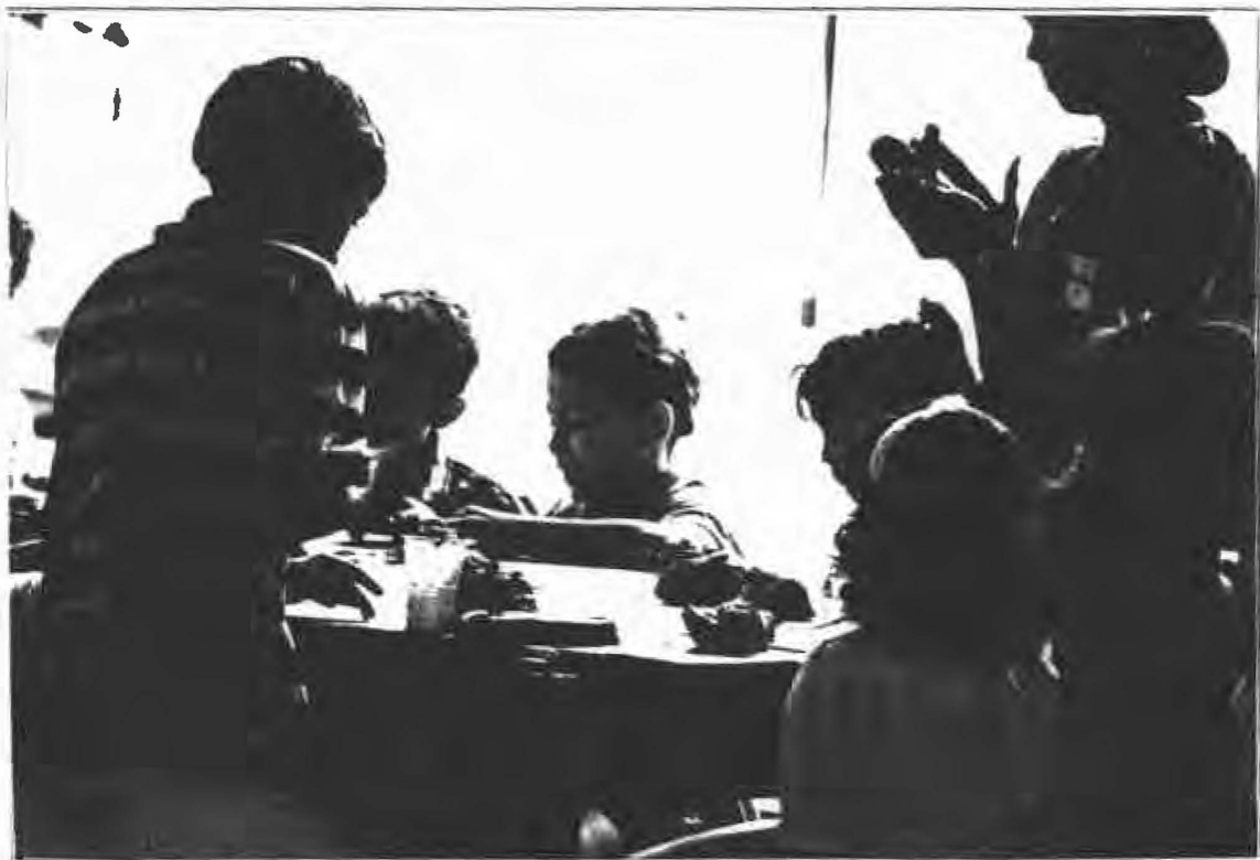
El entusiasmo de los niños de Sanjacinto fue una constante de estos talleres