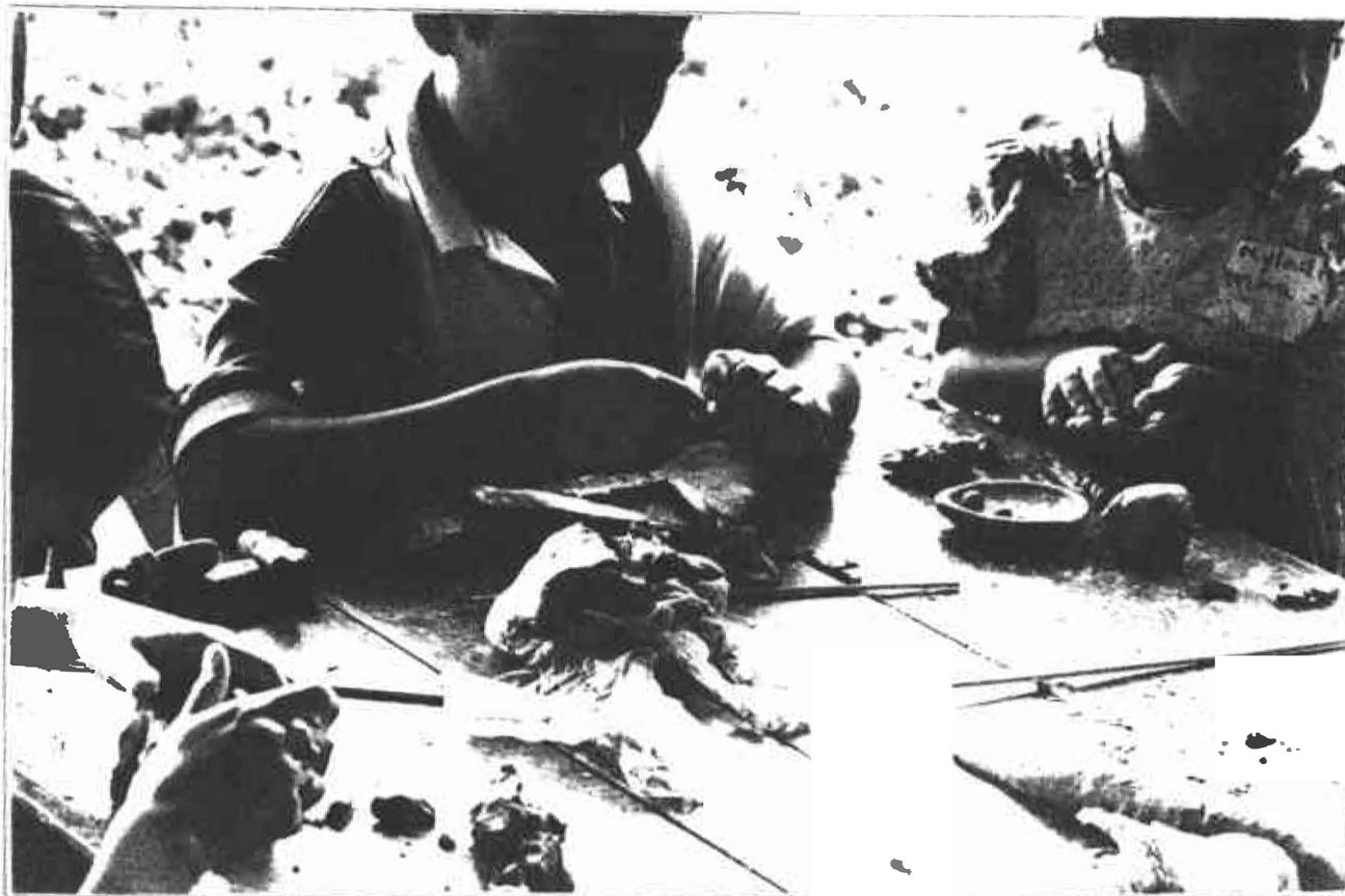
El barro ejerce una fascinación casi mágica en los niños y los adultos que se integraron armónicamente alrededor de este trabajo para crear figuras que traen de su imaginación.