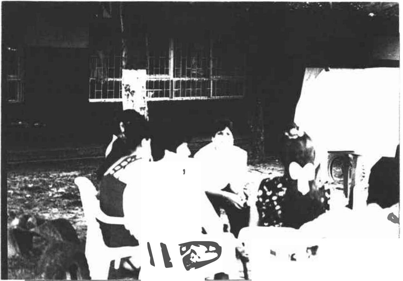
Varios adultos asistentes participaron en las charlas teóricas