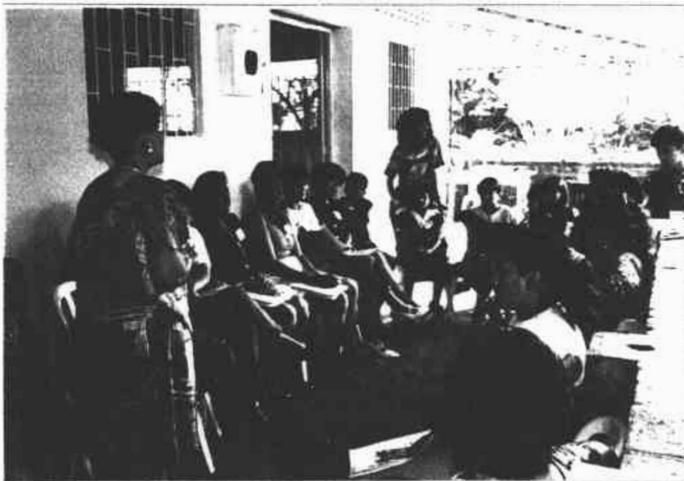
Los adultos y los niños de Yopal se reunieron en torno a la charla teórica