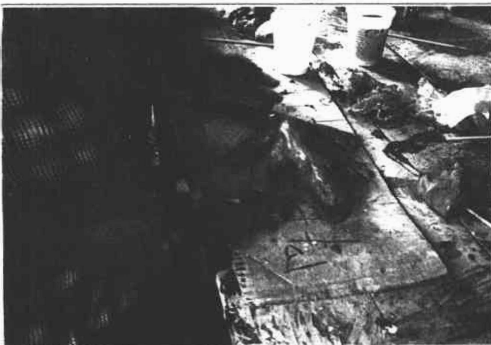
La naturaleza es una de las principales fuentes de inspiración en la creación de figuras de arcilla