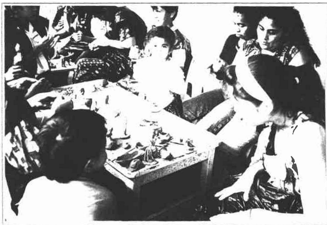
En la regional de Yopal, el trabajo se desarrolló con la alegría de sus habitantes.