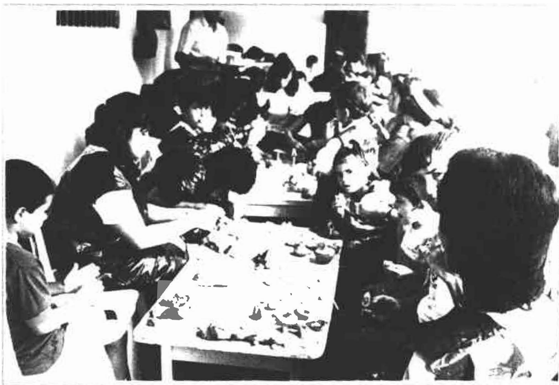
Niños y adultos reunidos trabajando alrededor del barro.