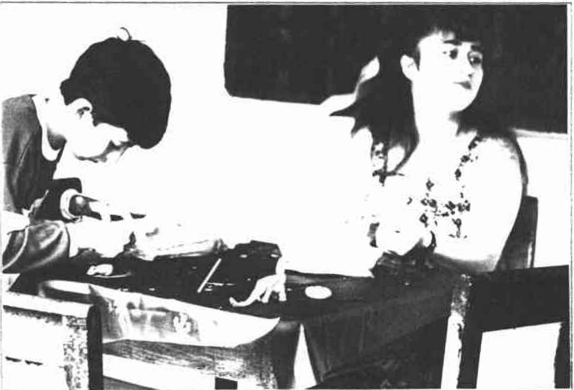
Cartago, una de las regionales en donde la gente mostró más camaradería y con-