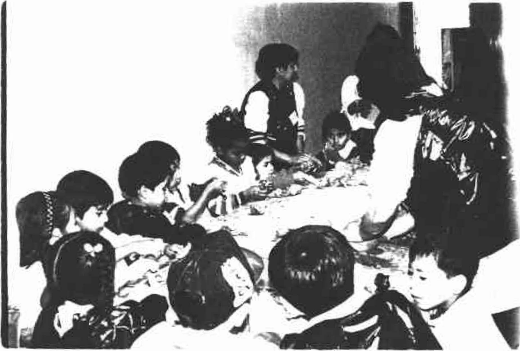
Al taller de Pasto asistieron niños de los jardines infantiles, quienes reflejaron la tradición del trabajo manual de esta región.