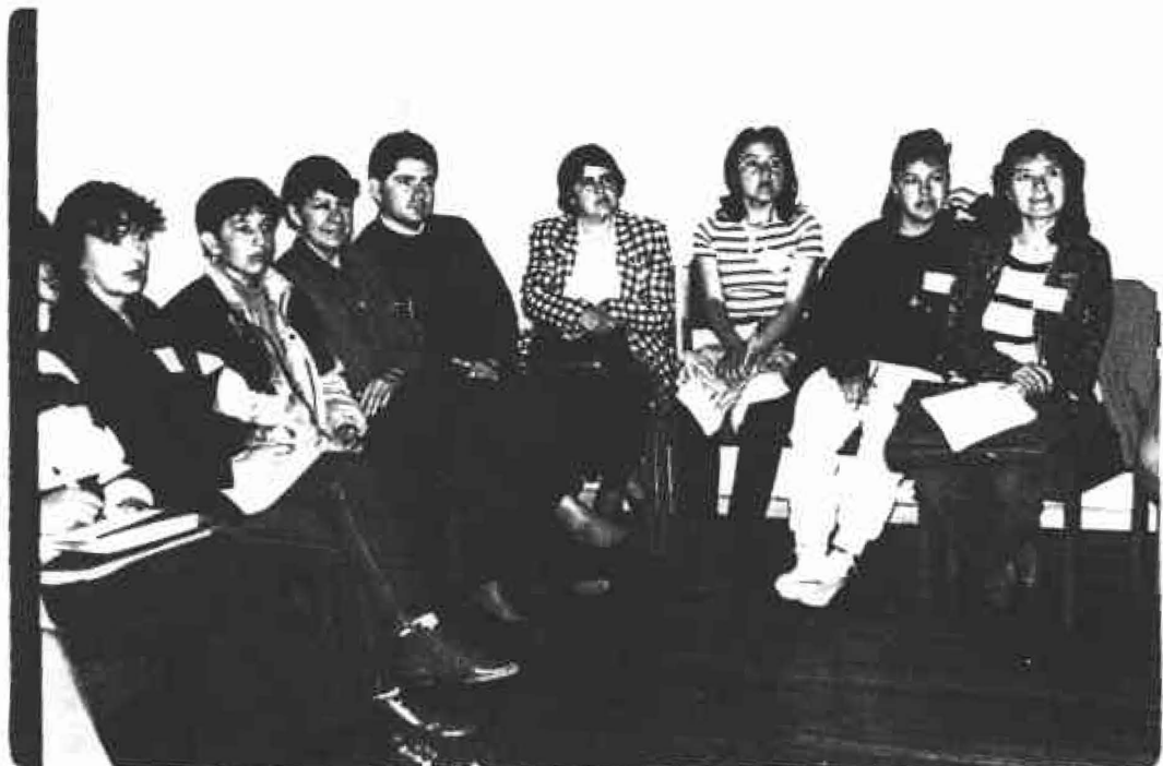
Hubo gran participación y atención en la charla teórica.