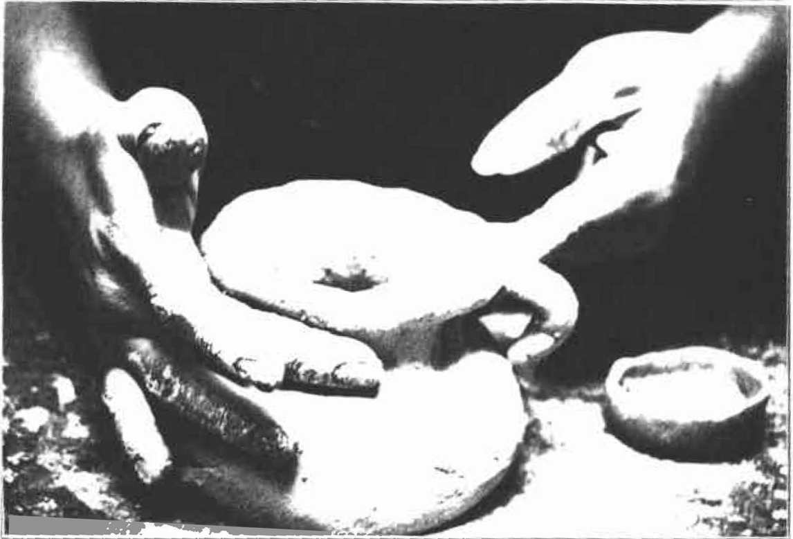
En el departamento de Nariño, los asistentes demostraron su alta creatividad y facilidad para el trabajo manual.