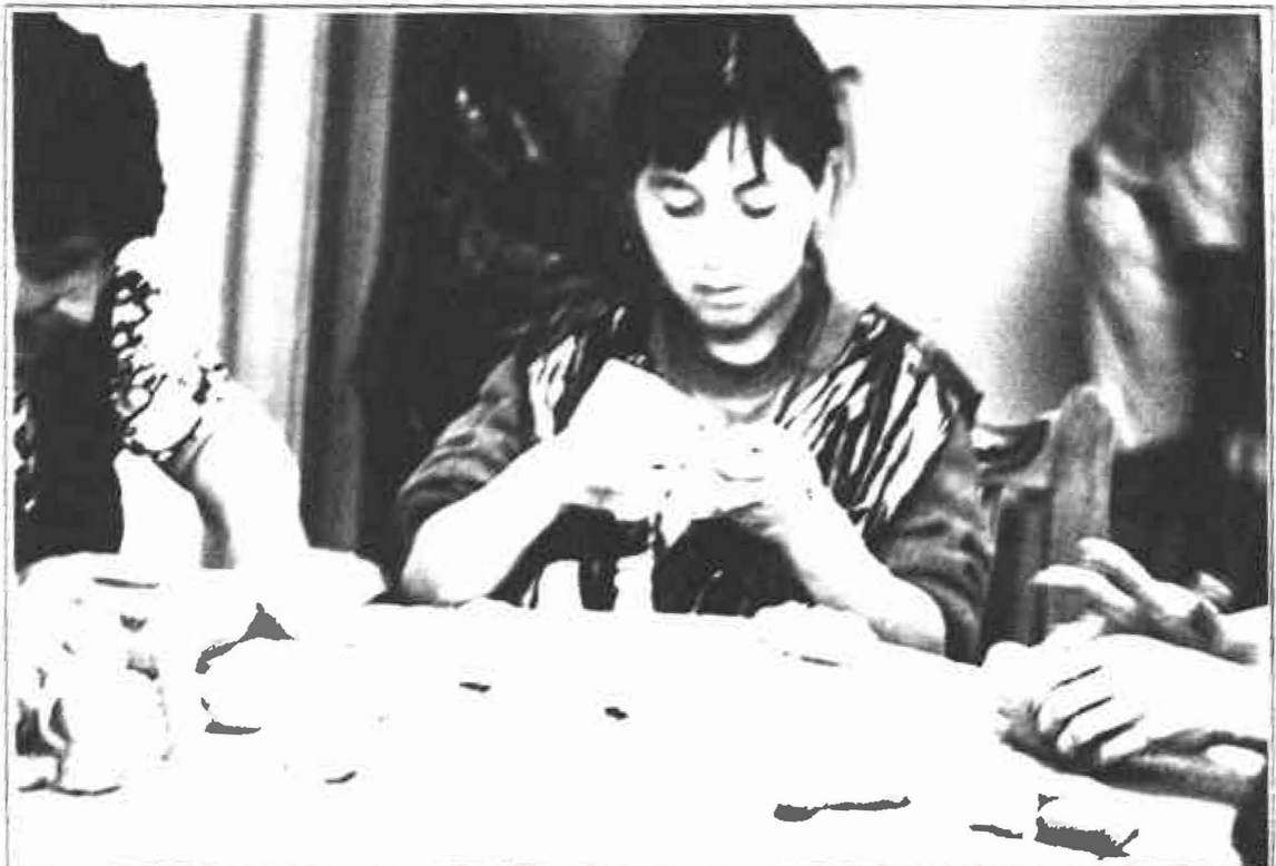
Los niños de Nariño, siempre creativos, siempre participativos