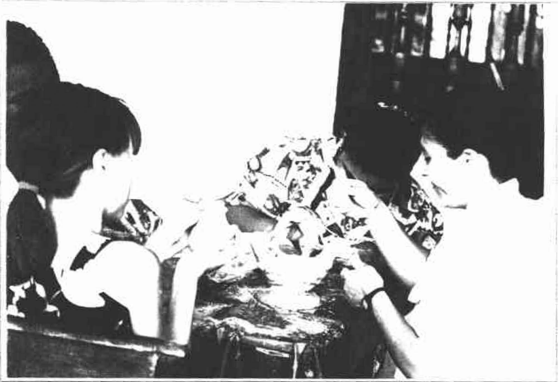
Los niños y los adultos de Cartago expresaron toda su creatividad en el modelado de las figuras de barro