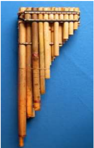
Zampoña (Basto) Cromática Cañas varias