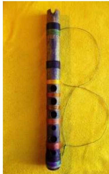
Quenilla en Si Bemol Caña Nariñense