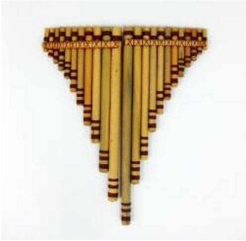
Zampoña Diatónica en Sol Mayor Cañas

La caña es mejor para armar Gusta el bambú comercialmente Maracas: línea Infantil: línea