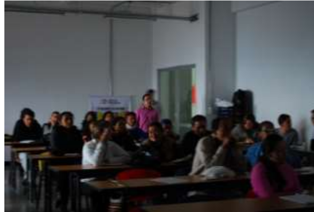
Diplomado “reconocimiento de la cadena de valor artesanal” Lugar: Universidad de Caldas, Manizales Junio de 2010