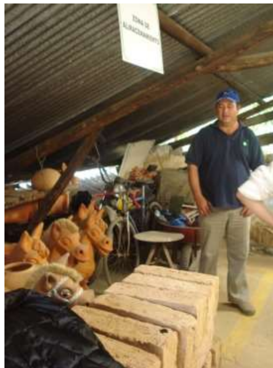
Visita de Reconocimiento a los talleres opcionados para la conformación de la Red, Municipio de Ráquira, Boyacá Lugar: Municipio de Ráquira, Boyacá Junio de 2010

Asistencia al Curso Taller sobre “Transferencia Metodológica para la conformación de Redes Empresariales” Actividad realizada con el apoyo de ONUDI (Organización de las Naciones Unidas para el desarrollo Industrial, En seis sesiones comprendidas por tres días al mes con una intensidad horaria de 16 horas por cada sesión de trabajo. El componente contemplaba el levantamiento del estado del arte, y la socialización de los contenidos para ser apropiados por los futuros beneficiarios de la red en el municipio de Ráquira con el oficio de Alfarería, en el departamento de Boyacá