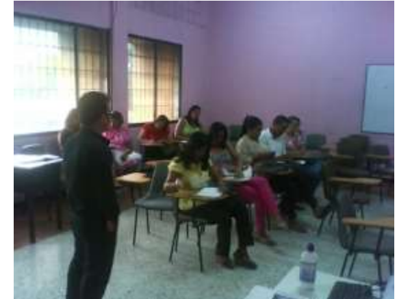
Diplomado “reconocimiento de la cadena de valor artesanal” Lugar: Universidad de la Guajira, rioacha Junio de 2010

Preparación y ejecución del Diplomado sobre “reconocimiento de la Cadena de Valor Artesanal”