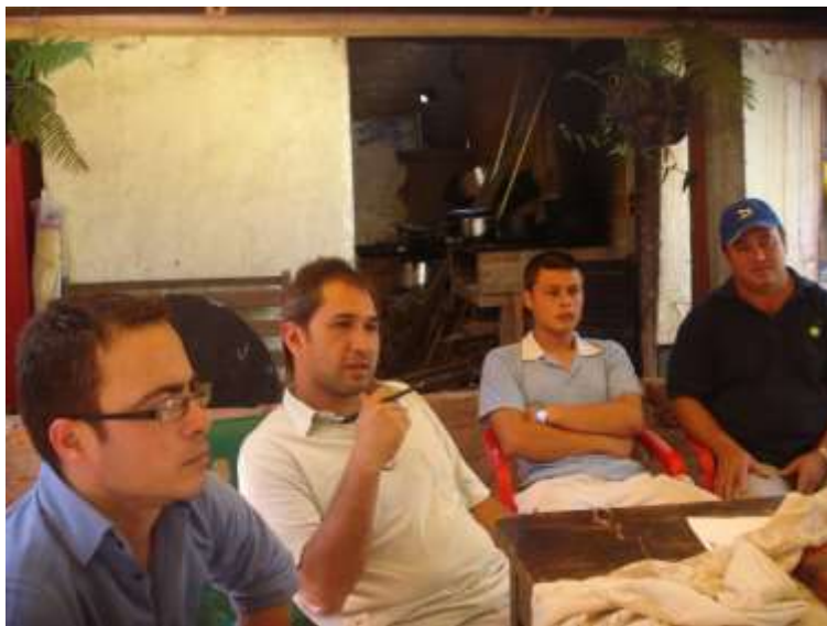
Sesión de trabajo para la conformación de redes empresariales en el Municipio de Ráquira, Boyacá Lugar: Municipio de Ráquira, Boyacá Junio de 2010