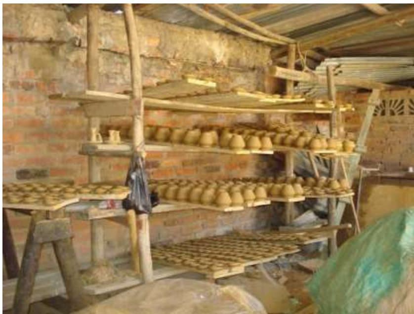
Visita de Reconocimiento a los talleres opcionados para la conformación de la Red, Municipio de Ráquira, Boyacá Lugar: Municipio de Ráquira, Boyacá Junio de 2010