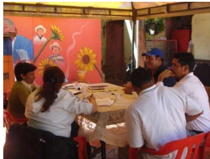
Sesión de trabajo con los artesanos sobre el FODA, para determinar oportunidades de mejora enfocadas hacia el proyecto, Municipio de Ráquira, Boyacá Lugar: Municipio de Ráquira, Boyacá Junio de 2010