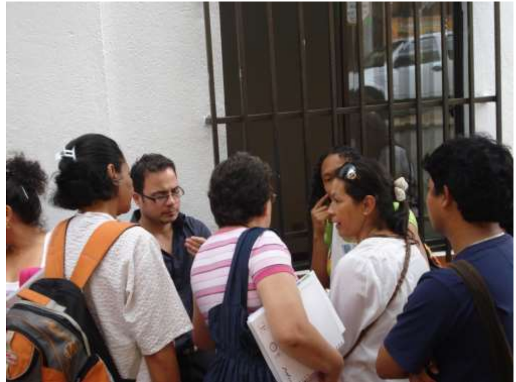
Solución de dudas a los beneficiarios, proyecto medellín Octubre de 2010

Convenio Artesanías de Colombia S.A. y ESUMER, se impartieron 128 horas de capacitación a 43 beneficiarios del proyecto en la ciudad de Medellín.