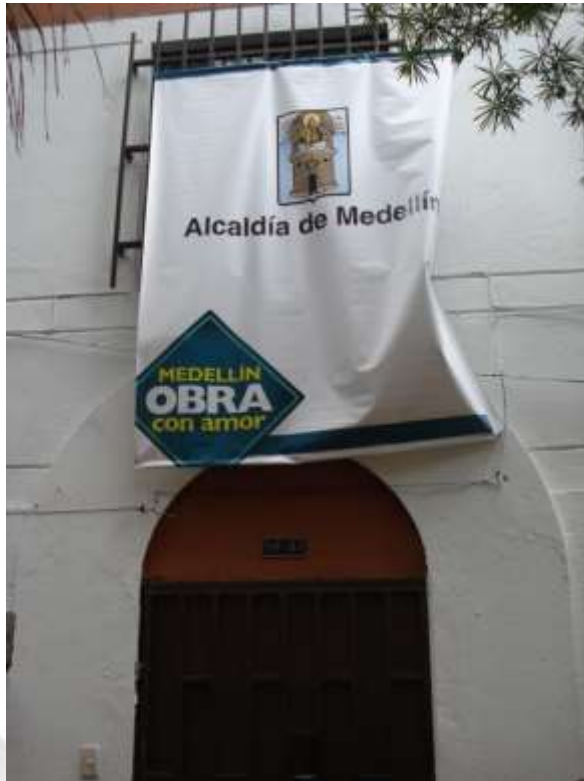
Locación del Proyecto en la Ciudad de Medellín Octubre de 2010