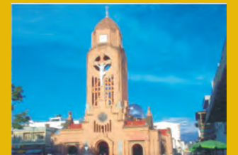
la iglesia jesús maría y José