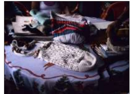
Muestra de productos y técnicas manejadas en el Grupo Indígena Saetas de Fuego. Cali – Valle del Cauca – 22 de Abril de 2010, Artesanías de Colombia S.A