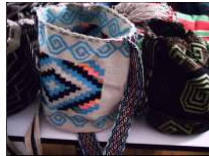
Muestra de productos y técnicas manejadas en el Cabildo Misak Guambiano Cali – Valle del Cauca – 24 de Abril de 2010, Artesanías de Colombia S.A.