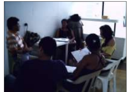
Fotografía N° 17, 18 y 19. Presentación del equipo de Artesanías de Colombia y socialización del proyecto ante el Cabildo Misak Guambiano.