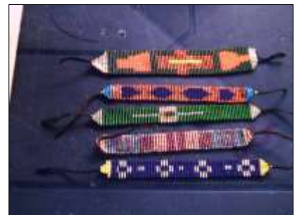
Muestra de productos y técnicas manejadas en el Cabildo Nassa Cali – Valle del Cauca – 24 de Abril de 2010, Artesanías de Colombia S.A.