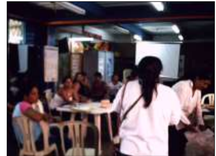
Muestra de productos y técnicas manejadas en el Cabildo Nassa Fotos tomadas por: DI. Karly Paola Osorio Sandoval y Claudia Ximena Pérez. Cali – Valle del Cauca – 24 de Abril de 2010, Artesanías de Colombia S.A.