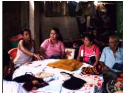
Jornada de presentación y socialización con el Grupo Indígena Saetas de Fuego. Fotos tomadas por: DI. Diana Giraldo y Karly Paola Osorio Sandoval. Cali – Valle del Cauca – 22 de Abril de 2010, Artesanías de Colombia S.A.