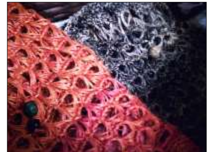
Cali – Valle del Cauca – 2 de Mayo de 2010, Diligenciamiento de FORFAT20 y Muestra de Productos Grupo Saetas de Fuego Artesanías de Colombia S.A.