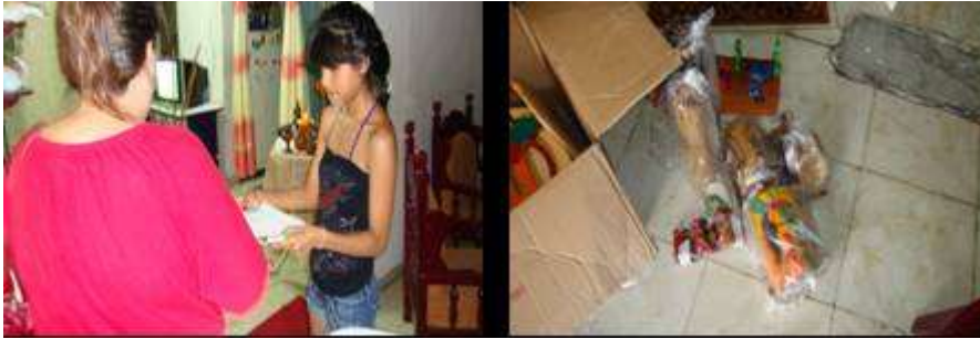
Fotografía N° 9,10,11,12 y 13 Entrega de productos, indígenas artesanos comunidad Asodeinca

Cali – Valle del Cauca – 21 de Junio de 2010, Artesanías de Colombia S.A.