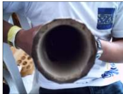
Se puede observar telarañas en el fondo del producto.