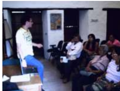
Fotografía N° 27,28,29 y 30. Primer Charla con el Cabildo Yanacona Fotos tomadas por: Claudia Ximena Pérez Cali – Valle del Cauca – 3 de Julio de 2010, Artesanías de Colombia S.A.