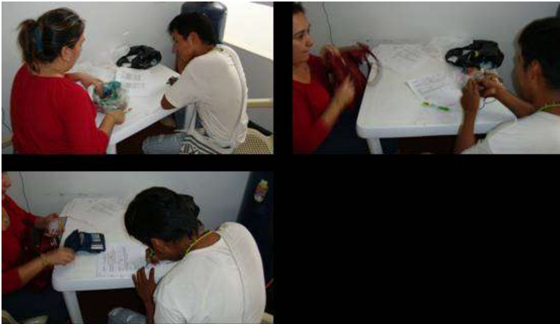
Fotografía N° 6,7 y 8 Entrega de productos indígenas artesanos comunidad Inga Cali – Valle del Cauca – 21 de Junio de 2010, Artesanías de Colombia S.A.