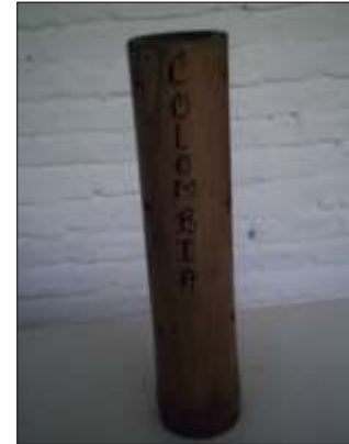
Guadua, producto decorativo y funcional: Porta incienso