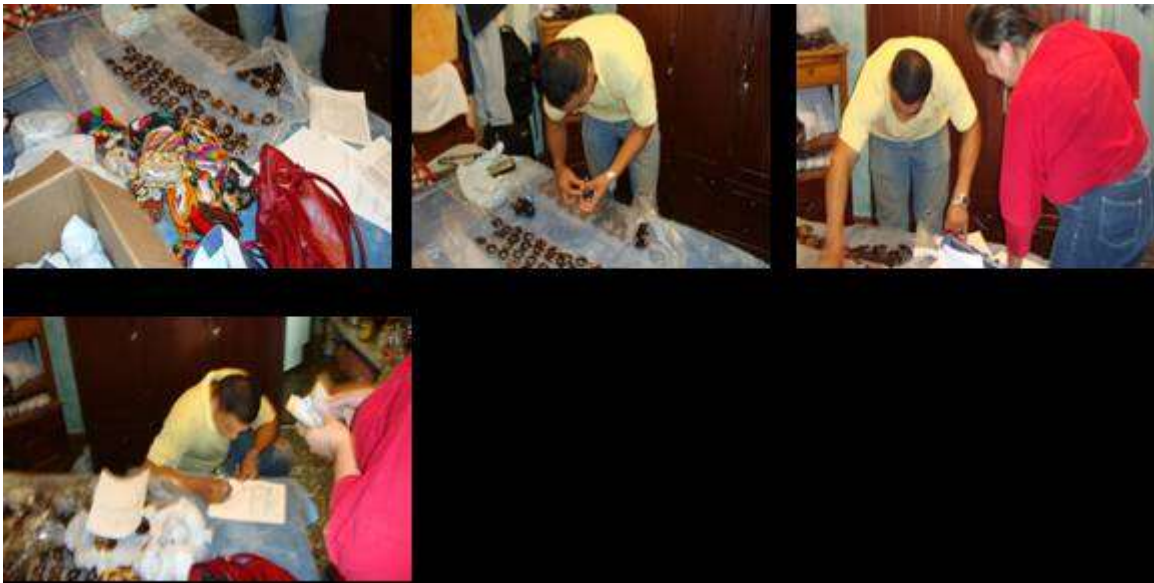
Fotografía N° 1,2,3 y 4 Entrega de productos indígenas artesanos comunidad Yanacona