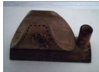
Guadua, producto decorativo y funcional: Servilletero con palillos.