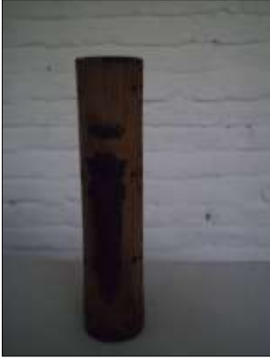
Guadua, producto decorativo y funcional: Porta incienso