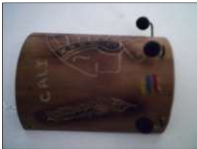
Guadua, producto funcional: Portallaves