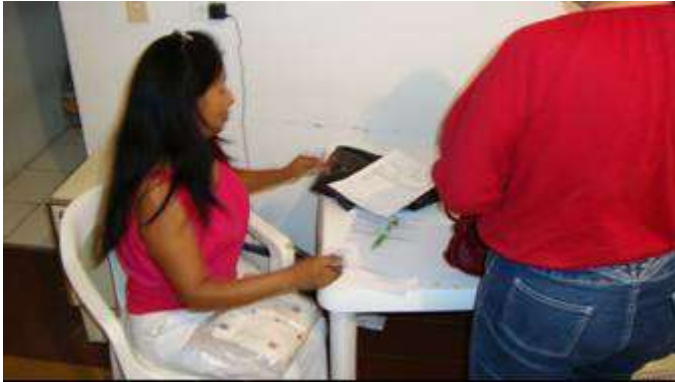
Fotografía N° 5 Entrega de productos indígenas artesanos comunidad Misak Guambiano

El cabildo Misak Guambiano con una ganancia de $ 415.000 pesos.