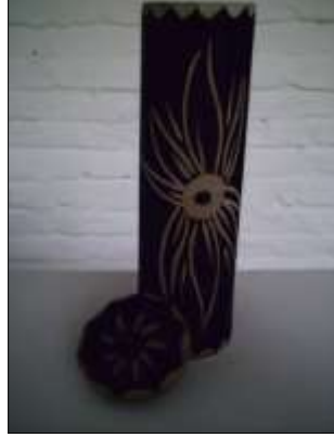
Guadua, producto decorativo y funcional: Porta incienso