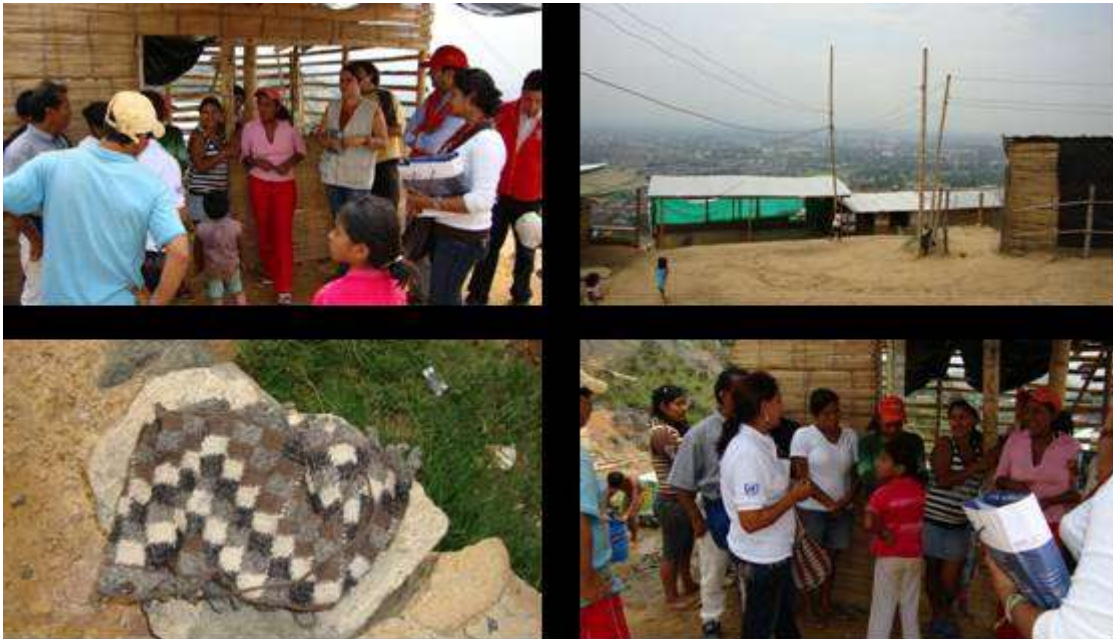
Fotografía N° 23,24,25 y 26. Socialización Cabildo Indígena Alto Nápoles Cali – Valle del Cauca – 25 de Junio de 2010, Artesanías de Colombia S.A.