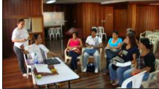
Fotografía N° 31 y32. Primer Charla con los beneficiarios Fotos tomadas por: DI Fabián Rodríguez Cali – Valle del Cauca – 14 de Julio de 2010, Artesanías de Colombia S.A.

Jornada de la Tarde, Charla Dirigida Por el Diseñador Industrial Fabián Rodríguez. Asistieron: