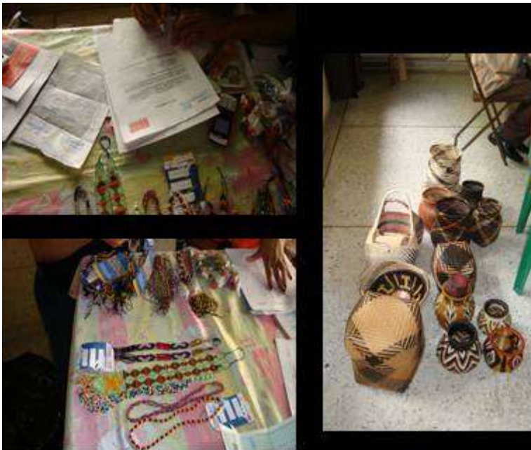
Fotografía N° 14,15 y 16 Entrega de productos, indígenas artesanos comunidad Joaquinquito del Río Naya

Junio 23 El equipo de AdC se reunió para la entrega de los productos y el dinero de la venta de los beneficiarios de Joaquinquito del Río Naya.