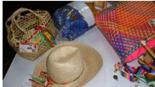
Fotografía N° 37 y38. Primer Charla con los beneficiarios Cali – Valle del Cauca – 14 de Julio de 2010, Artesanías de Colombia S.A.