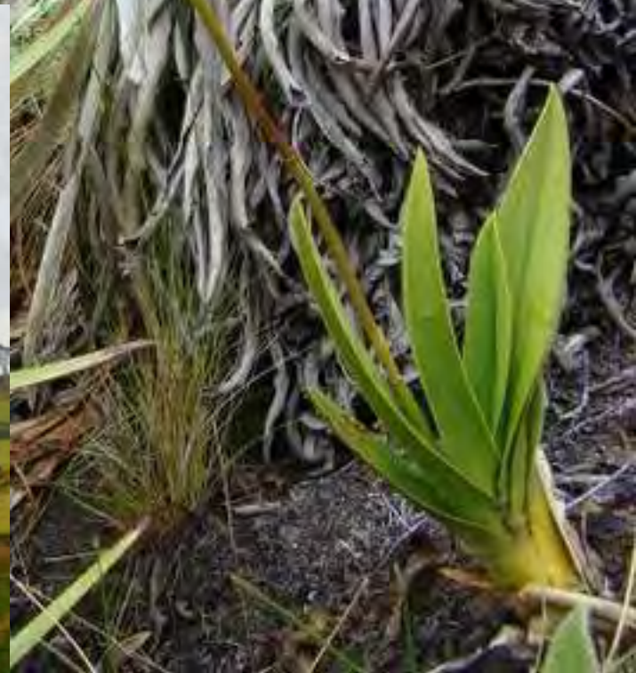
Verjón – Cruz Verde