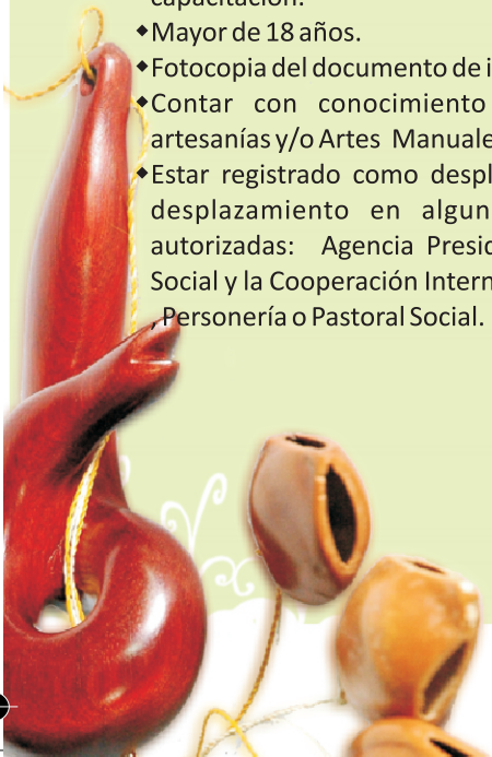
Talla en madera, Putumayo 2008

NOTA: No se admiten aprendices, ni personas que asumen la actividad como recreación o entretenimiento, por cuanto el programa se orienta a la cualificación del trabajo productivo con perspectiva de generación de ingresos.