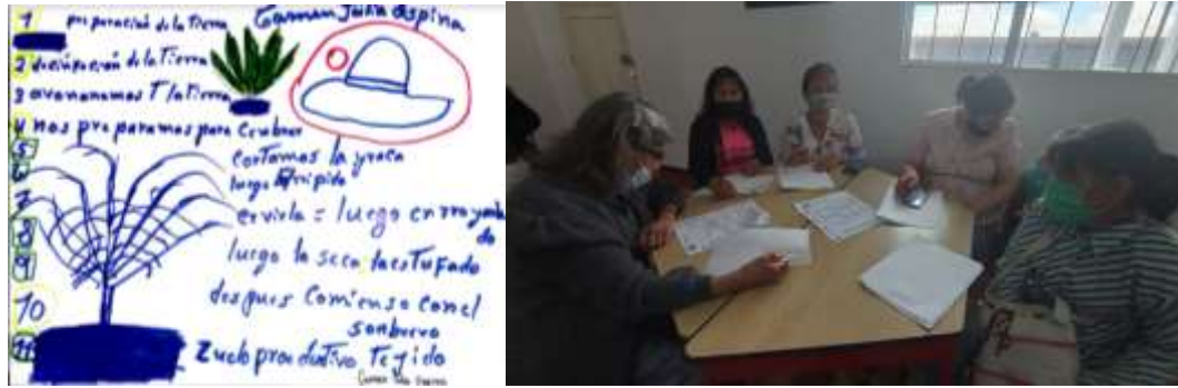
Imagen 11. Resultados ejercicio “Cartografía artesanal” y grupo de artesanas resolviendo las actividades. Aguadas, Caldas