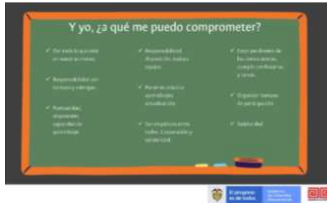
Imagen 1. Tablero de compromisos, producto del taller ¡Estamos de Acuerdo!