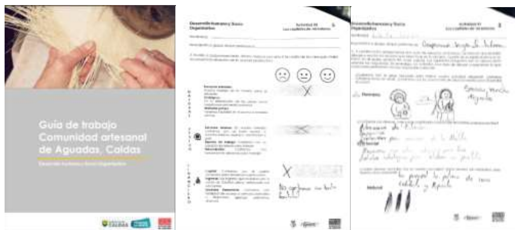
Imagen 10. Guía de trabajo y resultados ejercicio “El rostro de mis capitales”. Aguadas, Caldas