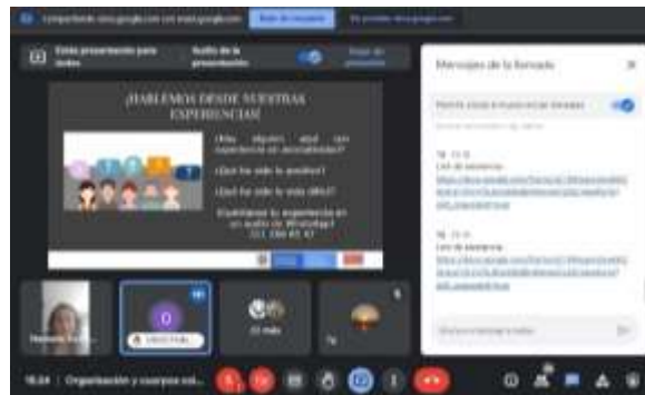
Imagen 7. Captura de pantalla, taller de Cuerpos colectivos, asociatividad y formalización