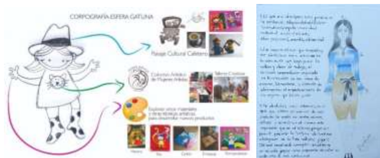
Imagen 4. Corpografías, producto del taller de Autorreconocimiento