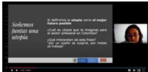
Imagen 9. Captura de pantalla, taller Plan de vida artesanal