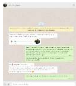
Imagen 2. Ejercicios y retroalimentaciones vía WhatsApp, producto del taller de identidad y referentes culturales.