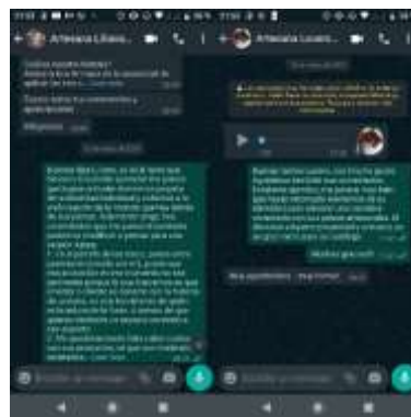
Imagen 2. Ejercicios y retroalimentaciones vía WhatsApp, producto del taller de identidad y referentes culturales.