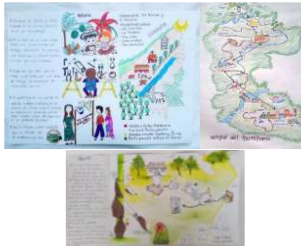
Imagen 3. Cartografías artesanales, producto del taller Cartografía artesanal