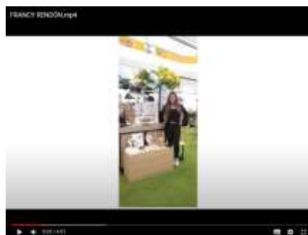
Imagen 8. Vídeo de narrativa sobre transmisión de saberes, producto del taller Transmisión de saberes artesanales.