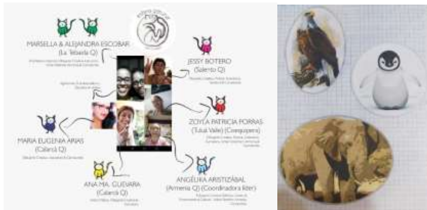
Imagen 5. Liderazgos inspirados en la naturaleza, producto del taller de Liderazgos