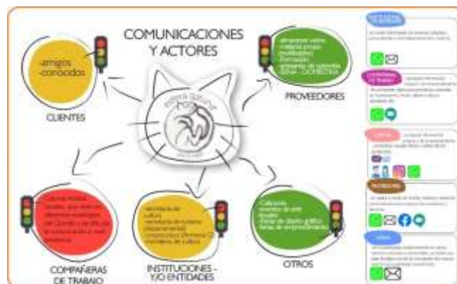
Imagen 6. Círculo de comunicaciones y actores, producto del taller de Comunicaciones