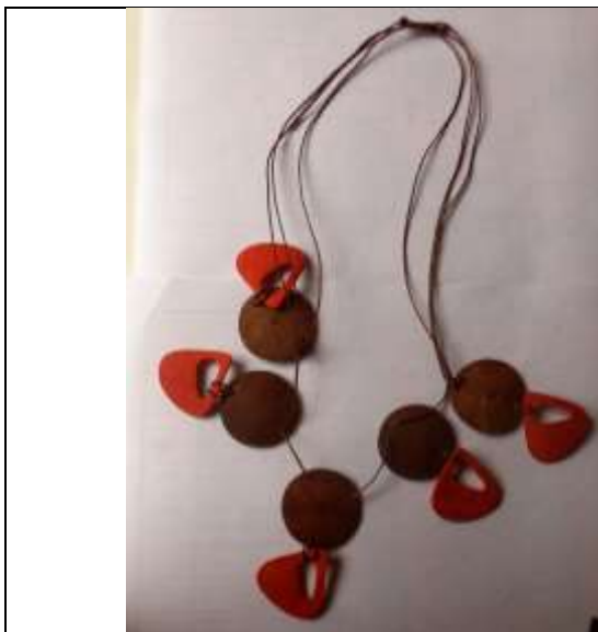
Producto antes del taller Santa María Abril 2017.