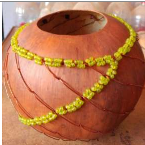
Producto después del taller . Santa María abril 2017.