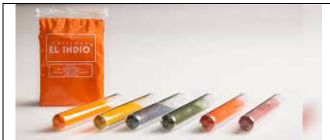
Anilinas el indio Santamaría – Marzo 2017- Foto tomada por Constanza Arévalo Corpochivor – Artesanías de Colombia