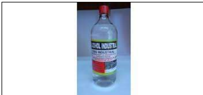
Alcohol industrial Santamaría – Marzo 2017- Foto tomada por Constanza Arévalo Corpochivor – Artesanías de Colombia