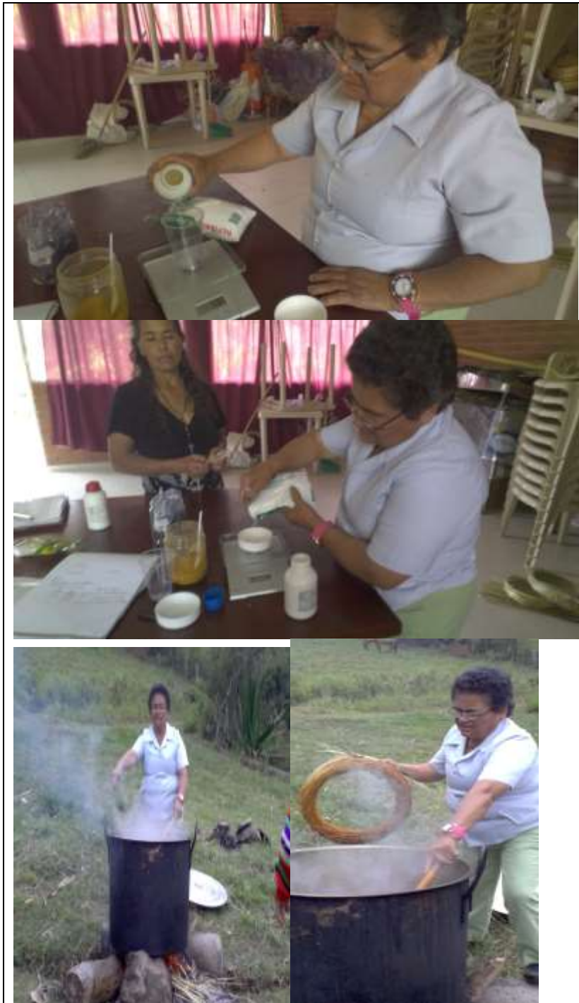
Talleres tintes Sutatenza Marzo 2017