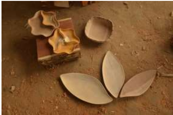
Lugar: Taller de artesanos en El Higerón Fecha : 04/04/2011 Descripción: Bandejas en forma de hoja de Higerón, Batea con remate de bejuco del balay y bandeja con módulos.