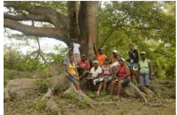
Lugar: Corregimiento Chichimán Fecha : 01/04/2011 Descripción: Los artesanos en el recorrido que se realizó por las vecindades de su territorio. Reconocimiento del árbol Higerón