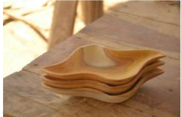
Lugar: Taller de artesanos en El Higerón Fecha : 03/04/2011 Descripción: Bandejas apilables en Colorado o Balaustre, producto del taller de creatividad.