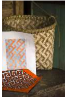
Lugar: Caimán Bajo Fecha : 21/05/2012 Descripción: Canasto, mola y dibujo con diseño geométrico compartido.