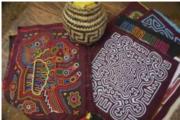
Lugar: Caimán Alto Fecha : 14/05/2012 Descripción: Conjunto de molas que una artesana está acumulando para elaborar 30 vestidos para la fiesta de pubertad de su hija adolescente.