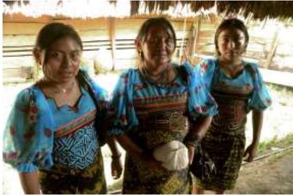
Lugar: Casa central Caimán Alto Fecha : 14/05/2012 Descripción: Mujer cuna con sus dos hijas. Las tres llevan una camisa de la misma tela como muestra de sus lazos familiares.