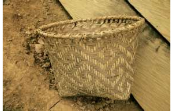
Lugar: Caimán Alto Fecha : 15/05/2012 Descripción: Canasto en iraca con diseño geométrico .