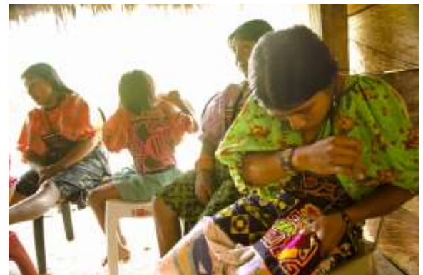
Lugar: Caimán Alto Fecha : 19/05/2012 Descripción: Mujer tejiendo mola.