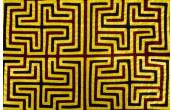
Lugar: Caimán Alto Fecha : 15/05/2012 Descripción: Mola geométrica destinada a la elaboración de una camisa para mujer.