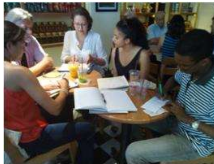
Imagen 28 Comité Diseño Cartagena 30 Agosto 2016