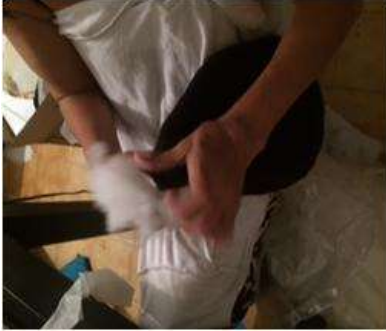
Imagen 19 proceso de relleno Cartagena D.C y T- Aplicación Tela 6 octubre 2016