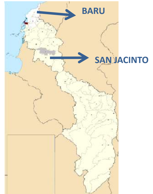
Grafico 2. Ubicación municipios de Barú y San Jacinto en el mapa de Bolívar