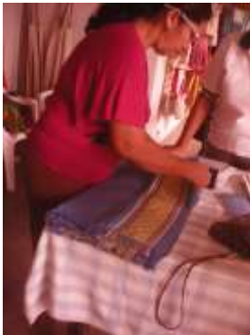
Imagen 5 proceso empaque San jacinto 25 Octubre 2016