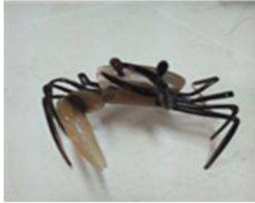
Imagen33 cangrejo en cacho Cartagena. talla en coco 4 Noviembre 2016