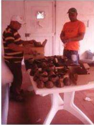
Imagen 3. proceso de empaque Cartagena D.C y T- talla coco 2 Noviembre 2016 Fotógrafo: Isabel Rodríguez Artesanías de Colombia