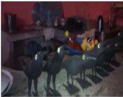
Imagen 23 proceso pintura Baru 13 Octubre 2016