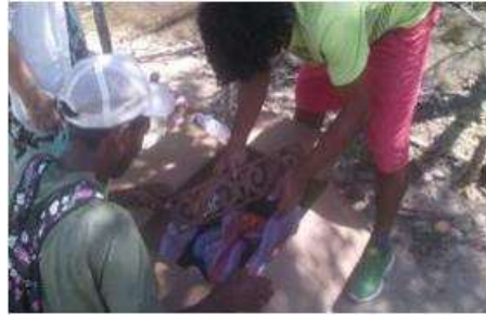
Imagen 2 proceso de empaque Barú 17 Noviembre 2016