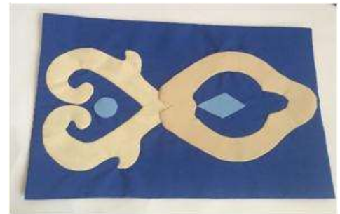
Imagen37 Individuales Cartagena aplicación en tela 4 Noviembre 2016