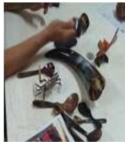
Imagen 18 proceso de corte Cartagena D.C y T- Talla en cacho 6 octubre 2016