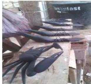
Imagen 10 Revisión de producto Barú 16 Noviembre 2016 Fotógrafo: Isabel Rodríguez Artesanías de Colombia