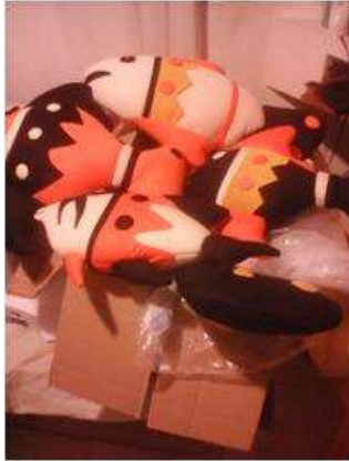
Imagen 7 proceso de empaque Cartagena D.C y T- Aplicación Tela 9 Noviembre 2016