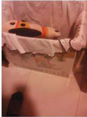
Imagen 8 proceso de empaque Cartagena D.C y T- Aplicación Tela 9 Noviembre 2016