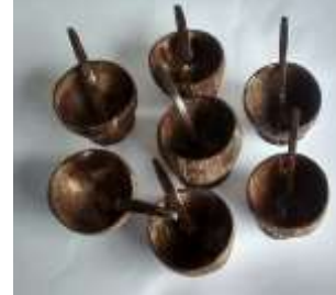
Imagen31 Juego cevicheros Cartagena. talla en coco 4 Noviembre 2016