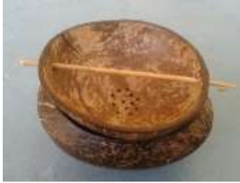
Imagen30 Colador Cartagena. talla en coco 4 Noviembre 2016