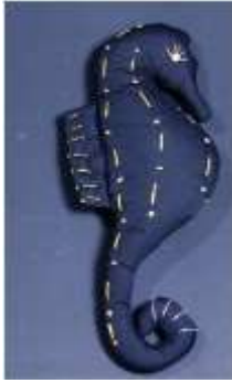
Imagen38 Caballito de Mar Cartagena aplicación en tela 4 Noviembre 2016 Fotógrafo: Isabel Rodríguez Artesanías de Colombia