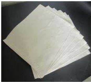
Imagen35 Individuales bordados San Jacinto 4 Noviembre 2016