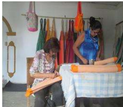
Imagen 6 Acompañamiento empaque San jacinto 25 Octubre 2016