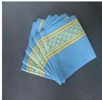
Imagen36 Portavasos labrados San Jacinto 4 Noviembre 2016