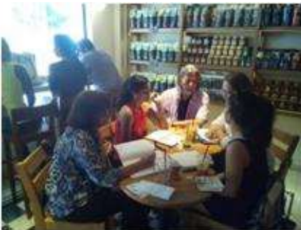
Imagen 27 Comité Operativo Cartagena 30 Agosto 2016