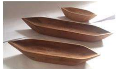
Imagen 43 Juego Canoas Baru Noviembre 2016

Se Enviaron a Expoartesanas 2016 Aproximadamente 395 Productos de las diferentes comunidades.