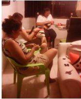
Imagen 20 proceso de costura Cartagena D.C y T- Aplicación Tela 6 octubre 2016