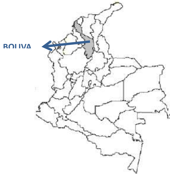
Grafico 1. Ubicación Bolívar en mapa de Colombia