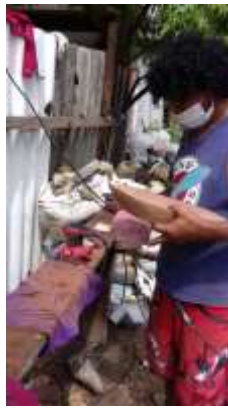
Imagen 24 proceso lijado Baru 13 Octubre 2016