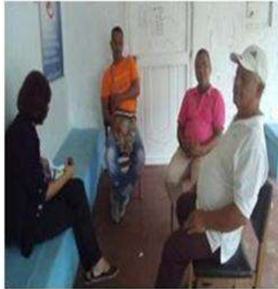
Imagen 26 Charla manual de uso Cartagena talla coco 29 Septiembre 2016