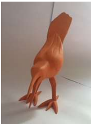
Imagen 41 Maria mulata Baru 4 Noviembre 2016 Fotógrafo: Isabel Rodríguez Artesanías de Colombia