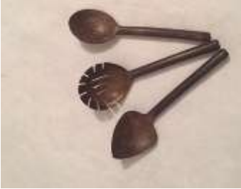
Imagen29 Juego Cucharones Cartagena. talla en coco 4 Noviembre 2016