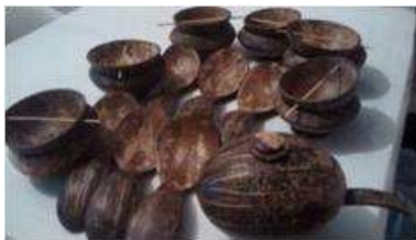
Imagen 11 Revisión de producto Cartagena D.C y T- Talla en coco 27 octubre 2016