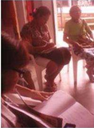
Imagen 25 Charla teoría del color San Jacinto 25 Octubre 2016