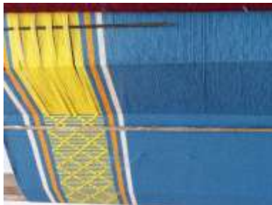
Imagen 16 Revisión de producto San Jacinto 12 octubre 2016