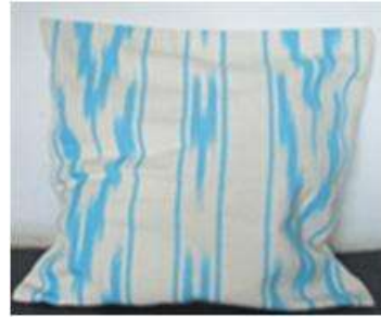
Imagen 40 cojin Lampazo San Jacinto 4Noviembre 2016