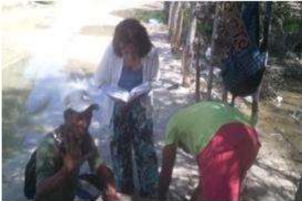
Imagen1. Acompañamiento en empaque Barú 17 Noviembre 2016

En el comité del 5 de octubre se analizaron los productos de recuperación y productos de compra de la colección anterior, en dicho comité se determino enviar los productos de recuperación para Expoartesanas 2016; y solicitar pedido a los artesanos de la colección anterior