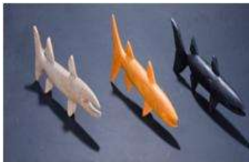
Imagen 42 Barracudas Baru Noviembre 2016