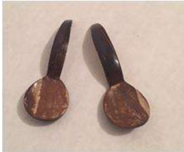
Imagen32 cucharones arroceros Cartagena. talla en coco 4 Noviembre 2016