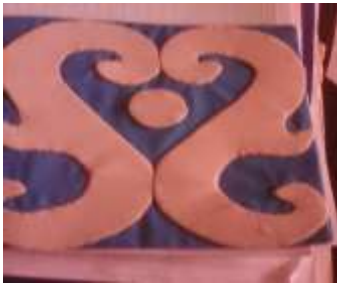
Imagen 13 Revisión producto Cartagena-aplicación tela 12 Octubre 2016 Fotógrafo: Isabel Rodríguez Artesanías de Colombia