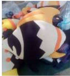
Imagen 14 Revisión producto Cartagena-aplicación tela 12 Octubre 2016