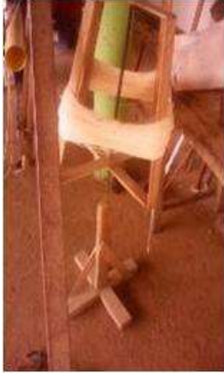
Imagen 22 proceso de amarre San Jacinto 12 octubre 2016