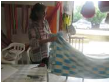
Imagen 15 Revisión de producto San Jacinto 12 octubre 2016 Fotógrafo: Isabel Rodríguez Artesanías de Colombia