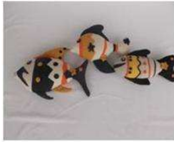
Imagen 39 Peces Cartagena D.C y T- Aplicación en tela 4Noviembre 2016 Fotógrafo: Isabel Rodríguez Artesanías de Colombia