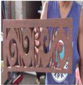
Imagen 9 Revisión de producto Barú 16 Noviembre 2016 Fotógrafo: Isabel Rodríguez Artesanías de Colombia