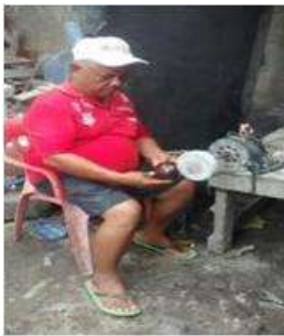
Imagen 17 proceso de pulimiento Cartagena D.C y T- Talla en coco 6 Octubre 2016