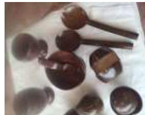
Imagen 12 Revisión de producto Cartagena D.C y T- Talla en coco 27 octubre 2016