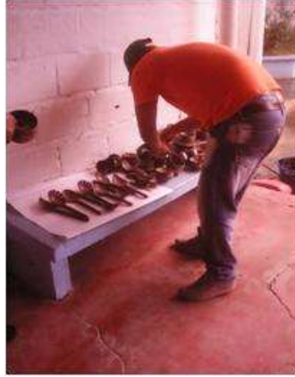
Imagen 4. proceso de empaque Cartagena D.C y T- talla coco 2 Noviembre 2016