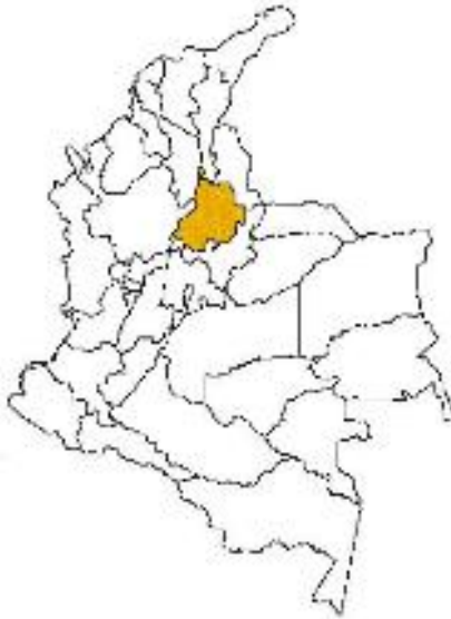
Mapa 1. República de Colombia