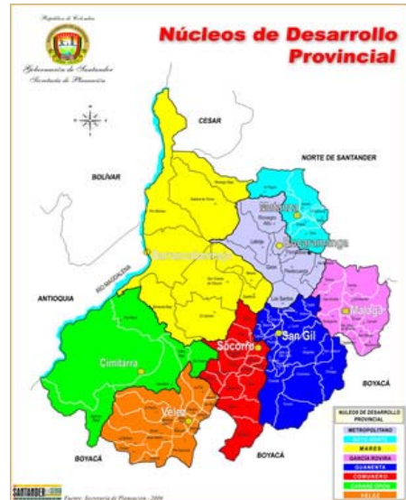
Mapa 2. Departamento Santander

Bucaramanga, capital del departamento de Santander limita por el Norte con el municipio de Ríonegro; por el Oriente con los municipios de Matanza, Charalá y Tona; por el Sur con el municipio de Floridablanca y; por el Occidente con el municipio de Girón.