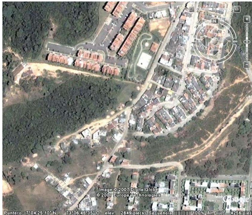
Foto 1, Fotografía Aérea de sector de Palomitas en Floridablanca.

El proyecto de asesoría en Diseño, se realizará en el municipio de Floridablanca, (Sector de Palomitas) municipio del extremo sur de la ciudad de Bucaramanga departamento de Santander.