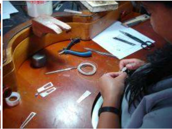
Rellenando las piezas con la filigrana