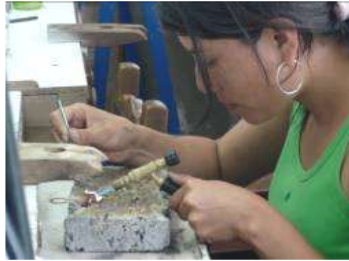
Proceso de calado, laminado y soldadura