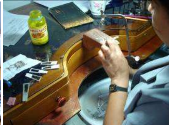
Proceso de calado, laminado y soldadura