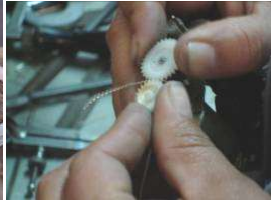
Haciendo el zigzag a la filigrana