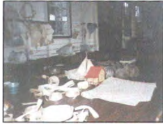
Trabajos en trenza.