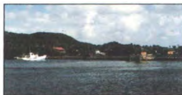
Geografía, contrasta, mar - montañas.