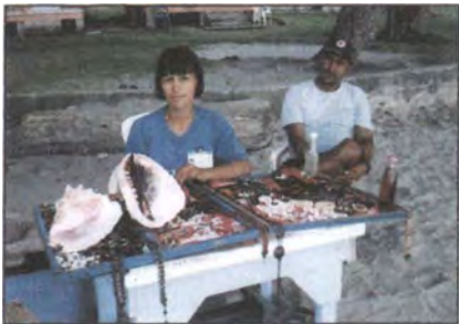
Productos que se venden en la playa.

Los productos elaborados en carey, coral y conchas obedecen a las habilidades del artesano que los realice, se encuentra, principalmente, bisutería como dijes, collares, aretes y pulseras; los tres materiales son trabajados con cuchillos, navajas, lijas y motortool