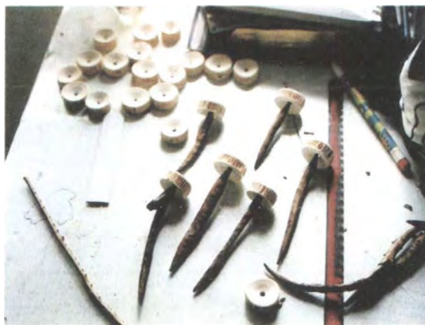
Propuesta de trinchas.

Las muestras con coral y carey se realizaron para una comercialización local y con el fin de que la artesana utilizara este material lo antes posible, pues está prohibido obtenerlo por cualquier medio y hay plazo para utilizar lo que se tenga en estos materiales hasta el 31 de diciembre de 2003.