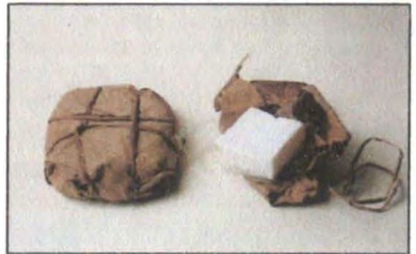
Jabones a base de aceite de coco, empacados en hoja de palma.