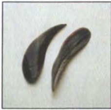
Uñas de caracol.