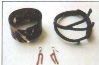
Pulseras en carey y coral.

Estos trabajos, si bien poseen buena manufactura, tienen el inconveniente que las materias primas tienen restricciones o son prohibidas para su extracción, debido al problema ecológico que causa en el tiempo.