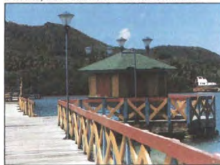
Puente, Providencia – Santa Catalina

Qué o cuáles materias primas se tiene para trabajar?