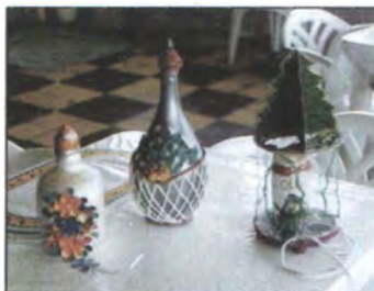
Envases reciclados y adornados.

El trabajo de reciclaje es combinado con materiales no reciclados, con los cuales se elabora productos decorativos y utilitarios; se hace reciclaje de botellas de vidrio y empaques de cartón y aluminio, combinados con papel y palitos de madera, entre otros.