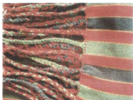
Hamaca adquirida en la comunidad de Santa Inés de Palito Sampedro

Las muestras de las cadenas productivas de cerámica, mopa-mopa, guadua y oro-Joya ya se han solicitado y aún no han sido remitidas por los artesanos.