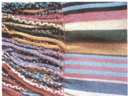
Hamaca adquirida en la comunidad de Morroa