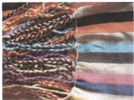
Hamaca adquirida en la comunidad de San Jacinto