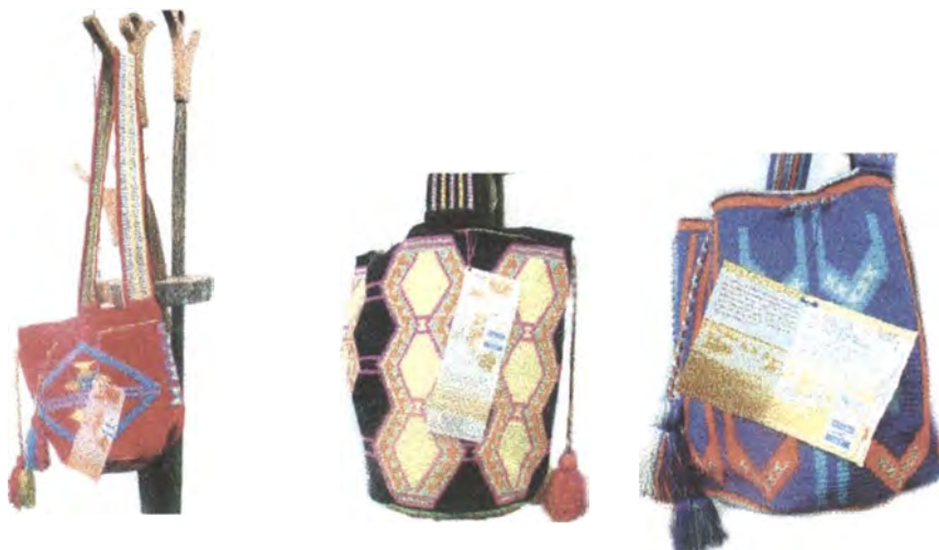
Mochilas de tres diferentes tamaños adquiridas a Jalianaya.