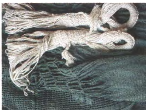
Chinchorro adquirido para las pruebas de tensión en trenzas y tejido