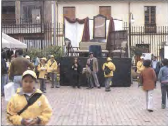
Inauguración de la Feria Bazarte, Sábado 23 de septiembre.

La Feria de Bazarte es la vitrina anual de la localidad de la Candelaria, que ha logrado reunir a más de 66 productoras del distrito, con el objetivo de exponer y comercializar sus productos de arte manual, artesanías y gastronomía. Este evento les ha dado la oportunidad de fortalecer sus iniciativas productivas y de contribuir con su imaginación y creatividad en los oficios y técnicas que desarrollan.