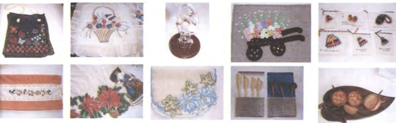
Lista de las mujeres productoras APROBADAS área de Artesanías