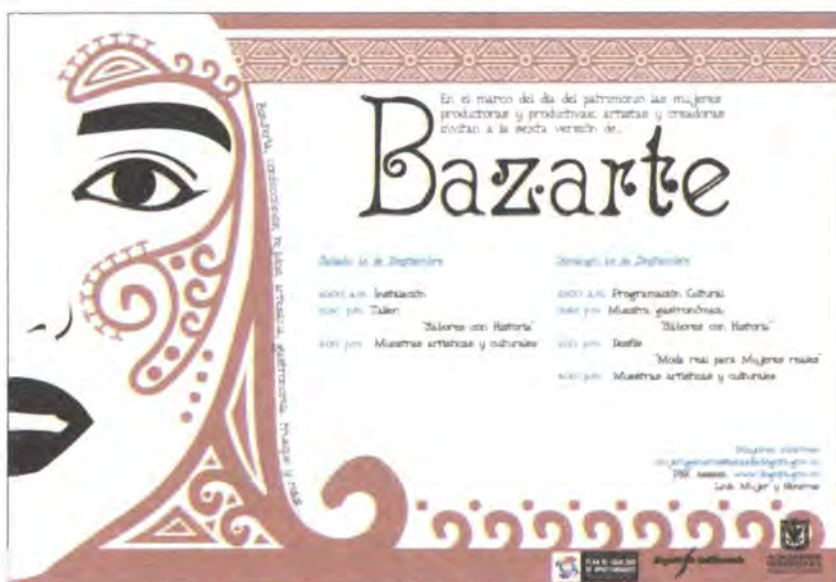
Arriba Imagen gráfica de la feria: Oficina de Prensa de la Alcaldía Mayor de Bogotá

Se ha incluido en el nombre la palabra Arte con el fin de vincular a mujeres artistas y creadoras y convertir este espacio en un acontecimiento social y cultural que estimule a las ciudadanas y ciudadanos de la ciudad a vincularse activamente a las dinámicas y posibilidades que ofrece el centro histórico de Bogotá.