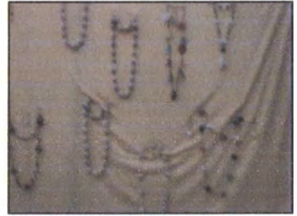
Fotos: Karly Paola Osorio Sandoval, Asesora Centro de Diseño, Muestra Empresarial Universitaria, Universidad de la Sabana, Jueves 9 de Noviembre