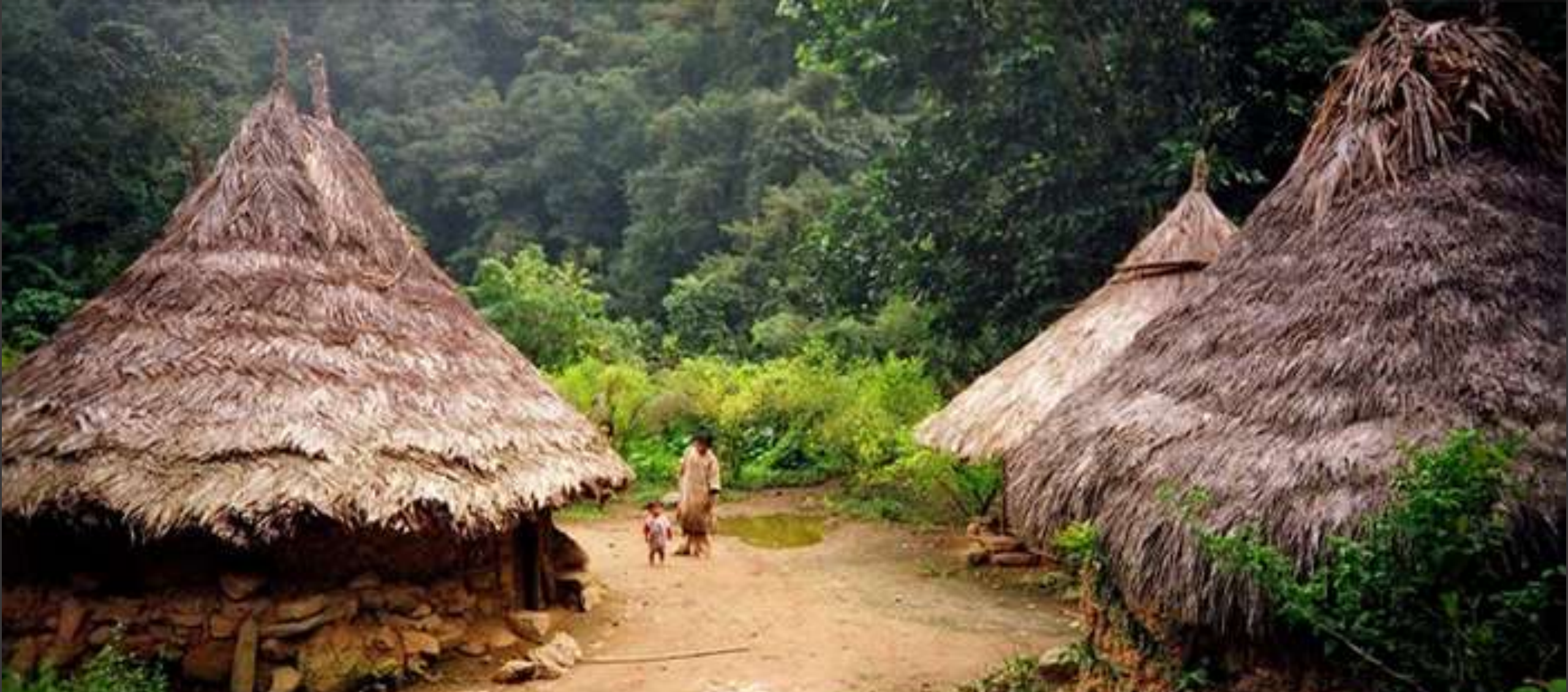
Kogui "Los guardianes de la armonía del mundo" - Kaggabba, Kogui, Cogui.