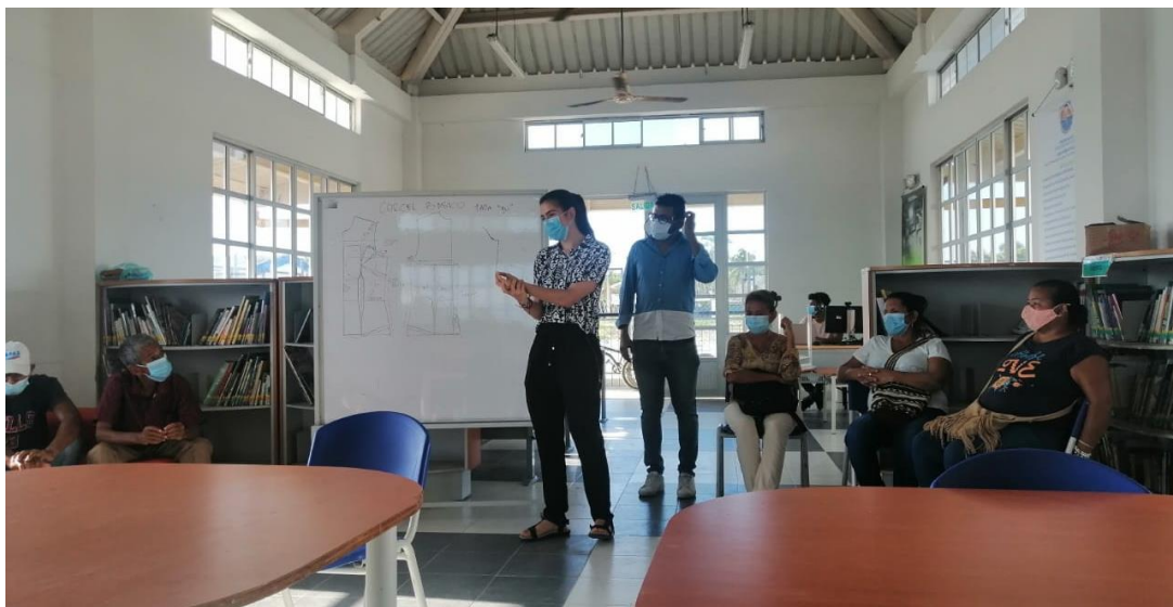
Fotografía 6. Presentación del Laboratorio de innovación y Diseño del Magdalena- Grupo de madera, proyecto Maestro Artesano. Pueblo Viejo, Magdalena, 2021.