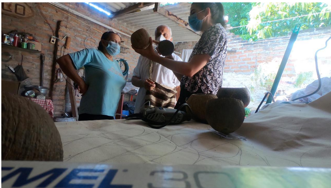
Fotografía 1. Asesoría de productos locales. Grupo de Coco Santa Marta, Magdalena, 2021.

Teniendo en cuenta los objetivos de la visita, se llevaron a cabo las actividades en 3 municipios conforme al plan que se presentó al supervisor y un cambio de municipio: No se visitó al municipio de Sitio Nuevo por razones de desplazamientos y se visitó al Municipio de pueblo Viejo en dos ocasiones, donde se realizó seguimiento, asesorías, Talleres y acompañamientos en procesos de elaboración de productos.