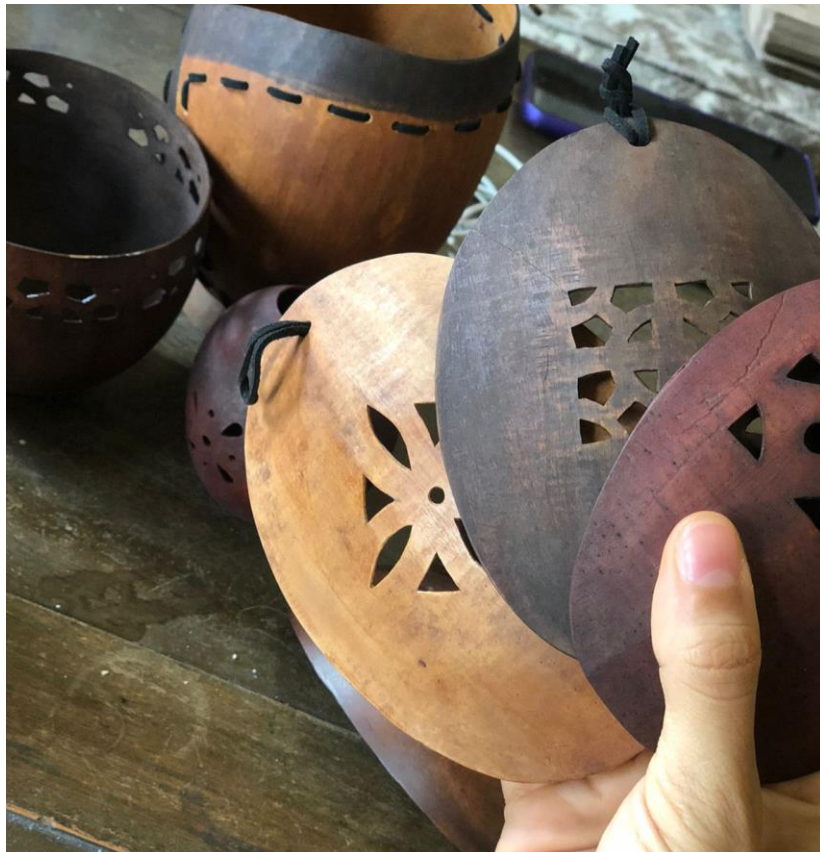
Fotografía 13. Paleta de color en el totumo Ciénaga, Magdalena, 2021.