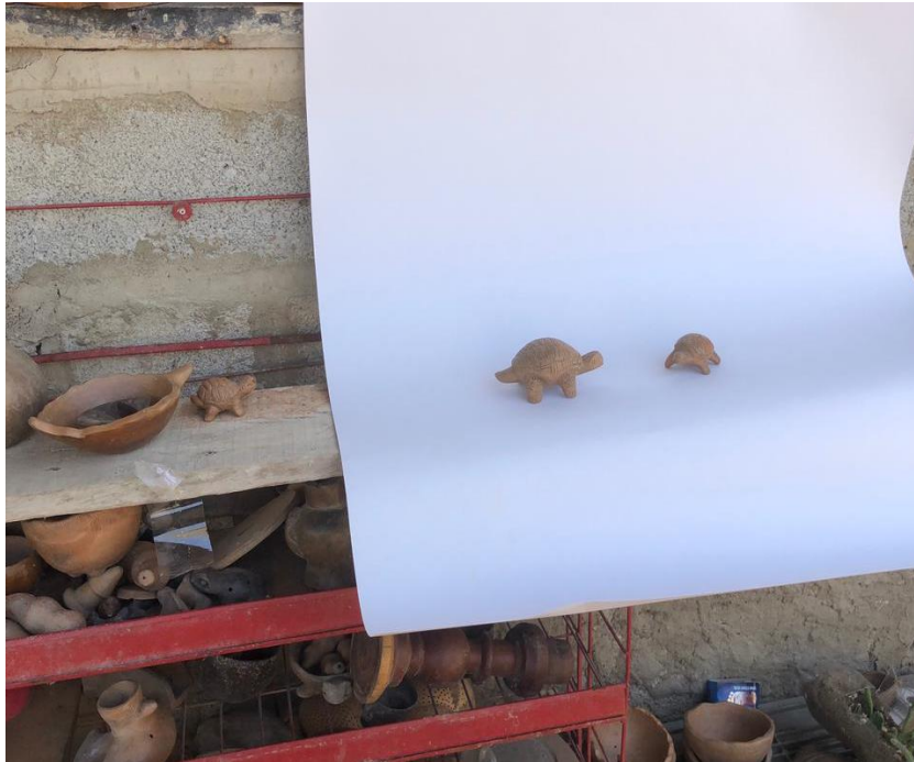
Fotografía 5. Taller de fotografía-. Trabajo en arcilla. Santa Marta, Magdalena, 2021.

en muestra elaborada por la artesana y sobre esta generar sugerencias de acabado y funcionalidad del producto.