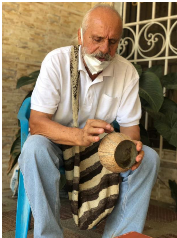
Fotografía 2. Explicación acabados en el coco. Grupo de Coco Santa Marta, Magdalena, 2021.

Se realizó visita al grupo de artesanos de trabajo en coco de Santa Marta, con el fin de llevar a cabo una curaduría de productos y diagnóstico de oficio, donde se conoció más a fondo el proceso de elaboración de sus productos y se tuvo claro las dificultades e ideales del grupo para un mejor desarrollo de producto.