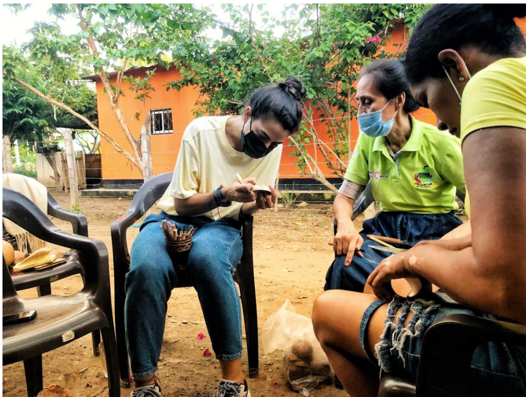
Fotografía 19. Asesoría puntual de muestras de productos. Vereda San Eduardo, El Banco Magdalena, 2021.

Se enfatizó en el acabado / pulido del totumo, realizando actividad práctica de lijado, elaborando el paso a paso para la eliminación total de la cascara del fruto, cabe resaltar que el grupo artesanal no realizaba este proceso como acabado de sus artesanías.