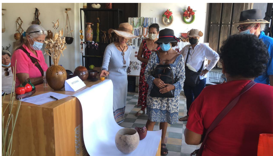
Fotografía 8. Taller práctico de fotografía – Grupo de totumo Ciénaguero Ciénaga, Magdalena, 2021.

Se realizó el encuentro en La Galería Artesanal, donde el grupo de artesanas tiene expuesto la mayoría de su trabajo. Se inició la reunión con una presentación por parte de la Diseñadora, contando un poco de lo que se ha venido trabajando de manera virtual y escuchando a las artesanas sobre este mismo proceso de trabajo.