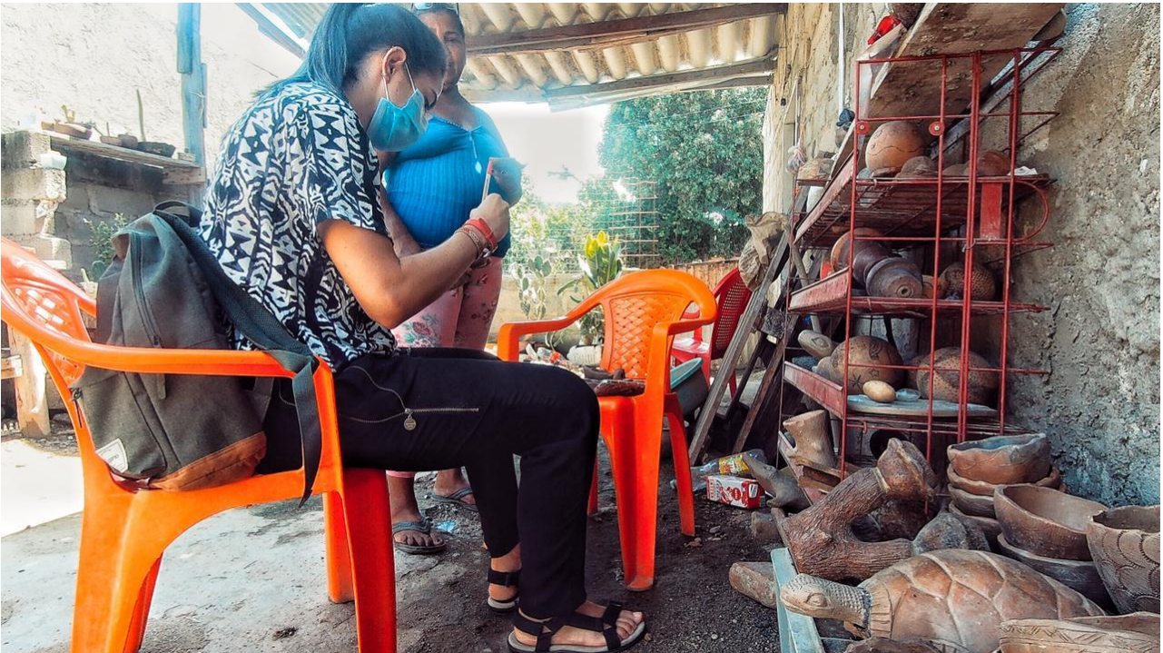
Fotografía 4. Asesoría de productos locales. Trabajo en arcilla. Santa Marta, Magdalena, 2021.

Se logró conocer el espacio de trabajo de la artesana, brindando un recorrido y socialización de las zonas que va utilizando de acuerdo a los pasos a realizar en el producto. Se realizó actividad de curaduría de producto y asesoría en muestras de producto local, brindando sugerencias de mejoramiento en el proceso de acabados y en diversificación de sus productos. Se trabajó también en propuesta de codiseño para producto de identidad caribe, realizando asesoría puntual