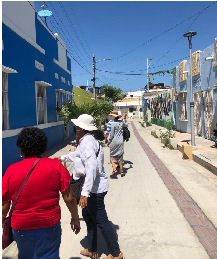
Fotografía 11. Actividad de referentes e Inspiración – Grupo de totumo Ciénaguero Ciénaga, Magdalena, 2021.

Se hizo asesoría puntual sobre parte de la producción para colección Nacional, se logró salir de dudas con respecto a unos inconvenientes encontrados en productos ya casi terminados y lograr ver el buen trabajo realizado por las artesanas en los diseños ya finalizados.