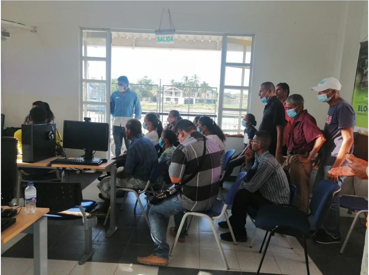
Fotografía 7. Taller de Diseño para la Artesanía y socialización de ejemplos de diversificación en productos de Madera – Grupo de madera, proyecto Maestro Artesano. Pueblo Viejo, Magdalena, 2021.

Se inició primer contacto con la comunidad realizando presentación del equipo del Laboratorio Magdalena, explicando el rol desde el diseño aplicado en el desarrollo del proceso artesanal y finalizando en diseño de producto.