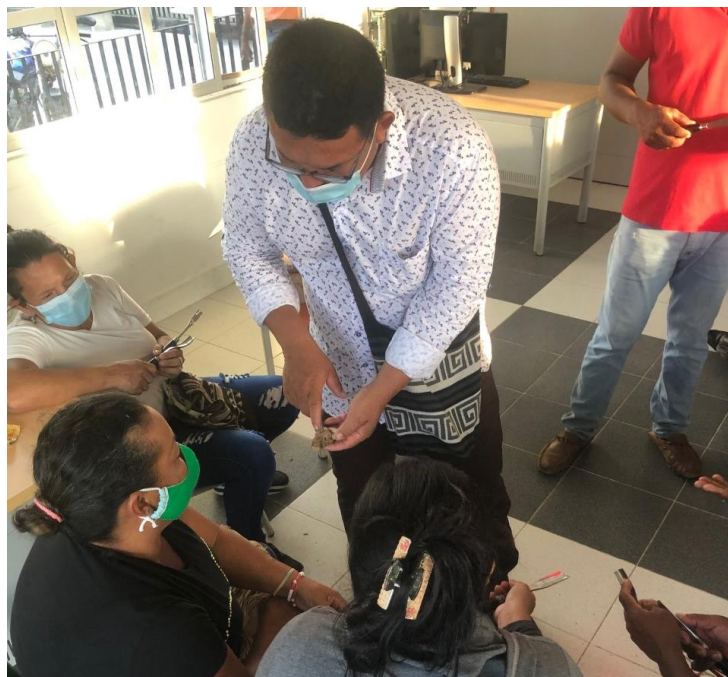
Fotografía 17. Inicio de talleres, Maestro Artesano de Pueblo viejo. Pueblo Viejo, Magdalena, 2021.

Se hizo acompañamiento al inicio de actividades en el Proyecto Maestro Artesano, desde un punto más práctico, donde los artesanos tuvieron un primer contacto con herramientas básicas para el inicio de la talla y la explicación de los diferentes tipos de madera que se pueden encontrar.