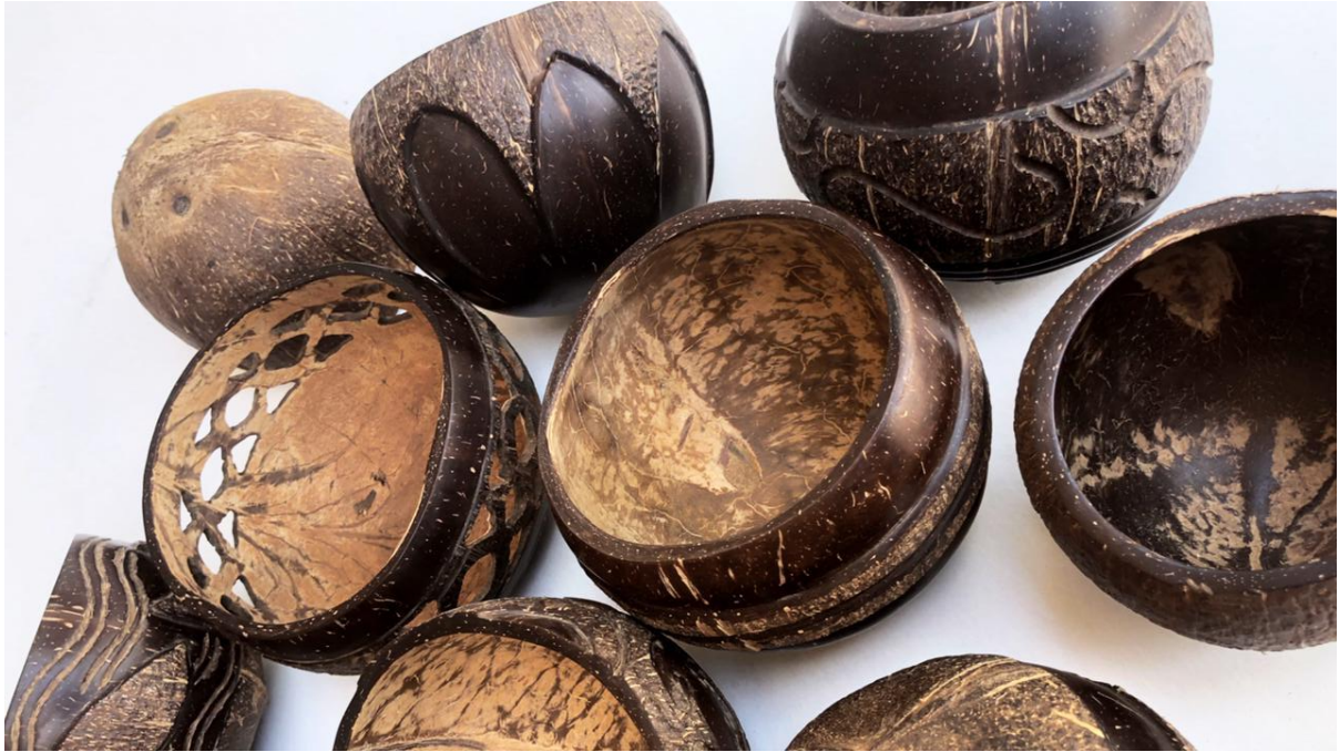
Fotografía 3. Muestras de productos en coco, diferentes acabados y aplicación de técnicas en la materia prima. Santa Marta, Magdalena, 2021.