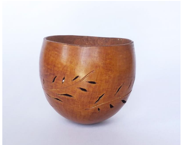
Fotografía 9 y 10. Resultado de Taller práctico de fotografía – Grupo de totumo Ciénaguero Ciénaga, Magdalena, 2021.

Se realizó un taller práctico de Referentes e Inspiración: