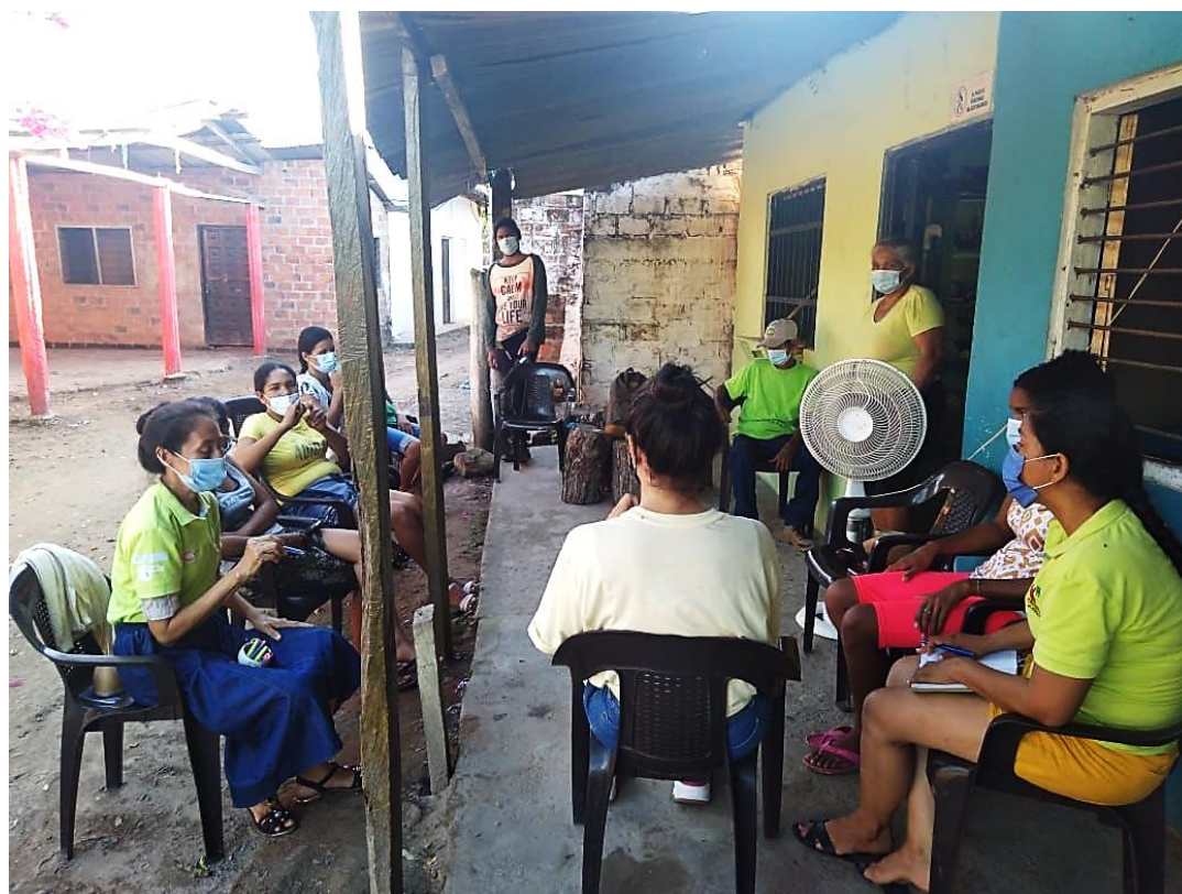
Fotografía 18. Socialización actividades realizadas y charla con grupo de artesanos. Vereda San Eduardo, El Banco Magdalena, 2021.

Se realizó encuentro con la comunidad de Totumo de la vereda San Eduardo, se inició la reunión con una presentación y brindándoles a las artesanas el espacio donde ellas pudiesen compartir sus puntos de vistas con respecto al proceso que se venía llevando de manera virtual.