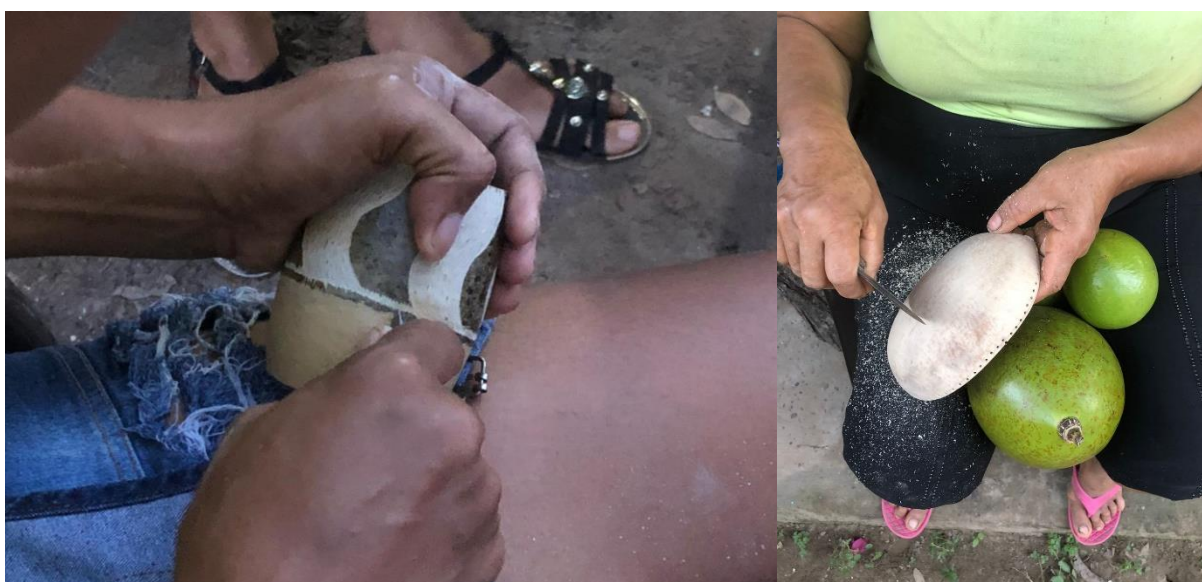
Fotografía 20 y 21. Actividad de acabado en el totumo. Vereda San Eduardo, El Banco Magdalena, 2021.

Se enfatizó en el acabado / pulido del totumo, realizando actividad práctica de lijado, elaborando el paso a paso para la eliminación total de la cascara del fruto, cabe resaltar que el grupo artesanal no realizaba este proceso como acabado de sus artesanías.