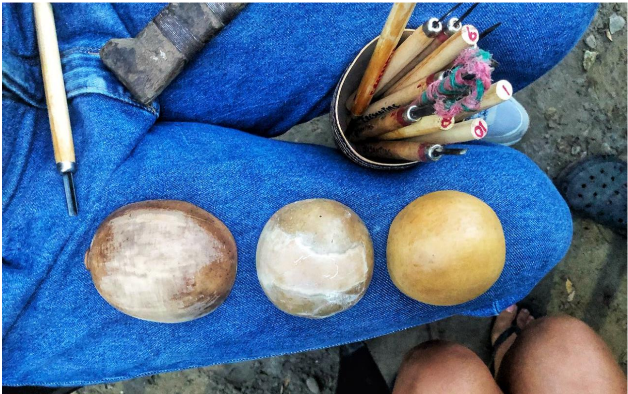
Fotografía 22. Resultado de Proceso de aplicación de técnica de pulido en el totumo. Vereda San Eduardo, El Banco Magdalena, 2021.

Con cada artesana se trabajó en la experimentación en el totumo en lograr este tipo de acabado con la herramienta que más se le facilitara y luego encontrar la forma de aplicar técnicas de talla o grabado sobre el totumo, cada una intentó lograr este tipo de acabados y aplicaron como prueba aceites naturales para lograr diferentes tonalidades.