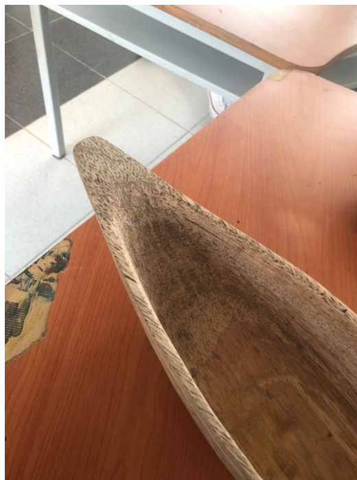
Fotografía 14 y 15. Productos locales en madera de artesanos en Proyecto maestro artesano Pueblo Viejo, Magdalena, 2021.

se socializó el tema de referentes como punto importante en el desarrollo de un trabajo artesanal, teniendo en cuenta que la idea de este proceso además de elaborar productos, es que estos comuniquen parte de lo que es o se vive en el municipio de Pueblo Viejo y sus alrededores