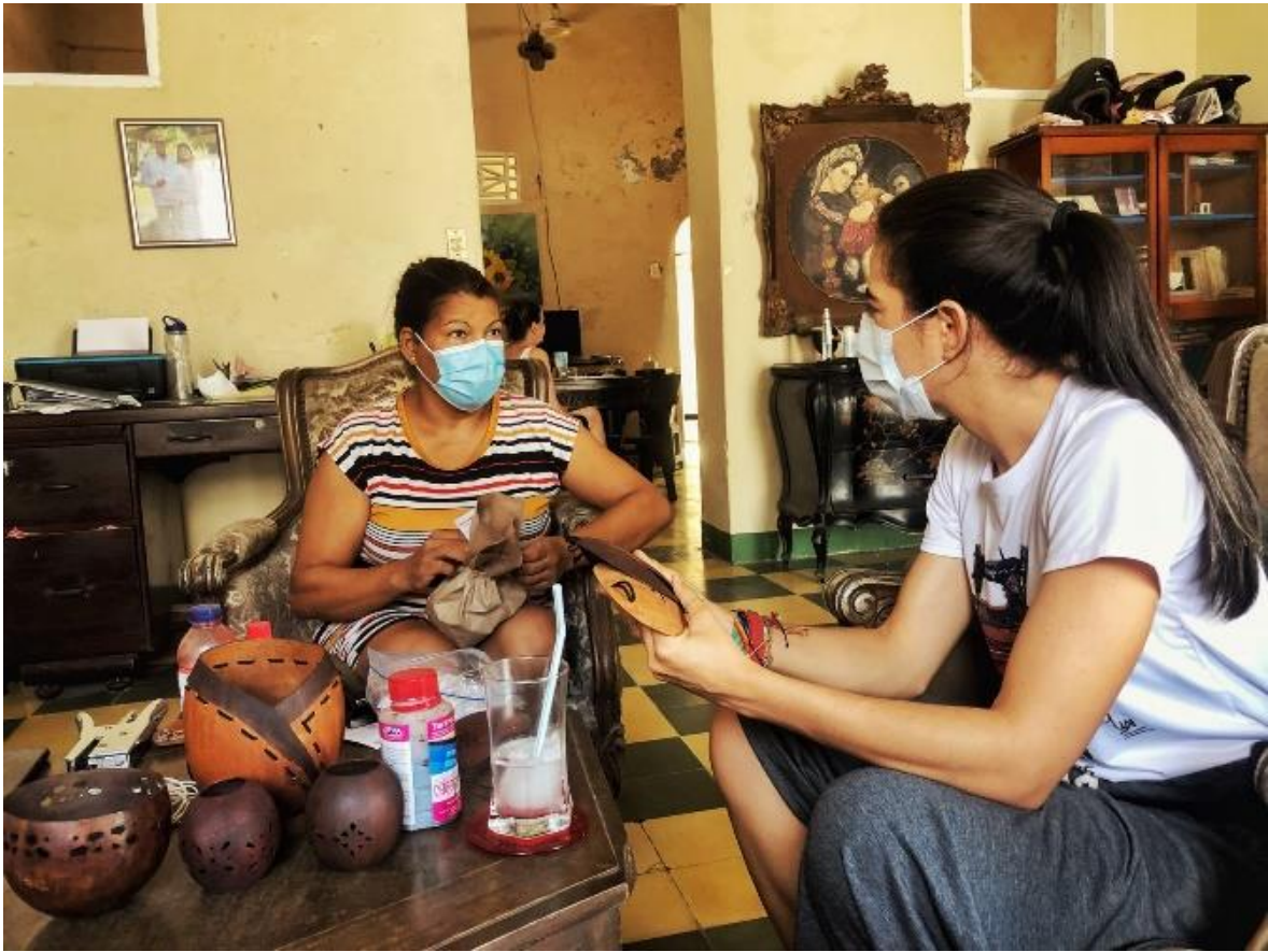
Fotografía 12. Asesoría puntual de productos con líder de comunidad. Grupo de totumo Ciénaga, Magdalena, 2021.