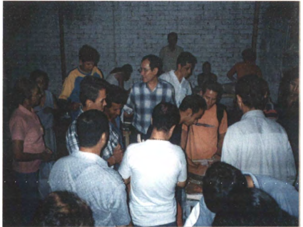
Reunion Artesanos de Neiva