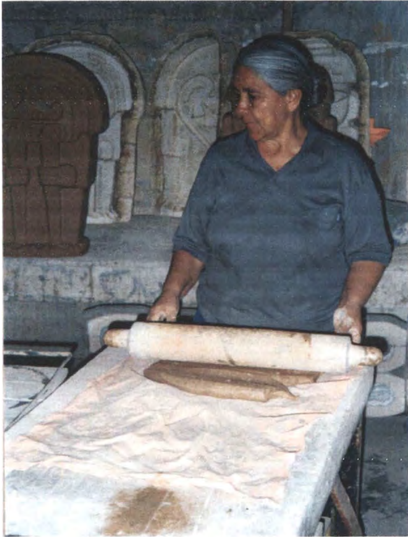
• Artesana Ceramista del Municipio de Pitalito

En el Municipio cercano de Campoalegre en el centro del departamento unas 40 familias se dedican a la alfarería , comúnmente labor realizada por mujeres