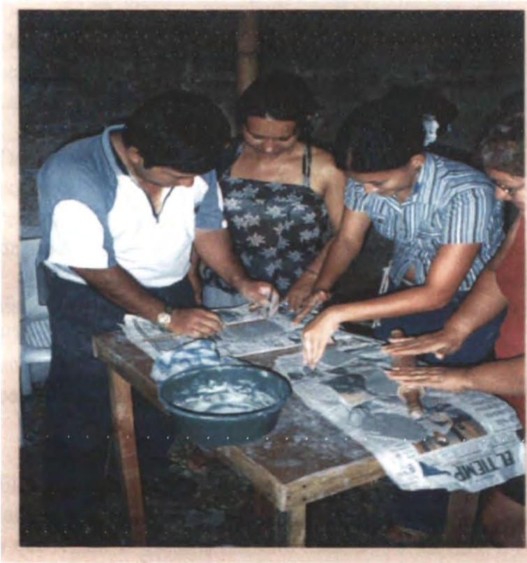
Taller de creatividad en Neiva