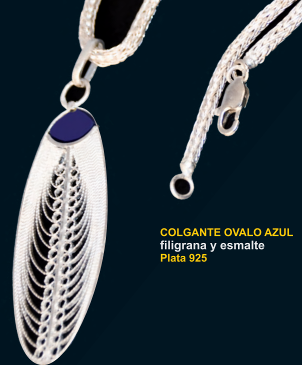
COLGANTE OVALO AZUL filigrana y esmalte Plata 925