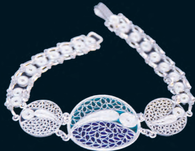
PULSERA CIRCULAR filigrana y esmalte Plata 925