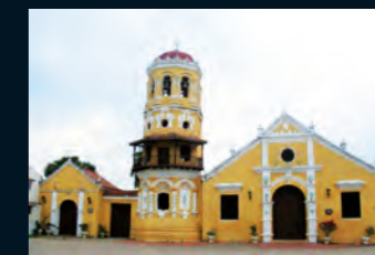
iglesia santa bárbara