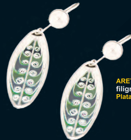
ARETES OVALO VERDE filigrana y esmalte Plata 925