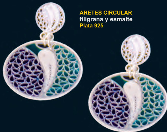
ARETES CIRCULAR filigrana y esmalte Plata 925