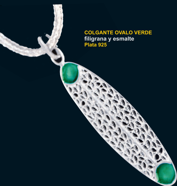
COLGANTE OVALO VERDE filigrana y esmalte Plata 925