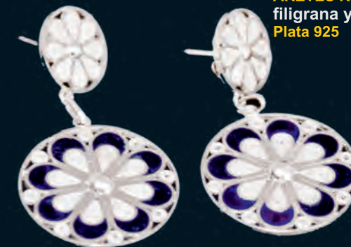
ARETES ROSETON filigrana y esmalte Plata 925