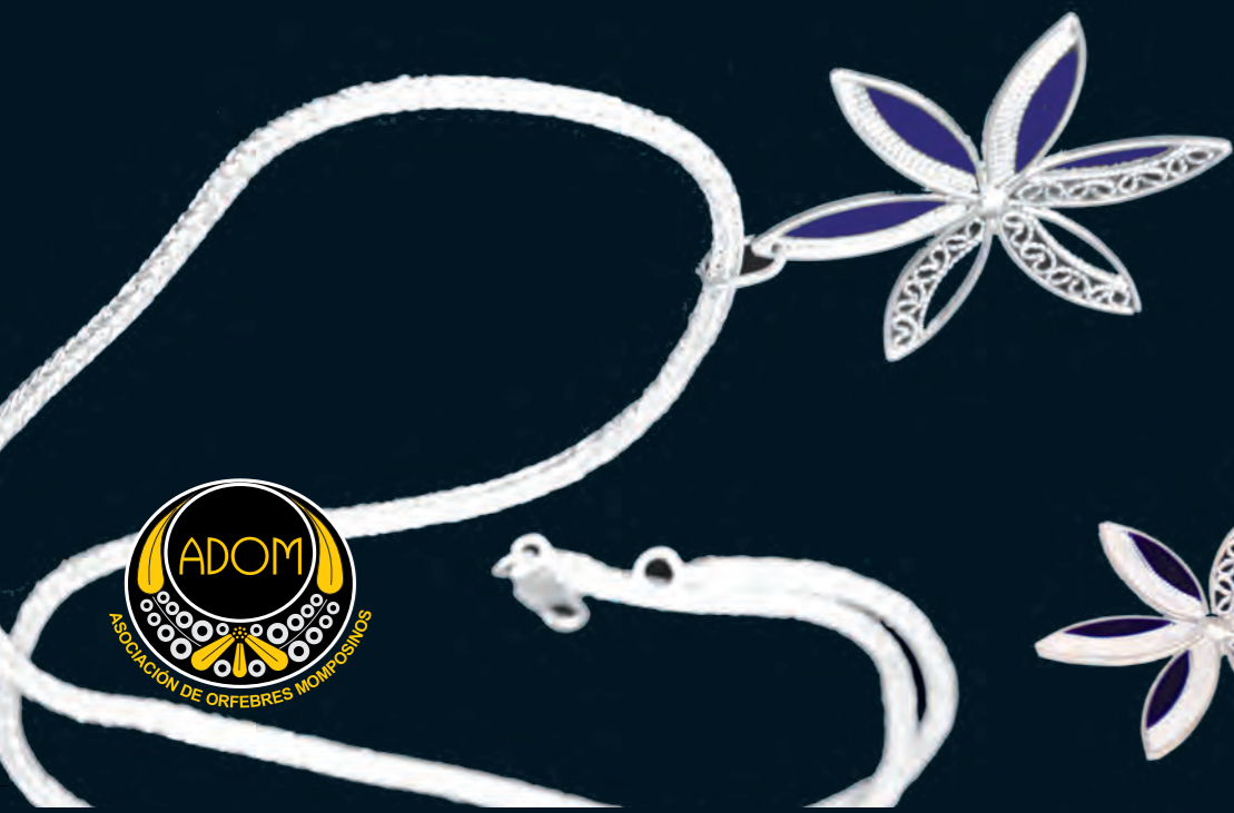
COLGANTE ESTRELLA filigrana y esmalte Plata 925