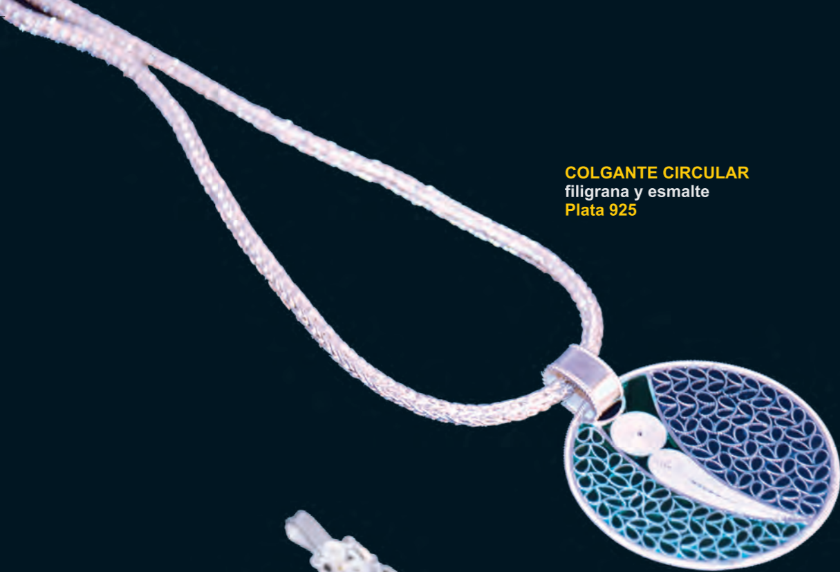
COLGANTE CIRCULAR filigrana y esmalte Plata 925