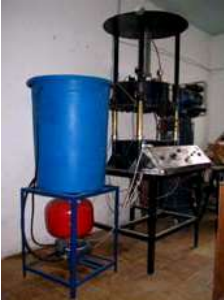
Cadena productiva de Iraca - Nariño