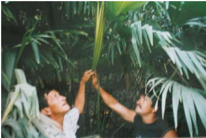
Cadena productiva de Iraca - Nariño