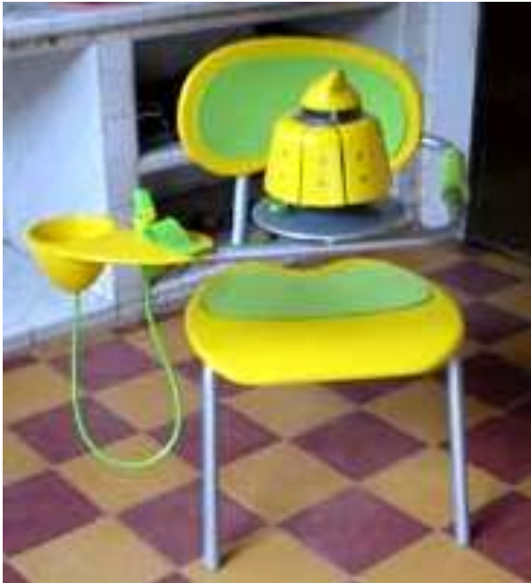
Puesto de trabajo tejido