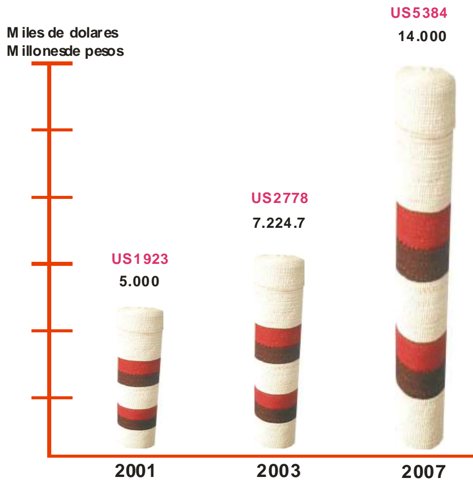
Cadena productiva de Iraca - Nariño