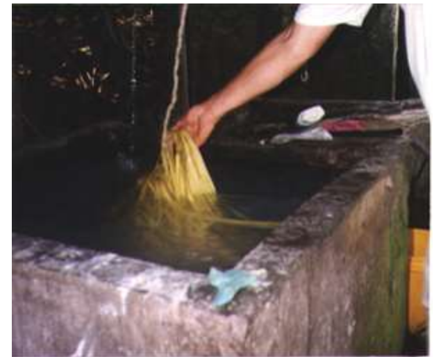
Cadena productiva de Iraca - Nariño