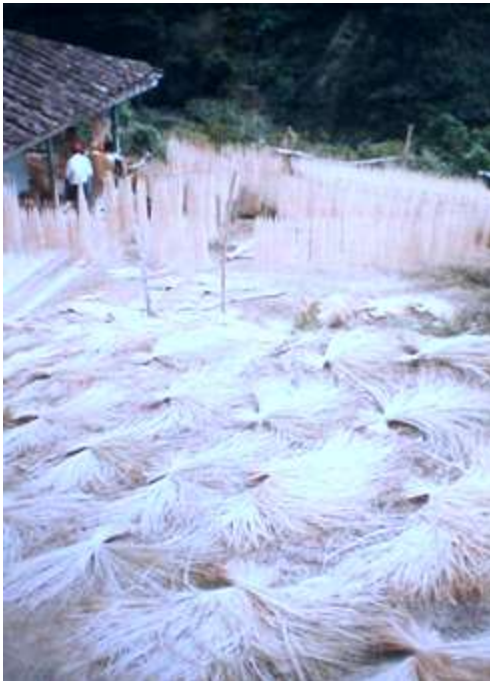
Secado al aire libre