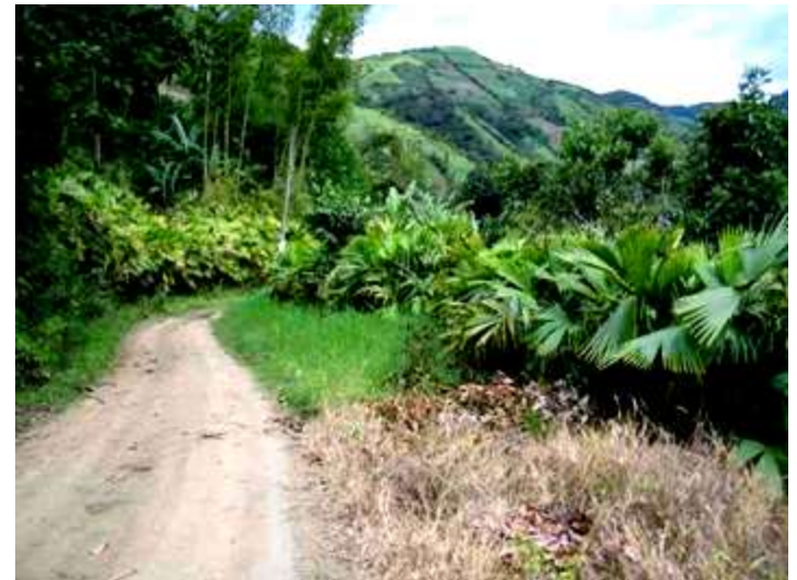
Cadena productiva de Iraca - Nariño