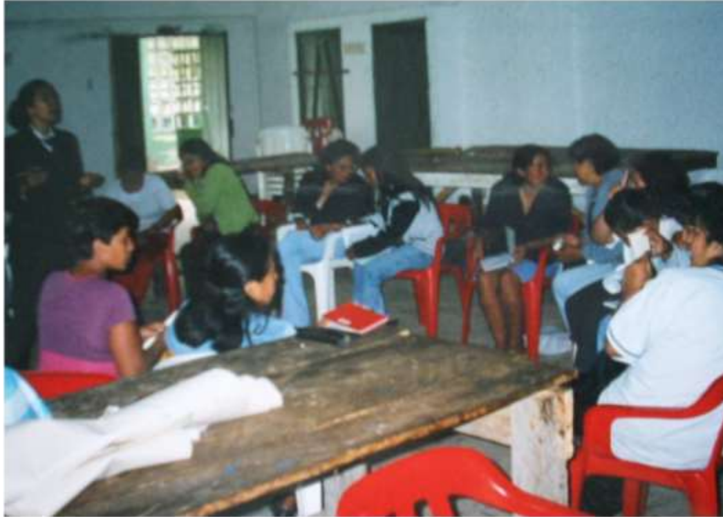
Cadena productiva de Iraca - Nariño